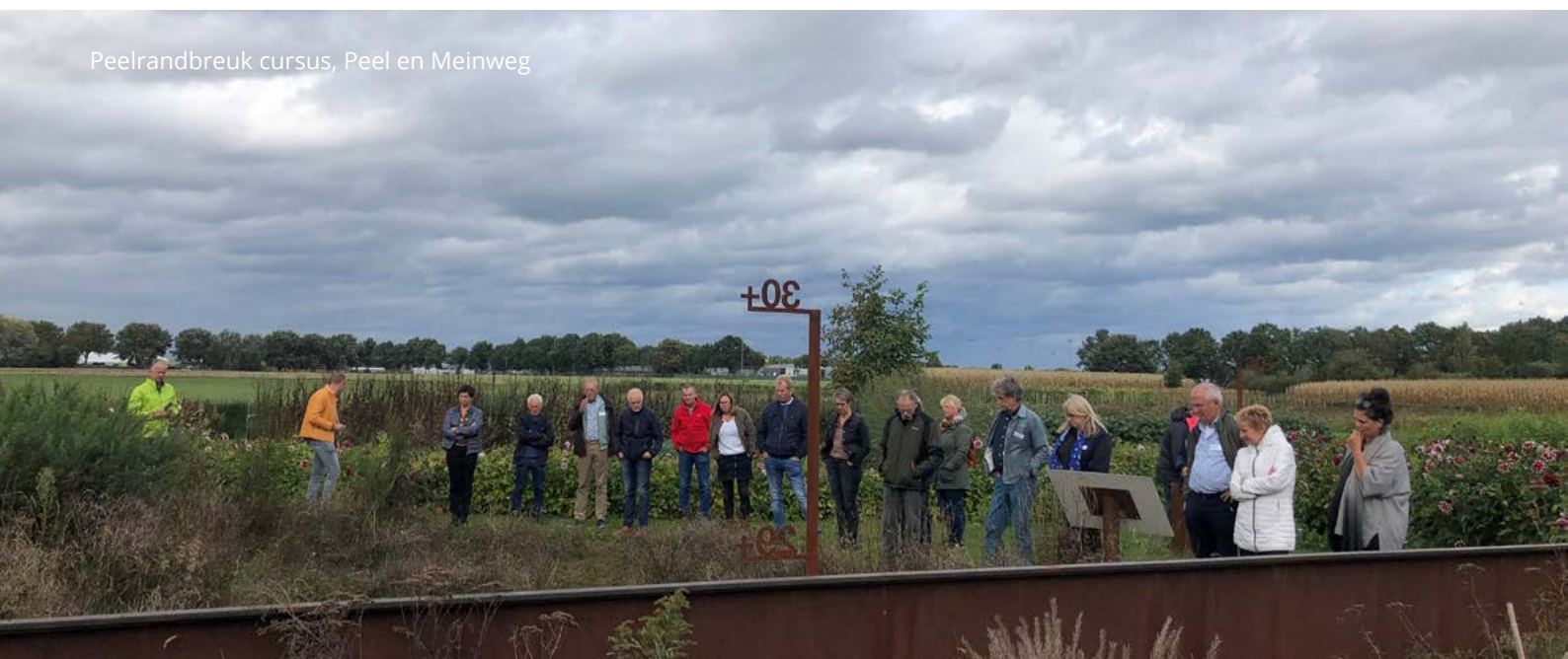
Peelrandbreuk cursus, Peel en Meinweg

In hoofdstuk 5 zoomen we verder in op de behaalde resultaten via onze diverse communicatiekanalen en -campagnes: 'Communicatie & Campagnes: samen meer bereiken'. In hoofdstuk 6; 'Maatwerk: een greep uit ieder nationaal park', lichten we een specifiek, uniek project uit per nationaal park. Dit onderstreept de diversiteit en kracht van maatwerk in het nationaal park.