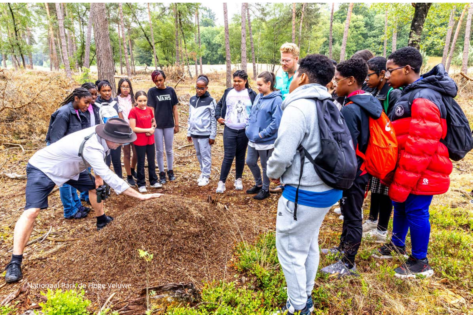
Nationaal Park de Hoge Veluwe