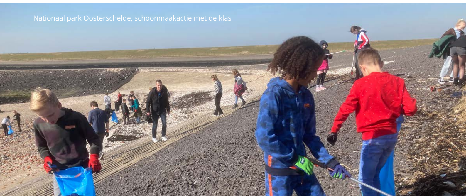
Nationaal park Oosterschelde, schoonmaakactie met de klas