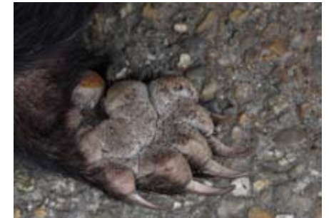
Voorpoot = graafpoot.