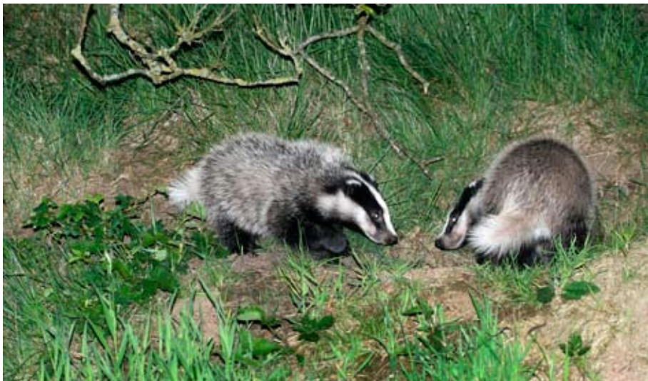
Stoeiende jonge dassen in juni.

Een volwassen das heeft een lengte van 75-90 cm en een hoogte van 30 cm. Het staartje is ongeveer 20 cm. Het gewicht varieert van 7 tot 14 kilo. In het najaar kan dat oplopen tot 20 kilo. Ter vergelijking: een vos weegt tussen de 4 en 9 kilo. In het wild kunnen dassen 15 jaar worden, maar de meesten sterven voor het zevende levensjaar. In het verkeer vallen de meeste slachtoffers. Zeugen kunnen gemiddeld drie jongen per jaar krijgen. De paartijd valt in februari, maar ook later paren de dieren nog. De draagtijd wordt met drie tot tien maanden verlengd, omdat de vruchtjes zich pas in het najaar innestellen. Acht weken later worden de jongen geboren, in februari. Ze zijn naakt en blind. De beer, die na de geboorte van de jongen graag wil paren, wordt door de zeug naar een ander deel van de burcht gestuurd of hij gaat naar een bijburcht in de buurt. De zeug is bang dat de jongen in de verdrukking komen. Onder streng toezicht van de zeug komen de jongen eind april of begin mei voor het eerst naar buiten, vaak al vroeg in de avond. Vandaar dat tellingen in mei plaatsvinden.