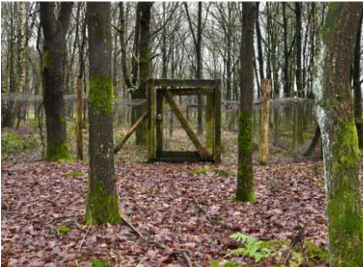
Restant van de hokken in een bos bij Wijster van waaruit dassen zijn uitgezet in de tachtiger en negentiger jaren.

Het gaat goed met de das in Drenthe. Dat is niet altijd zo geweest. Door stroperij en versnippering van het landschap verdween de das vrijwel overal uit Drenthe. Vroeger werd de das bejaagd om zijn pels en vet. Van het vet maakte men medicijnen. Om de vermeende schade die ze aanrichtten, werden ze in klemmen en strikken gedood. Van de haren maakte men (scheer)kwasten. In 1960 werd de das beschermd. Onder leiding van Jaap Dirkmaat werd in 1981 Das&Boom opgericht. Hij wilde bedreigde diersoorten beter beschermen, maar ook hun leefomgeving. Hij ving gewonde en verweesde dassen op in een centrum. In 1984 zorgde het soortbeschermingsplan van het Ministerie van LNV ervoor dat er voorzieningen als dassentunnels werden aangelegd. Overal in het land verbeterde ook de leefomgeving. Er ontstonden nieuwe nationale parken en nieuwe natuur werd in het kader van de EHS aangelegd. Dirkmaat achtte het milieu in zeven provincies geschikt voor het uitzetten van 210 dassen op 26 lokaties. Dat gebeurde tussen 1987 en 2001, in Drenthe bij Wijster.