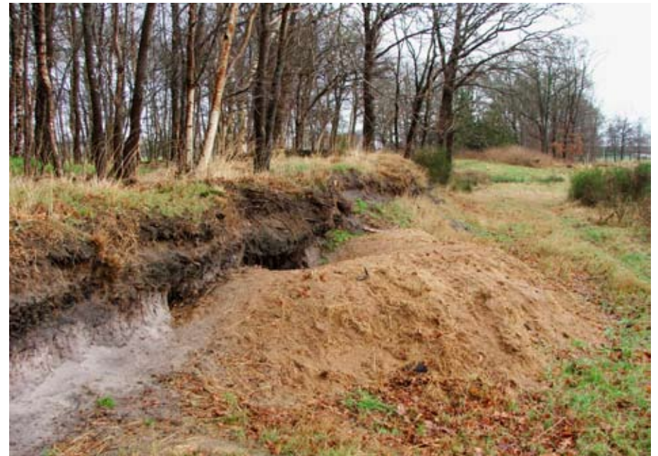
Burcht in een zandlaag bedekt met ingeklonken veen.

Op de inventarisatiekaart van de werkgroep is een patroon van meer dan 80 burchten te zien rondom Hoogeveen. Dat roept vragen op. Waar gaan de jongen heen? Ontmoeten ze jongen van andere burchten om samen verder te gaan? Met andere woorden: hoe en waarom vindt migratie plaats? Er zijn vermoedens, want sporen wijzen op contact tussen nabijgelegen burchten. Veel blijft echter onzeker.