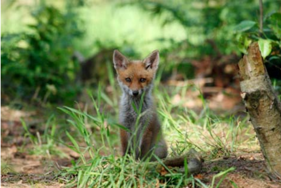
Dit vosje kwam uit een bijburcht van een das. Er waren 5 jonge vossen.

had een moervos de bijburcht van een das bezet en daarin vijf jongen gebaard. In die periode ontstonden op nabijgelegen plekken nieuwe dassenholen. Dat duidt op migratie.