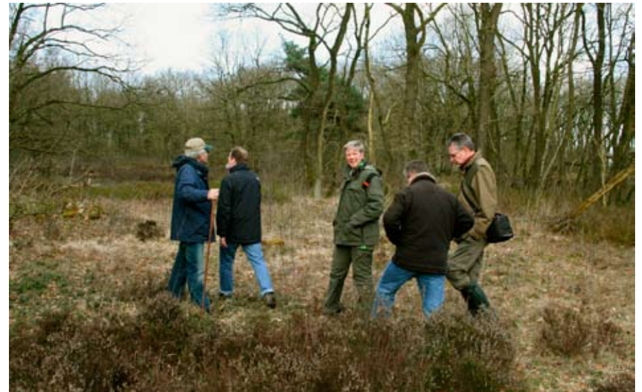
Dassenwerkgroep Zuid-Drenthe op bezoek bij SBB District Drents Loo en Aa.

gelokaliseerd en besloot tot de oprichting van Dassenwerkgroep Zuid-Drenthe . Eind 2008 bestond de werkgroep uit 9 personen en waren 30 burchten met GPS vastgelegd. Inmiddels was vergaderd met dassenkenners van Staatsbosbeheer, Stichting Het Drentse Landschap en Natuurmonumenten. De groep ging op bezoek bij SBB District Drents Loo en Aa om burchten te bekijken en ervaring op te doen. Ook werd contact gelegd met Provincie Drenthe, Rijks- en Provinciale Waterstaat, kantonniers, Natuurvereniging Zuidwolde e.o., Stichting Dassenwerkgroep Brabant, Stichting Das&Boom en VZZ. De werkgroep maakte bezwaar tegen planologische ingrepen die voor dassen schadelijk zijn en wees op de wettelijke bescherming.