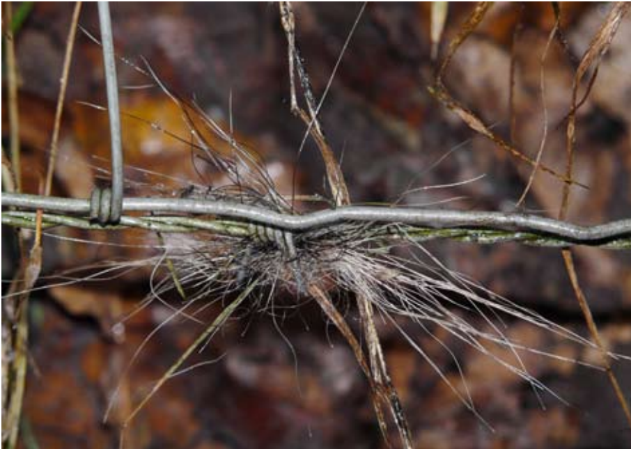
Een das heeft een doorgang gemaakt onder een schapenraster en verloor wat haar.

Een pluk zwart-wit haar aan het prikkeldraad onder een schapenraster, een extreem hoge hoop geel zand, een krab- en schuurboom in de buurt van een groot hol en brede sporen in vers uitgegraven zand.