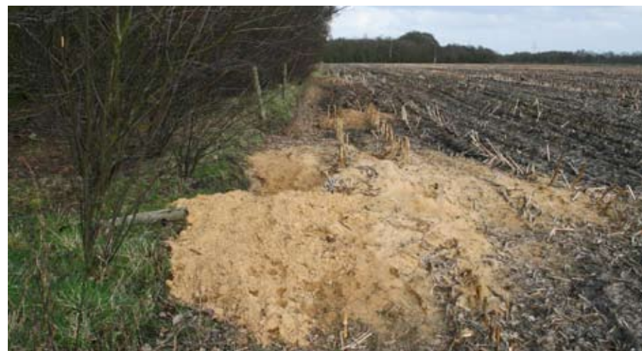
Zandkegels van dassen aan de rand van een maïsveld .

bos, in houtwallen en –singels en op akkers naar wormen en larven. Van schade is dán nauwelijks sprake, al ergeren sommige boeren en tuinders zich aan de zandhopen aan de rand van hun land. Dassen die in de buurt van een maïsveld wonen, duwen de stengels omver om bij de kolven te komen. Soms slepen ze kolven mee naar de burcht. Het Ministerie van Landbouw vergoedt aantoonbare schade.