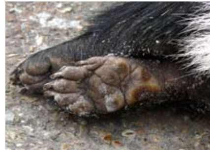
Achterpoot van een das.

Dassen lopen net als beren en mensen op hun hele voetzool. Het zijn zoolgangers. De poten zijn kort, maar bijzonder krachtig met lange nagels. Het hele dier is krachtig gebouwd. De kop is klein, lang en smal, maar de nek is kort en dik met sterke spieren. De das is gebouwd om te graven. Het is verbazend hoeveel zand een das kan verzetten. Er bevindt zich onder de grond dan ook een compleet stelsel van gangen, tientallen meters lang, en kamers.