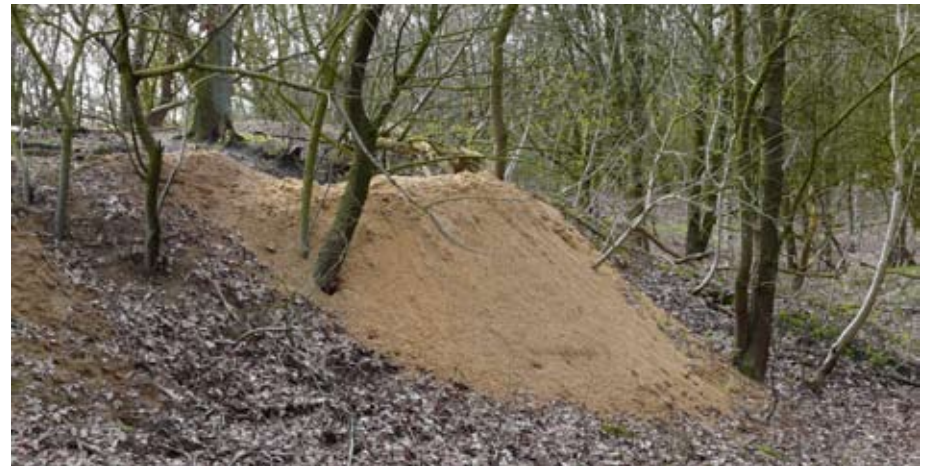
Kuub zand verzet door een das. Burchten kunnen tientallen jaren oud zijn. Enkele al bestaande burchten blijken 80 jaar te zijn bewoond.