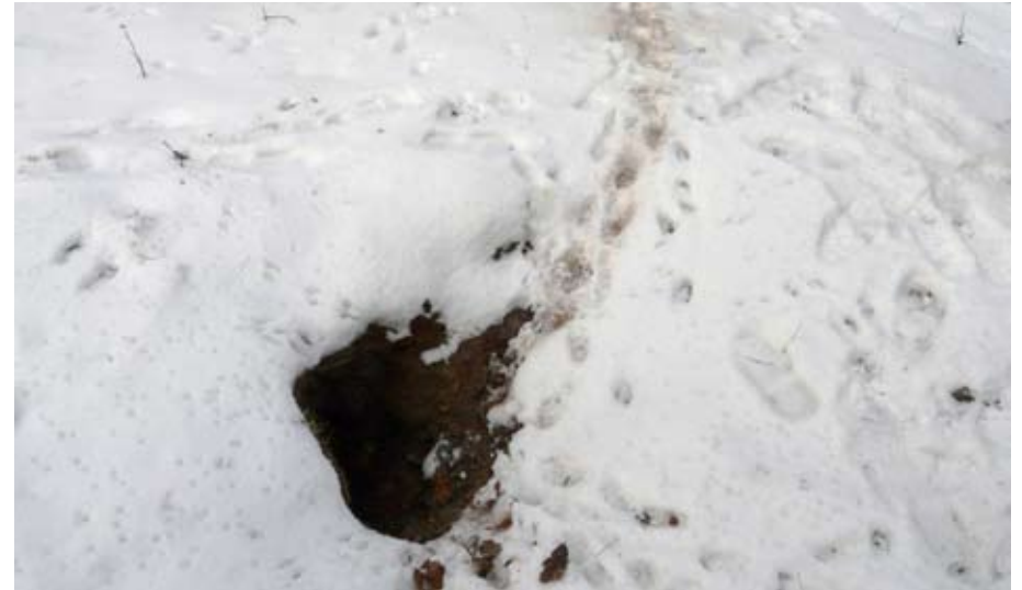
Winter 2009-2010: een das heeft 's nachts het hol verlaten. In de eerste sporen ligt zand van poten en vacht. Er zijn ook sporen van een ree en een mens.