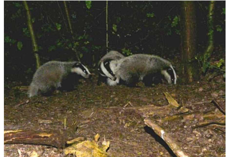
Spelende jonge dassen bij hun burcht.

Dassen zijn grote vriendelijke zoogdieren met een karakteristieke zwartwitte koptekening. Ze leven sociaal in groepen in burchten.