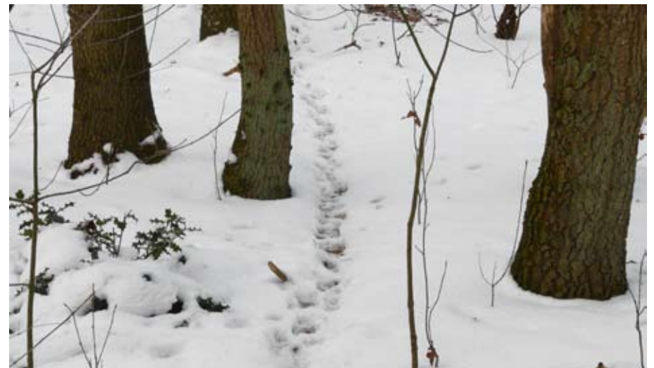
De das is op weg gegaan om voedsel te zoeken. In het bos waren plekken te zien waar de sneeuw was verwijderd om in de bladlaag larven te vinden.