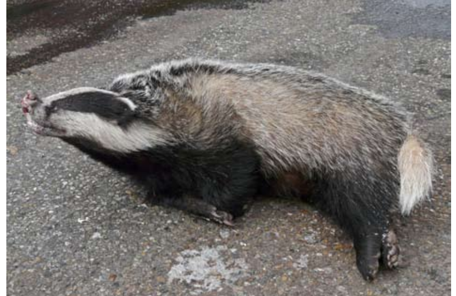
Verkeersslachtoffer in de Nijstad bij Hoogeveen.

heel veel tijd. De zit is lang en de kans is groot dat we geen dassen zien. De ervaring van de werkgroep is, dat er altijd iets is te zien en te horen: vogels, muizen, een eekhoorn, reeën of een vos.