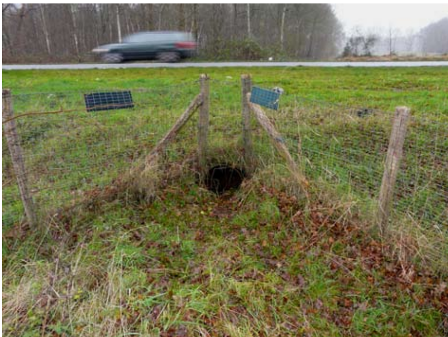
Dassentunnel onder de N48 bij Zuidwolde.

De mens vormt helaas in meerdere opzichten een bedreiging voor de das. De werkgroep constateerde dat dassenholen met drijfmest werden volgespoten, of de holen worden volgestopt met takken, plastic bussen of andere rommel. Meldingen van dergelijke verstoringen én van dode dassen kunnen telefonisch aan de leden van de werkgroep worden doorgegeven. De telefoonnummers staan onder de colofon.