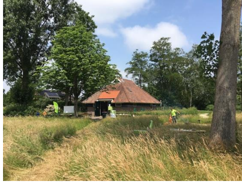
Vorbereidingen in volle gang

Op zondagmiddag in het Steenbergerpark. Naast een wandeling, de hond uitlaten, een disk werpen of gewoon een picknick kleed neerleggen en lekker relaxen, het kan allemaal. Maar op 10 juni was het naast al die activiteiten een drukte van belang bij het Struunhuus en rondom de grote vijver. Ruim 100 kinderen met even zoveel volwassenen kwamen naar het park om te genieten. Dat is ook de boodschap, ga lekker genieten.