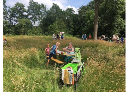
Hillie Waning-Vos met insecten