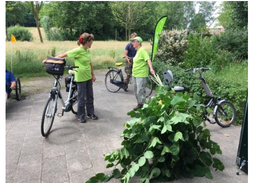
Rietjes snijden van de Japanse duizendknoop.