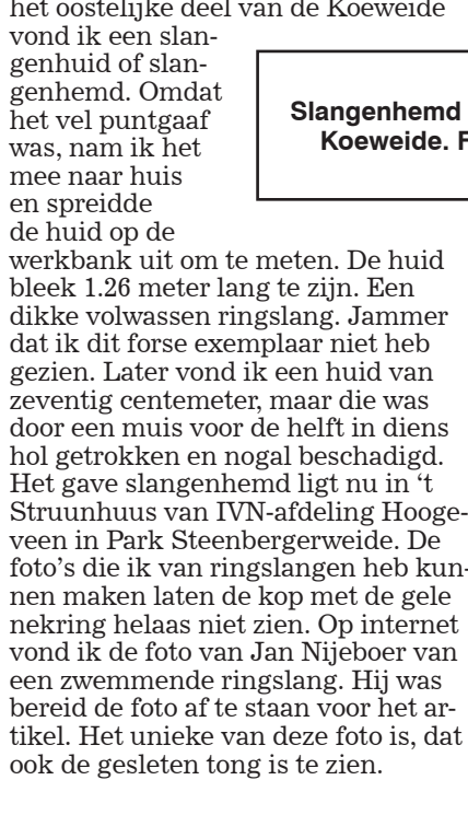
Slangenhuid van 1.26 meter in de Koeweide.

blijven. Op de oever van een pool oriënteert een ringslang zich met zijn tong. Hij jaagt volledig op geur en ruikt een kikker of pad eerder dan de prooi hem ziet. Wie wel eens een pad heeft gepakt, weet dat het dier uit de huidknobbels begint te 'zweten'. Het wittige vocht is een giftig afweermiddel. Een ringslang geeft niets om dit vocht en dat weet de pad. Zogauw een pad een ringslang ziet, verheft hij zich op zijn poten. Hij maakt zich groot. Om extra groot te lijken pompt hij zich vol met lucht. Zo'n groot beest kan een juveniele ringslang afschrikken, maar een volwassen slang van meer dan een meter valt aan. Hij pakt de opgeblazen pad bij