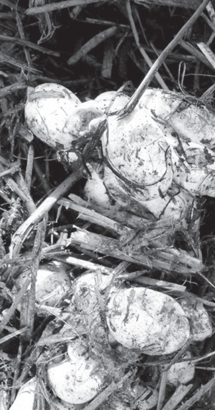
Eieren van een ringslang in de mesthoop van de Naaberhoeve.

oievaar, reiger, buizerd en loslopende honden (Oude Kene!). Bij bedreiging scheidt hij vanuit zijn anus een vloeistof uit dat afschuwelijk ruikt naar knoflook en rotting. Het is een aasgeur. Dat schrikt een belager die niet van aas houdt direct af. Vervolgens keert de slang zich op zijn rug, verslapt en houdt zich dood. Roerloos blijft hij met open bek liggen. Uit de bek komt een beetje bloed. Schijn dood, maar in feite is hij alert en komt onmiddellijk weer tot leven zodag de aanvaller maar even niet oplet. De slang verrijkt razendsnel in de dichte vegetatie of in het water.