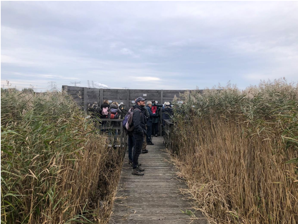
Vogelscherm bij het Brielse meer