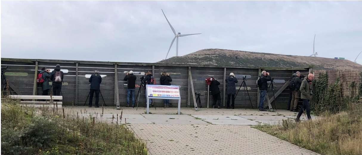
Vogelscherm bij de Vogelvallei

Met achttien vogelaars werden de plasjes afgezocht naar watervogels. Veel Wintertaling, de eerste Tafeleenden, een paar Slobeenden en wat Smienten.