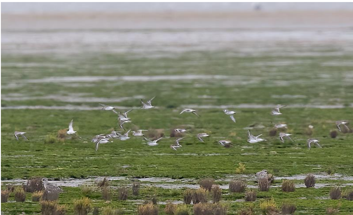
Zilverplevier en strandlopers.

Spectaculair is een Slechtvalk die op een stuk scheepstouw op het strand zit te rusten. Vanuit vogelhut de Bonte piet zien we een zandplaat met zo'n 60-70 Zeehonden.