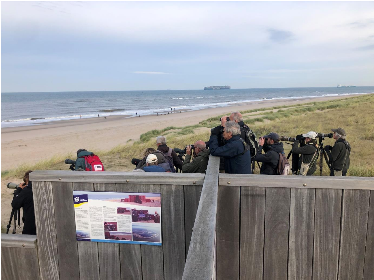
Trektelpost Maasvlakte

Nog spectaculairder was de zeevogeltrek langs de Noordzeekust. Voor de kust dobberden verschillende Zeekoeten. Ook een Roodkeelduiker wordt nabij de kustlijn ontdekt. Verschillende meeuwensoorten en sterns foerageren in het ondiepe water. Ook de Dwergmeeuw met zijn zwarte ondervleugels is duidelijk te herkennen.