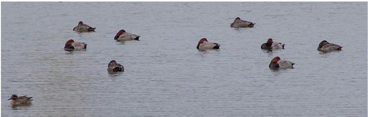
Wintertaling (links voor) en Tafeleenden

Vanaf dit punt bemerken we al veel vogeltrek. Vooral Vink, Keep en Sijs zijn volop onderweg naar zuidelijker oorden. Ook grote groepen spreeuwen komen overgevlogen.