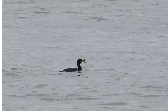
Ijsduiker en kuifaalscholver

Na Maasvlakte-II parkeren we bij Slag Baardmanneltje aan het Oostvoornse meer. Daar zingt de Cetti's zanger. Het voetpad langs de noordoever is door het natte weer onbegaanbaar. We volgen het zandstrand zuidwaarts langs de Westplaat. Halverwege vinden we een grote groep strandleeuweriken! Ze laten zich goed zien, foeragerend in de slikken. Een overvliegende havik verstoort grote groepen bonte strandlopers en zilverplevieren.