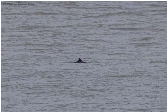
Bruinvis en eiders