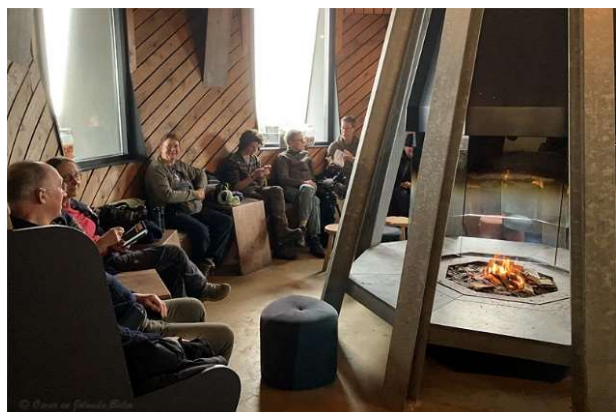
Even opwarmen