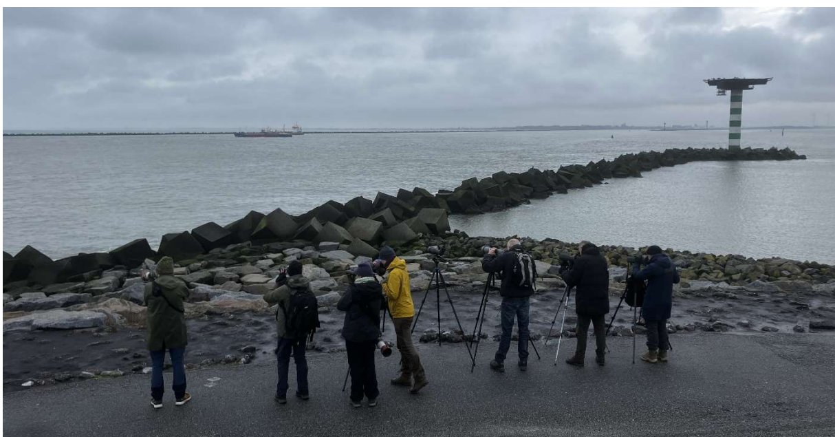
Vogels spotten in de Nieuwe waterweg