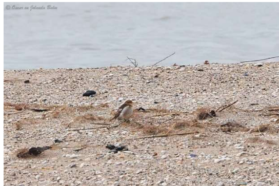
Strandleeuwerik en sneeuwgor