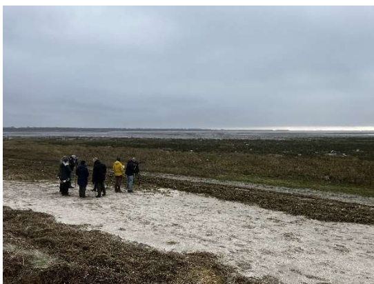
Turen over de Westplaat

Na de terugwandeling via de Vogelboulevard Oostvoorne kijken we terug op een zeer geslaagde vogeldag.