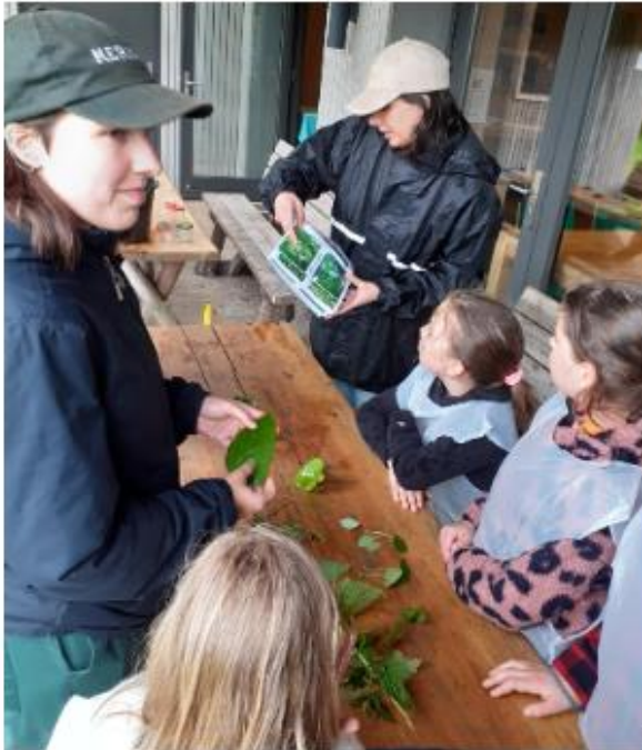
Buitenlesdag 10 juni

We vermelden hieronder enkele verslagen en terugblikken van activiteiten uit het vorige kwartaal.