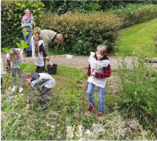
Foto: slootje scheppen tijdens de Buitenlesdag op 10 juni