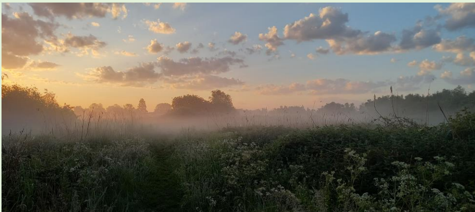
april 2024