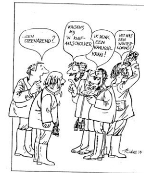
Illustratie Arie Stolk