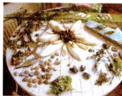
Strandvondsten van de zaterdag.

Dus sommige hebben de middag aangepakt om naar een doorgestoken stuk duin tussen Schoorl aan zee en Bergen aan zee te wandelen, anderen zijn gaan vogelen bij de Putten en weer anderen bleven lekker luiëren in/bij het huisje.