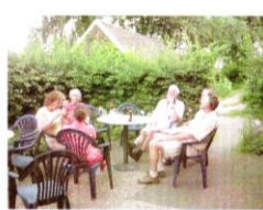
Gezellig op het terras van de kampeerberderij

Het is inmiddels zondag morgen héél vroeg als we bij de kampeerberderij terug zijn. Drankjes en versnaperingen komen op tafel, want na zo'n mooie tocht ga je toch niet meteen naar bed... De zondag ochtend start met een heerlijk ontbijt dat Hank klaar gezet heeft. In alle rust ontbijten we en ruimen alles op. Om 9.00 uur staan we klaar om in de auto 's richting Winterwijk te rijden. Daar gaan we een wandeling maken door de Bekkendelle, een bosgebied waar 'n beek doorheen meanderend. Vrijdagavond kregen we met de dia presentatie al een voorproefje, nu konden we alles zelf aanschouwen. Als 1 e lopen we naar een watermolen, waar ieder jaar een gele kwikstaart broedt. Helaas, we krijgen hem niet te zien. Op IVN tempo-even hier kijken, oh heb je dat gezien? - lopen we het bos in.