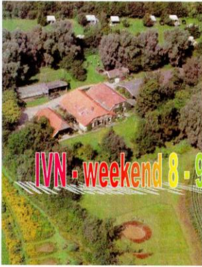
Kampeerberderij de Küper.