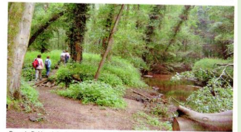
Door de Bekkendelle, het beekdal van de Slingse, foto Anita Silva.

11 IVN Vereniging voor Natuur en milieueducatie afdeling Twiske