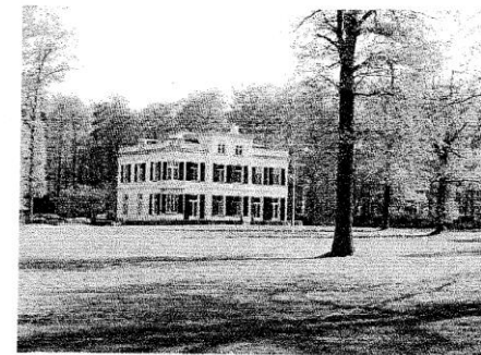
Huize De Boom aan de Arnhemseweg in Leusden.

Het totale landgoed omvat 972 ha., waarvan ca. 230 ha. bos en ca. 680 ha. landbouwgebied. Het gebied strekt zich uit over Leusden, Woudenberg en Barneveld. Tevens liggen er nog enkele gebieden in Bunschoten, Soest, Blokker en Rhenen. Ca. 41 ha. wordt door particulieren bevoond.