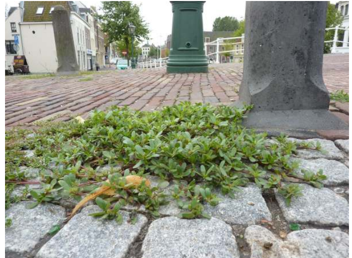
Stadsplant: Postelein

Zie 21 mei. Verzamelen bij de brug naar het park bij de Constan-tijn Huygenslaan.