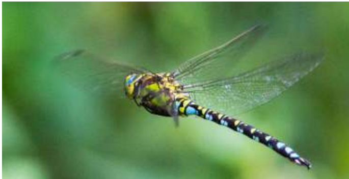
Blauwe glazenmaker, Aeshna cyanea