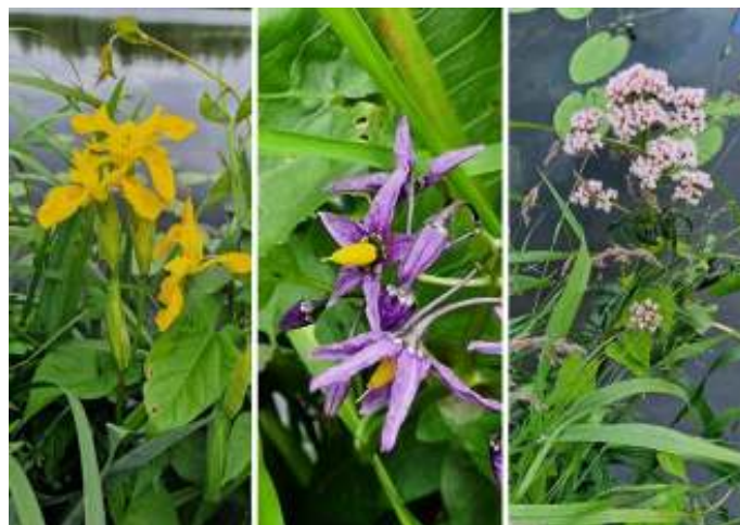
Gele lis, Bitterzoet en Echte valeriaan zijn 3 van de 23 soorten waarvan je de aanwezigheid checkt tijdens een oevercheck

Ontdek Natuur met Citizen Science is de Citizen-Science-Werkgroep van IVN/KNNV/Naturalis voor de Leidse regio. De naam van de werkgroep, voorheen Ontdek Natuur in jouw Buurt , is veranderd om de doelen duidelijker te maken: deelname aan Citizen Science stimuleren en ondersteunen.