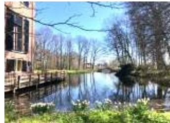
Huys te Warmont

"Ik heb veel geleerd als mens door met de natuur thuis op te groeien: met name het respect voor de natuur. We zijn voorzichtig met vlees, bestellen het liefst bij grutto.com, waardoor je zeker weet dat de dieren het goed hebben gehad bij de boer, en dat het vlees direct van die boer komt. Geen vreemde handel,