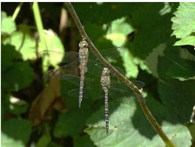
Paardenbijters ( Aeshna mixta )