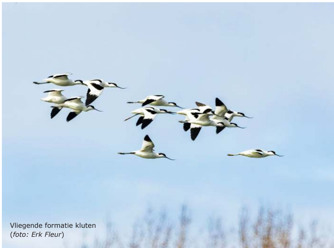
Vliegende formatie kluten