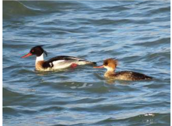
Middelste zaagbek (paar)