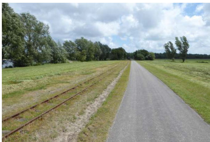
bij Valkenburgse Meer

Verzamelen op de parkeerplaats bij de ingang aan de J. Pellengweg te Valkenburg, nabij de Leidse Stevenshof.