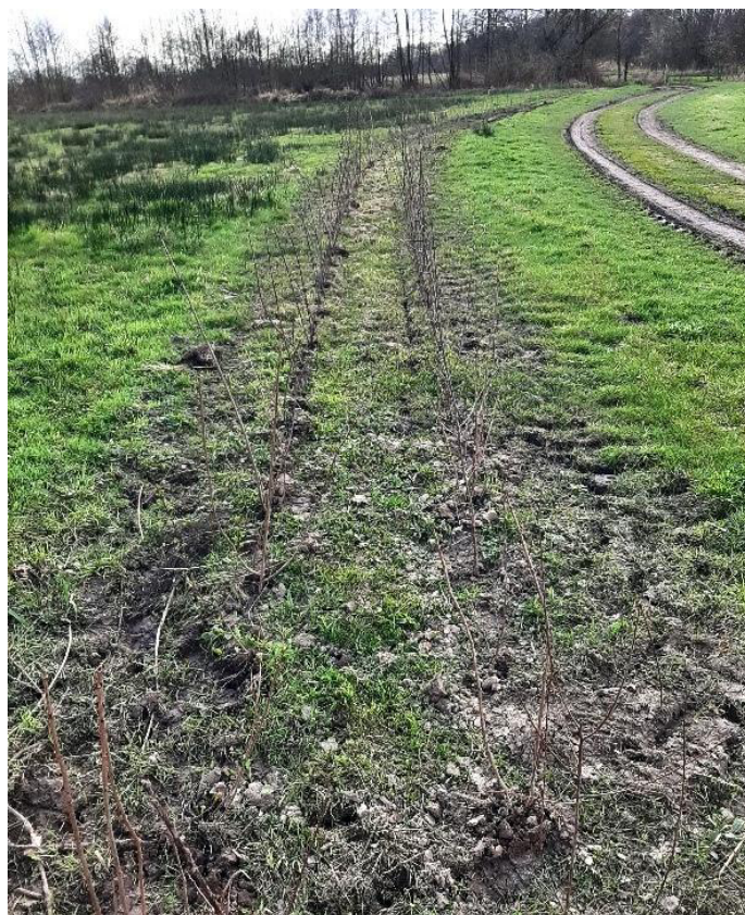
Twee rijen nieuwe struiken

Op een rij bomen in Thorn vond ik een plakkaat insecten, vergelijkbaar met de eikenprocessierups, allemaal vliegachtig en over elkaar kruipend, een heel bijzonder gezicht. Met de app ObsIdentify lukt het een naam te vinden: lindenspitskop ( Oxycarenus laticornis ), uit de familie van de Lygaeidae (bodempwantsen).