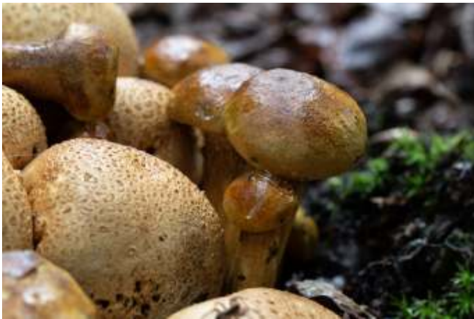
De kostgangersboleet parasiteert op de aardappelbovist.

De werkgroep paddenstoelen van de KNNV bestaat nu een aantal jaren. Op dit moment bestaat de werkgroep uit dertien leden. Een aantal is actief bij het determineren en onderzoeken; anderen genieten van de mooie foto's die langskomen.