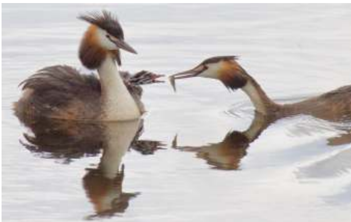
Fuut: "De mensen noemden mij vroeger Aarsvoet"

Daar komt Fuut aanzwemmen, met zijn drie kinderen op zijn rug, lekker warm tussen vaders veren. Moeder Fuut zwemt er achter aan. Op dit moment is het haar taak om visjes voor de kleintjes te vangen. Ze heeft er net weer eentje te pakken. Ze draait hem in haar snavel om zodat de kop van het visje vooruit steekt