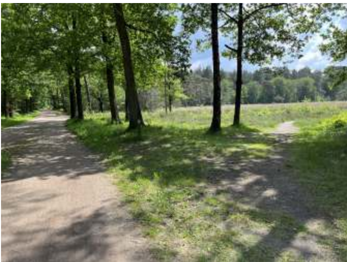
Langs oude paden ...

Voordat Amersfoort tot bloei kwam, was Oud Leusden het handels- en religieuze centrum van deze streek. De kerktoeren getuigt nog van dat rijke verleden. Oud-Leusden lag op een kruispunt van wegen. Enkele van deze oude verbindingroutes zijn nog steeds in gebruik. Vooral in de vorige eeuw zijn er nieuwe wegen bijgekomen, waardoor het gebied versnipperd is geraakt. Tunnels en viaducten zorgen nu voor verbinding van de oude structuren. Voor dieren zijn faunapassages aangelegd.