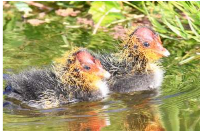
Meerkoet: "Toevallig zijn dit de mooiste kinderen die er zijn, hoor"

"Ik vind die kinderen van jou niet zo mooi", zegt Fuut tegen Meerkoet, "met die rode koppies en die haren boven op hun kop. Het lijken wel punkers." "Pardon?", doet Meerkoet, "toevallig zijn dit de mooiste kinderen die er zijn hoor." "Nou", zegt Fuut, "ik vind die van mij veel mooier. Kijk eens wat een lieve witte kopjes ze hebben, met van die mooie zwarte streepjes. En later krijgen ze net zulke mooie, roodbruine bakkebaarden als ik."