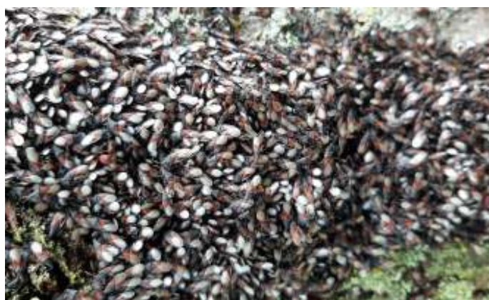
De lindenspitskop wordt ook wel malvawants genoemd

De lindenspitskop is een wants met een grootte van 4,8-6 millimeter. De wants heeft zwarte antennen en poten. Ook de kop, het halsschild en het schildje zijn zwart. De voorvleugels zijn rood, langs het schildje donker, met vaak een donkere vlek op het achterste deel van het membraan. Het membraan is glanzend en zilverachtig wit. De nimfen (de jonge wantsen) hebben een roodbruin achterlijf, en zijn ongeveuld. De lindenspitskop wordt gemakkelijk verward met de vuurwants ( Pyrrhocoris apterus ), omdat ze beide veel op lindebomen samenkomen.