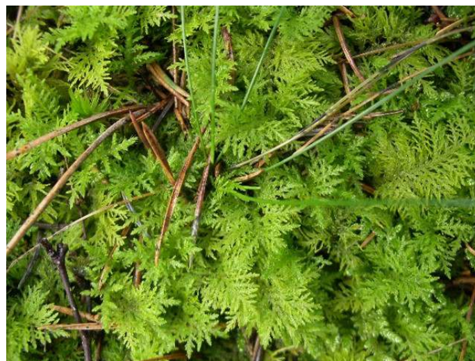
Gewoon thujamos, foto: Arie van den Bremer.

Spectaculair is altijd het gewoon thujamos. In totaal hebben we 28 soorten mos gevonden.