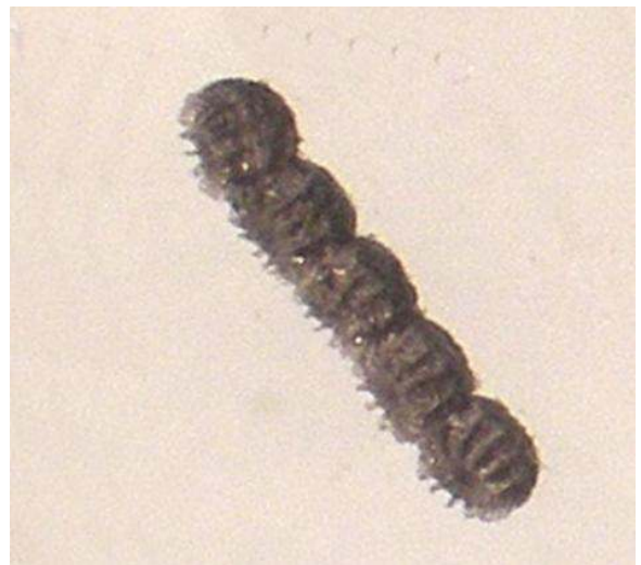
Soms zitten de luizen in een rijtje...

zag konden lopen. En als dat zo is, dan is het een doppluis. Extra bewijs dat ik bij de boswilg doppluis heb gezien en nu ook weet wat een schildluis is.