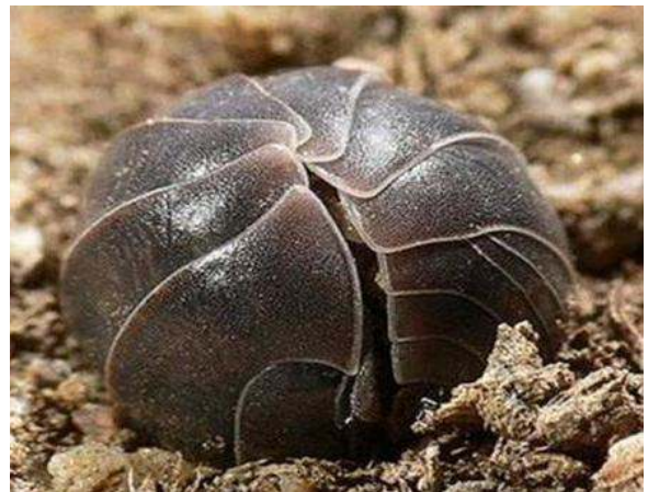
De rolpissebed in opgerolde vorm. Wereldwijd komen er zo'n 900 soorten pissebedden voor.

De soorten pissebedden kunnen naar hun gedrag en hun vorm in meerdere groepen ingedeeld worden. Er zijn soorten met een brede en platte vorm die zich overal aan vastgrijpen. Daarnaast zijn er soorten die zich bij aanraking oprollen tot een balletje. Ook zijn er soorten met een slanke vorm en lange poten die bij verstoring snel weglopen en ten slotte zijn er soorten die langzaam wegkruipen. Onderstaande soorten zijn de wat bekendere pissebedden in Nederland en België.