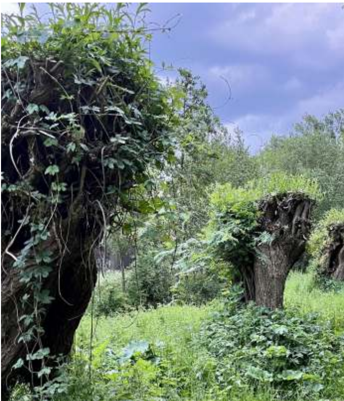
Knotwilgen: stille getuigen van het agrarisch verleden ...

Zo keren we terug in de bewoonde wereld. In het riet van de vijver bij de stoplichten maken spreuwen zich klaar voor de nacht. Tijdens onze wandeling zijn we één andere wandelaar tegengekomen. Een man met een jonge hond aan de lijn. Wat een mooi gebied zo dichtbij huis.