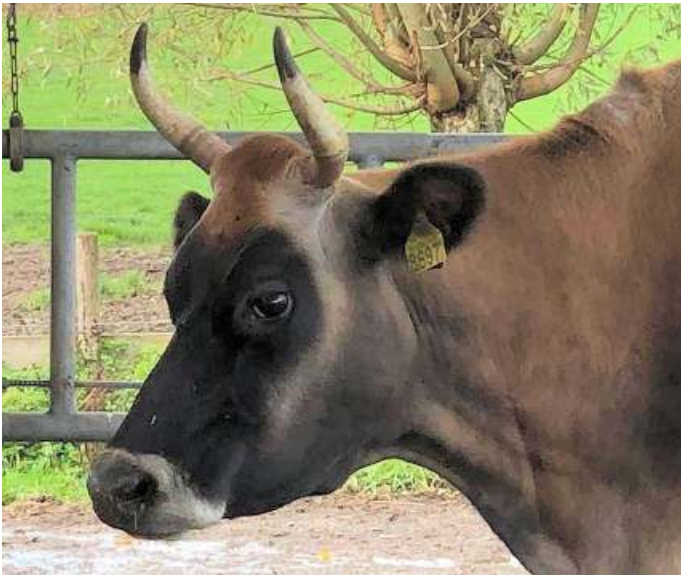
Kop van een Jersey koe

De grote boosdoener bij drijfmest is de urine. Urine bestaat voor ongeveer de helft uit de stof ureum, een afbraakproduct van eiwitten. Bij doorwerking van bacteriën, onder andere van mest, ontstaat hieruit ammoniak en niet zo'n klein beetje ook. Denk maar aan de tranen verwekkende stank van openbare urinoirs in de stad of de tijd toen de boeren de gier over het land sproeiden. Als de urine gescheiden kan worden opgevangen, zou dat al heel veel schelen. In drijfmest is de verhouding anorganische en organische stikstof ongeveer gelijk (2). Hoofdzakelijk het organische deel van deze mest, de helft dus, zal daadwerkelijk door de planten worden opgenomen en de rest, de andere helft, vliegt de lucht in. Daarnaast verstoort de ammoniak in de drijfmest de schimmelgroei (mycorrhiza) in de bodem.