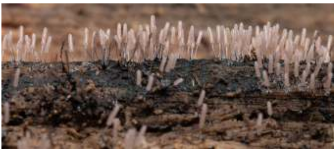
Het zilveren schijnpluimpje is een slijmzwam, met vruchtlichamen die aanvankelijk melkweit zijn.

De voornaamste activiteit is de deelname aan de natuurinventarisaties van de KNNV, die elk jaar in een ander gebied plaatsvinden. Daarnaast hebben enkele leden een bijdrage geleverd aan de minicursus Paddenstoelen en aan de IVN gidsenopleidingen in Amersfoort en in het Gooi. Sinds een aantal jaren wordt er dieper ingegaan op de wereld van de Myxomyceten ofwel slijmzwammen.