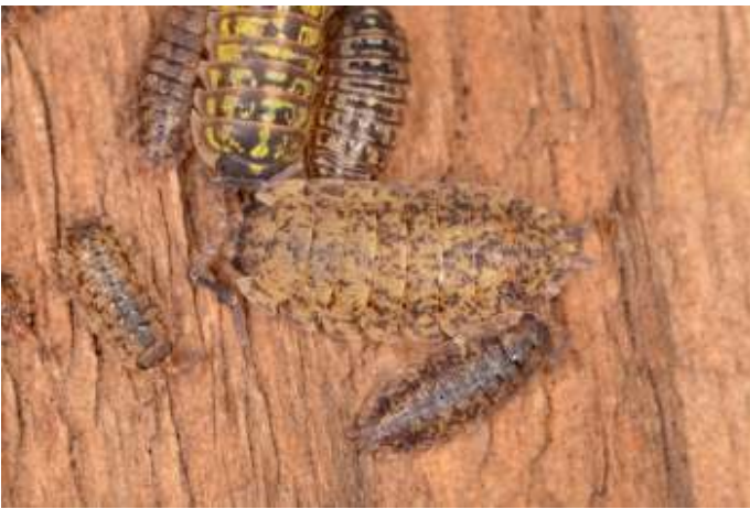
Volwassen en kleine pissebedden.

Een pissebed kan, als hij is uitgedroogd, water 'drinken' door de uropoden, de twee staartachtige aanhangsels aan de achterzijde van het lichaam, in het water te laten zakken. De uropoden bestaan uit een buitenste deel en een binnenste, dit laatste deel lijkt op een buisje waar door de capillaire werking water wordt opgezogen. Een teveel aan water kan worden afgegeven door de uropoden op een droge bodem te drukken.