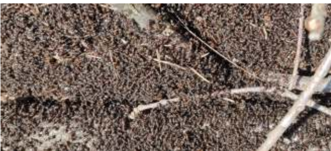
Zonnende rode bosmieren, foto: Gerda Schregardus

Patronen van de dennenscheerder, letterzetter, prachtkever, de poppenwiegjes van de boktorlarven, drinkgaatjes van spechten in de berk, ventilatiegaatjes van de berkenspintkever in de berk, reeënkeutels, cocon wespenspin en urnwesp, dassenlatrine, dassenprent, reeënprent, aangevreten dennenappels door specht/eekhoorn/muis, braakbal uil, sigaarzakkendragers, spechtenholen, konijnenhol, ingestort bosmierennest met een beginnend nieuw bosmierennest en hard werkende mieren, bosmierennest met vraatsporen van een groene specht, zonnende bosmieren, muizenholletjes, vossendrol op molsloop, molshopen, gaten van houtwespen, knikkergal met gaatjes sluipwesp, oude reeënslaapplek, konijnschraapjes, wissel (das?), drolletjes regenwormen, verschillende struikjes met vraatsporen van ree, en afgevreten heidestruikjes door konijnen.