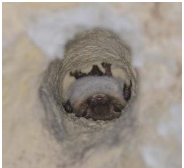
Winterslapende franjestaart die op zijn rug ligt. De foto is genomen in een booggat in de mergelgroeve rond Valkenburg.

In deze aflevering gaan we het hebben over een bos vleermuis. Nee, niet de 'bosvleermuis', dat is namelijk ook een soort. Ik bedoel bos vleermuis, met een spatie ertussen. Van de Nederlandse vleermuissoorten is ongeveer de helft het grootste deel van het jaar voornamelijk afhankelijk van gebouwen, terwijl de andere helft verblijft in bomen. In Nederland kennen we de franjestaart ( Myotis nattereri ) vooral als een boombewoner, als bos vleermuis dus. Ook in Amersfoort en omstreken kennen we deze soort.