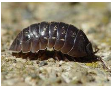
Het lichaam van een pissebed is ovaal en afgeplat.

Twee keer zeven, totaal veertien poten, dus een insect kan het niet zijn. Pissebedden behoren tot de substam van de Crustaceae, de schaaldieren. Net als bijvoorbeeld de krab en de kreeft. In tegenstelling tot die grotere – en smakelijkere – stamgenoten, is de pissebed wel tot landdier door geëvolueerd. Tenminste, dat geldt voor de meeste pissebedden. Van de 37 soorten die er in Nederland leven, behoort het merendeel tot de landpissebedden. Daarnaast bestaan er ook enkele soorten zoetwaterpissebedden. De landpissebedden hebben dus de zee verlaten, maar hebben hun kieuwen behouden; deze zijn aanwezig in de vorm van aangepaste 'poten' van het achterlijf waarmee de dieren in staat zijn zuurstof op te nemen uit hun omgeving. De kieuwen moeten altijd vochtig blijven, omdat ze anders niet meer functioneren. Dit is de reden dat de pissebedden in een droge omgeving niet lang zullen overleven.