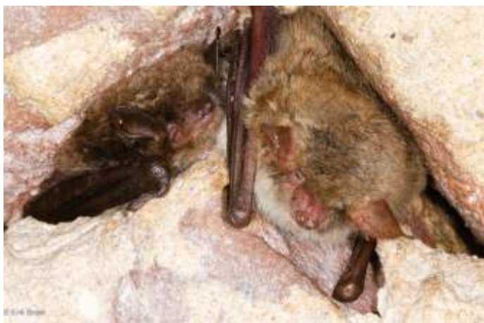
Twee vleermuizen in winterslaap: rechts franjestartaart en links watervleermuis.

Alle Nederlandse vleermuissoorten hebben insecten op het menu staan. Grote vleermuizen vangen grote prooien, logischerwijs vangen kleine vleermuizen enkel het formaat mugje uit de lucht. De franjestartaart