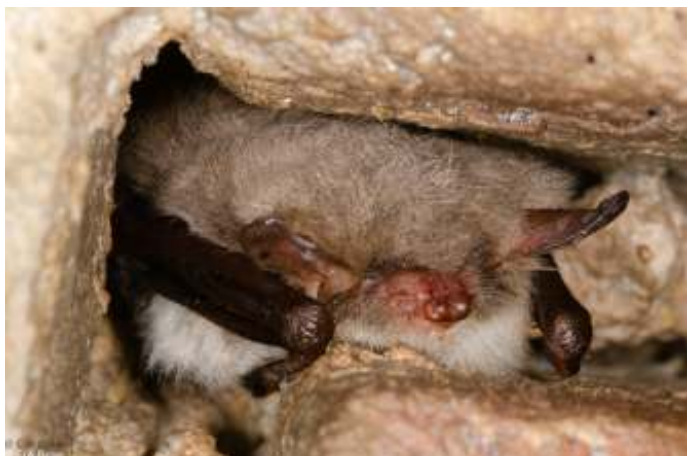
Een pasgeboren franjestartaart. De ogen zijn nog gesloten, zelfs de navelstreng is zichtbaar.

bijzondere manier. De paring vindt plaats in het najaar. De vrouwtjes bewaren het sperma in hun lichaam om pas in het voorjaar het eitje te bevruchten. De vrouwtjes zoeken elkaar dan in groten getale op en vormen kraamkolonies.