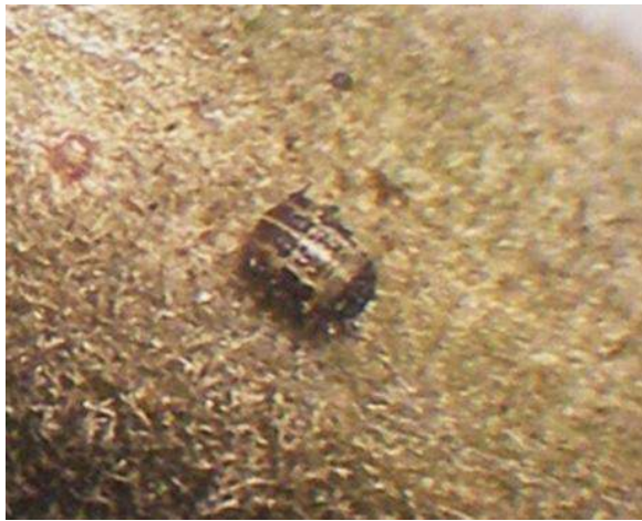
Een bladluis op de boswilg is circa twee millimeter groot

Ik heb de foto's naar Naturalis gestuurd, maar ik kreeg geen reactie. Ik was recent in Natuurmuseum Brabant in Tilburg en kwam een KNNV-er van Tilburg tegen die al dertig jaar onderzoek doet in natuurgebied Kaaistoep in de gemeente Tilburg. Hij vult ook het museum met veel collega's. Ik heb bijgevoegde foto naar hem gestuurd en hij vertelde dat het een doppluis is. Ik heb op internet gekeken en het klopt bijna zeker. Die dopluizen overwinteren dus ook achter katjes van boswilg, waar het lekker warm is. Leuke vaststelling.