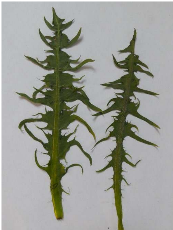
Gerafelde bladeren van een vreemde paardenbloem

neren van de Nederlandse paardenbloemsoorten. Karst Meijer”