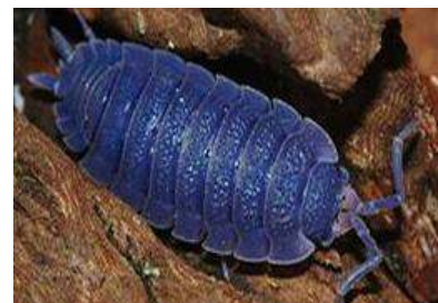
Een met het iridovirus besmette pissebed kleurt blauw.

Bij pissebedden komen opvallend weinig parasieten voor. Op vochtige plekken, indien er veel pissebedden bij elkaar zitten, kan een virusinfectie de kop op steken. Besmetting met dit virus, het 'iridovirus', is eenvoudig vast te stellen: het kleurt de dieren lichtblauw tot violet (Wijnhoven & Berg 1999). Blauwgekleurde dieren sterven na enige weken. Pathogene schimmels en bacteriën worden nauwelijks gemeld van pissebedden.