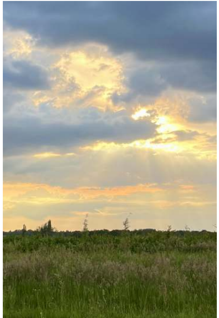
Een avondlucht met woeste wolken ...

We zijn inmiddels bij een bankje aangekomen, waar Christel een kopje thee schenkt. We kijken uit over de velden richting Soest en zien een avondlucht met woeste wolken, waar in de verte regen uit valt. Even is er weerlichten te zien, maar het is ver weg. Een trein kruipt als een rups door het landschap. We kijken uit op de nieuwe aanplant van het natuurproject. Er is een rij sleedoorns geplant, met de hand, om verstoring van het bodemprofiel te voorkomen. Er zijn namelijk archeologische resten gevonden onder de voormalige weilanden. Christel hoopt op eitjes van de sleedoornpage. Ooit heeft ze op de Melksteeg, in een jonge struik, het eerste eitje gevonden.