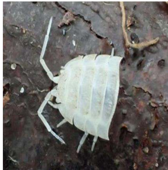
Vervelhuidjes van pissebedden zijn altijd door de helft (Bron: Mike Hirschler, IVN).

Anatomie van de kelderpissebed. Dit exemplaar betreft een vrouwtje, wat te zien is aan de holte aan de buikzijde tussen de poten; hierin wordt wekenlang de broedzak met de eitjes en nimfen meegedragen. Bron: Wikipedia.