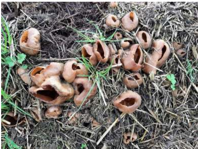
Vroege bekerzwam ( Peziza vesiculosa )

Voor de KNNV is 2024 vooral het jaar van Bloeidaal, omdat we hier inventariseren. Daar wandelend kom je vaak bijzondere dingen tegen. Het Utrechts Landschap heeft in de herfst het maaisel op zwelen (dijkjes) gelegd. Dat is een experiment met het doel daar compost van te maken. Dat is een arbeidsintensief proces. Utrechts Landschap heeft er een speciale machine voor gekocht, die om de paar weken de zweel omzet. Men verwacht dat dit goedkoper is dan afvoeren naar een compostbedrijf. Het voelt nu ook als compost aan. Maar nu komt het: de compost zit vol met vroege bekerzwammen, soms met een diameter van wel tien centimeter. De determinatie is door Leendert Smit.