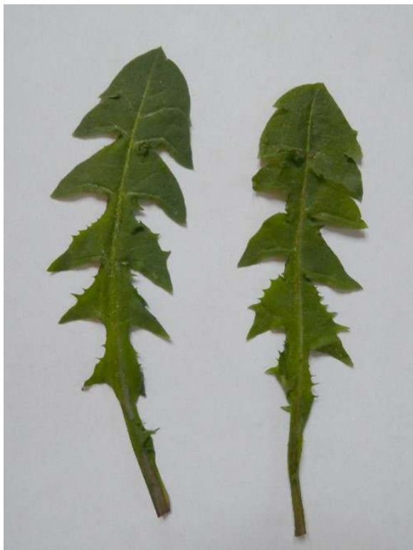
Bladeren van een gewone paardenbloem