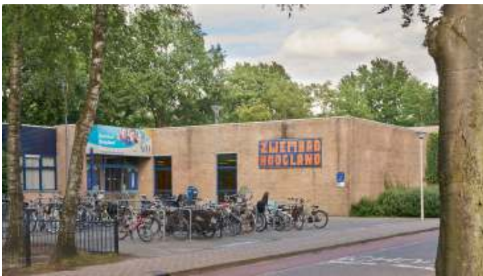
Het huidige Zwembad Hoogland

Met de komst van een zwembad en andere genoemde activiteiten zal de parkeerdruk in het park toenemen. Ook voor parkeren zal ruimte gereserveerd moeten worden die er nu niet is. En toename van verkeer in het park zal leiden tot meer verstoring. Het uiteindelijke resultaat zal zijn een sterk uitgeholde groenvoorziening door verdergaande verstening en een aanzienlijke verslechtering van de ecologische verbinding met het buitengebied. Beide staan haaks op de oorspronkelijke visie die achter de aanleg van Park Schothorst zit.