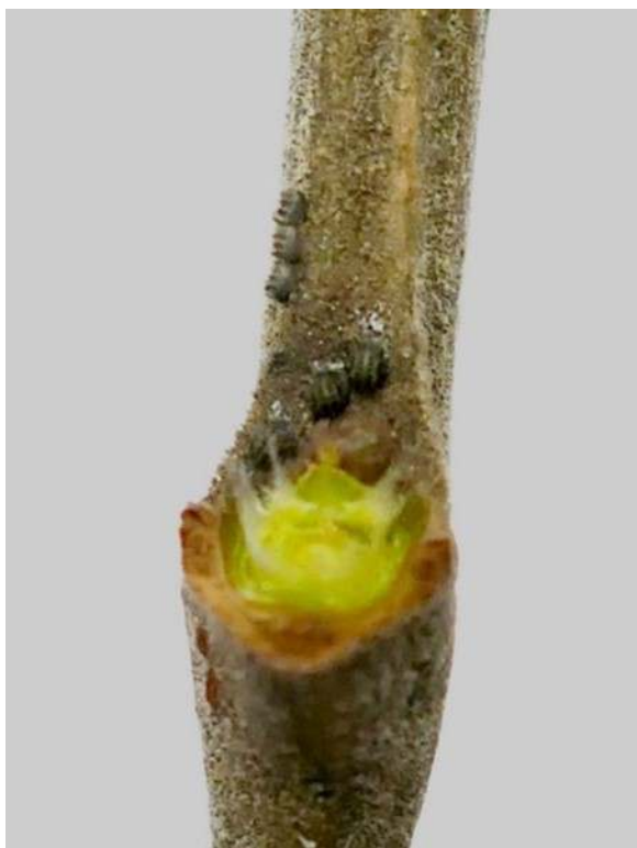
Waar vorig jaar een blad zat, blijft in de winter een wondje achter

Op internet worden dopluizen vergeleken met schildluizen. Het verschil is dat schildluizen vastzitten op jonge twijgen. Ik had een perzikenboom waar ze ook op zaten en haalde ze met mijn vingers weg om spuiten te vermijden. Nu blijkt dat ik dan alleen het schild van ze weg haal, terwijl de beestjes die ik