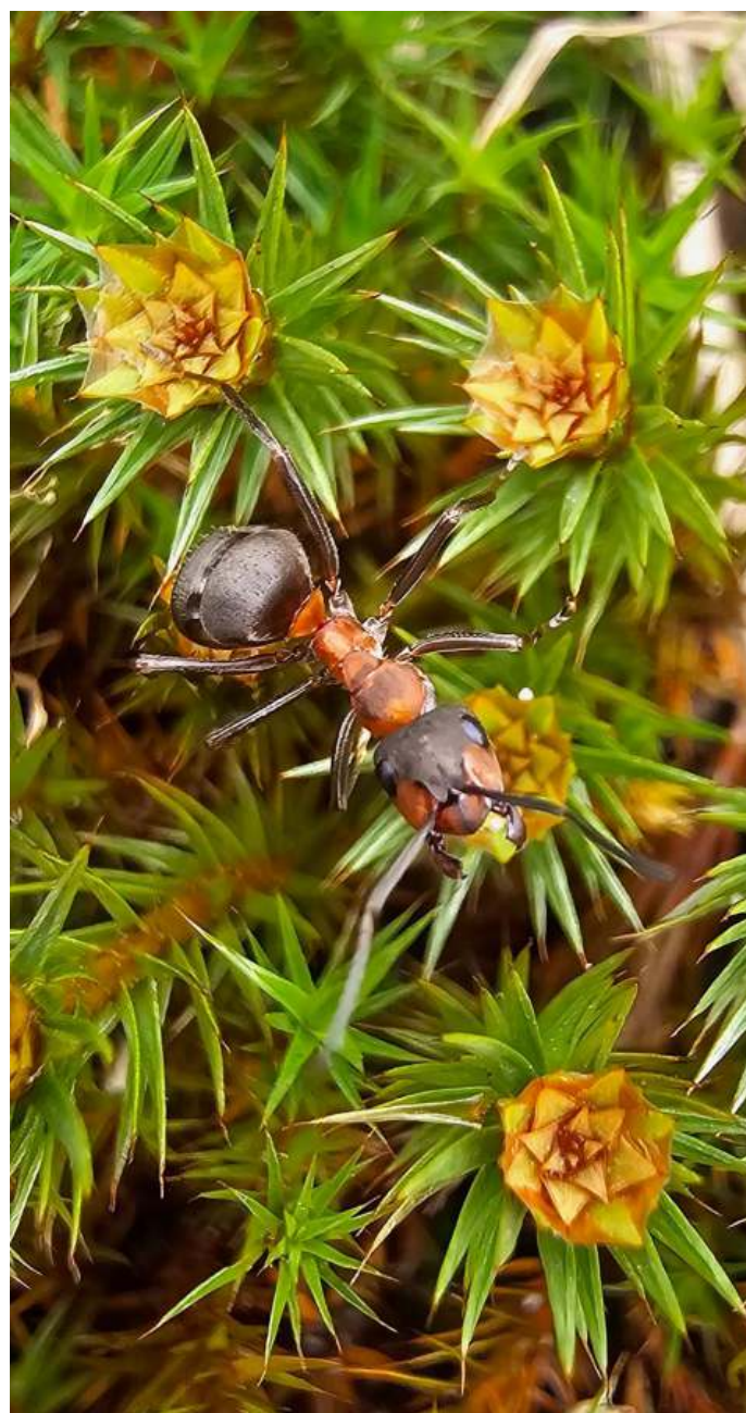
Rode bosmier, foto: Bas de Reus (Foto hoort bij het Verslag van de IVN-excursie Diersporen op pag.18)