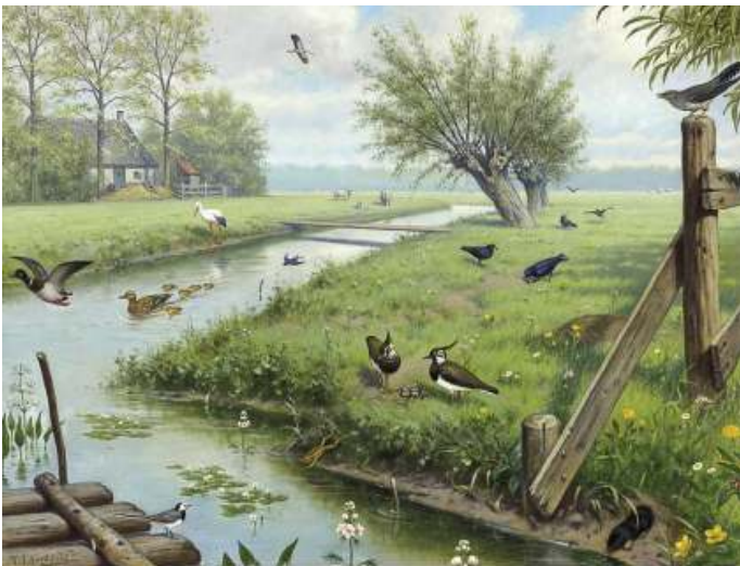
IN DE WEIDE

Als je door ons land rijdt, krijg je vaak, mits geen geluidswal het zicht belemmert, een wijds uitzicht over een weidelandschap. Groene velden zover het oog reikt. Wat misschien niet direct opvalt is dat ze tegenwoordig wel heel strak en egaal groen zijn. In tegenstelling tot de soort weide die in de jaren vlak na de oorlog ons land sierde en die prachtig is weergegeven op een schoolplaat van de illustrator Koe-koe. Je mist de paardenbloemen, de madeliefjes, de klaver en water al zo meer in een kruidenrijk grasland groeide. Hiervoor in de plaats staat er in de weide een egale monocultuur van Engels raaigras, door de natuurliefhebber wel schamper 'grasfalt' genoemd.