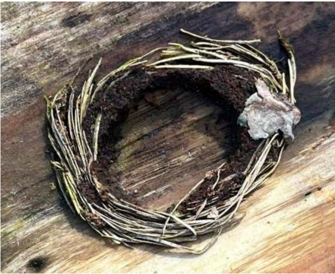
Boktorlarven maken een netje van houtvezels: een poppenwiegje, foto: Wil Schonewille

hagedis en een driehoornmestkever. "De driehoornmestkever is juist in de winter en vroege voorjaar te zien en is duidelijk herkenbaar aan de drie hoorns. Mestkevers maken een gaatje in de grond om te overwinteren en eitjes te leggen. De gaatjes met vulkaanzandhoopjes zijn vaak te zien bij konijnenkeutels of andere uitwerpselen. De keutels worden het holletje ingerold en is voedsel voor de larven".