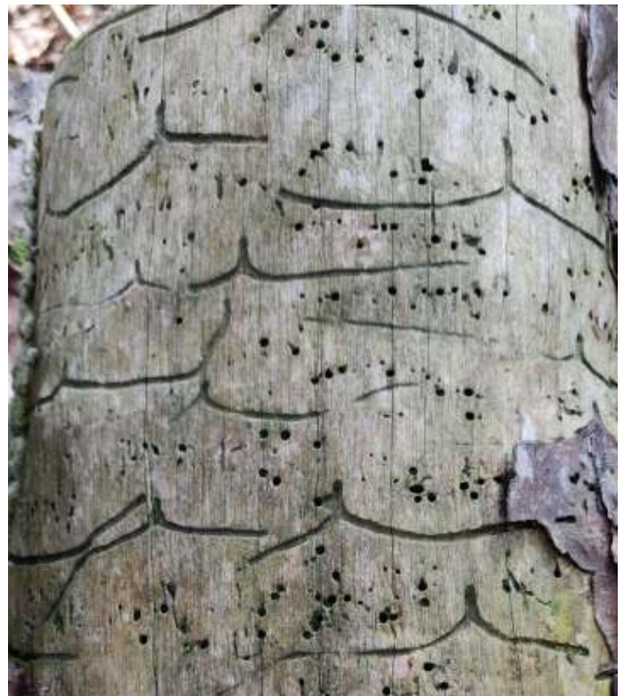
De vraatsporen van de dennenscheerder hebben een V-vorm, foto: Gerda Schregardus.

larven. De prachtkever laat een onduidelijk patroon achter op het hout. Prachtkevers paren buiten de boom en leggen eitjes in de bast. De larven vreten het hout op en er blijft een onduidelijk, maar wel herkenbaar patroon achter. De boktor legt eitjes in de boom en de larven maken een zelf een netjes van houtvezels. Dit nestje wordt het poppenwiegje genoemd.' Meer informatie is te vinden op de Diersporengids: www.diersporengids.nl/gaten-en-gangen-in-bomen/