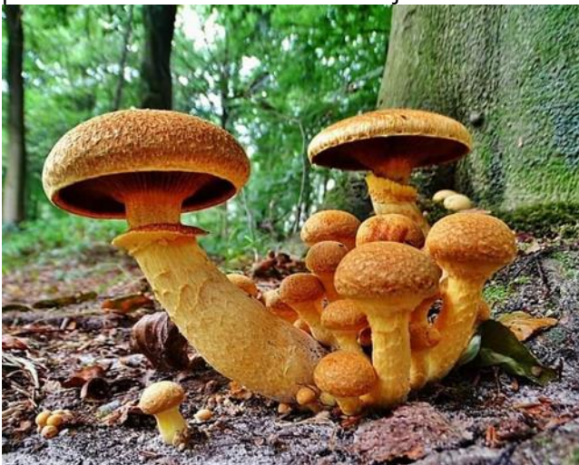
Prachtvlamhoed

Hoewel we paddenstoelen op de groenteafdeling in de supermarkt kunnen vinden is het geen plant. Maar ook geen dier. Een paddenstoel is het vruchtlichaam van een schimmel. Meestal leeft die schimmel onzichtbaar onder de grond of onder boomschors. Het netwerk aan schimmeldraden krijgt bovengrondse uitlopers n.l. paddenstoelen en die zien we. De paddenstoel is vergelijkbaar met de vrucht van een appelboom: de appel. Deze vruchten schieten bij vochtig weer in nazomer en herfst als paddenstoelen uit de grond. In het bos van Nimmerdor zullen we veel varianten paddenstoelen kunnen vinden, ook omdat er veel oud hout ligt. Gaat u mee? Neem dan een spiegeltje mee om de onderkant van de paddenstoel te kunnen bekijken.