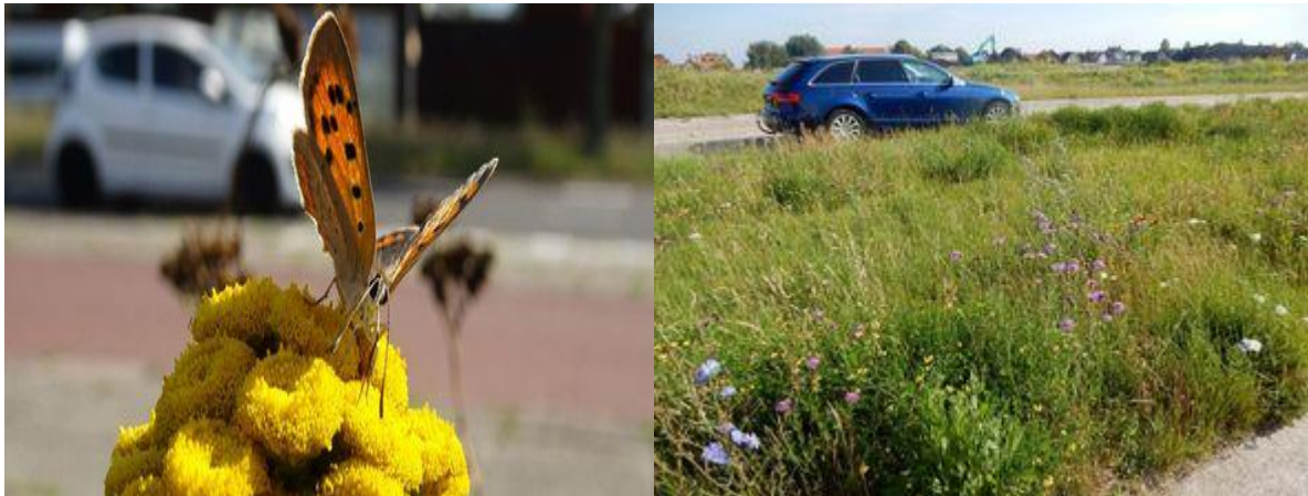
Kleine vuurvliinder in een wegberm

hun ervaringen met ecologisch bermbeheer en Kleurkeur in de praktijk. Aan het eind is er ruimte voor vragen.