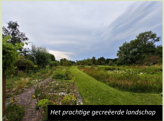
Het prachtige gecreëerde landschap