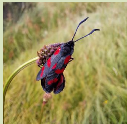
Sintjans vlinder