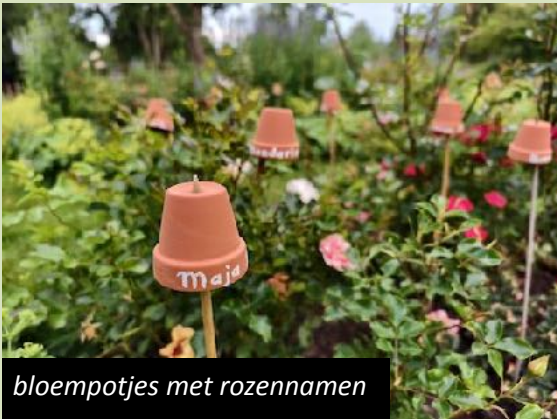
bloempotjes met rozennamen