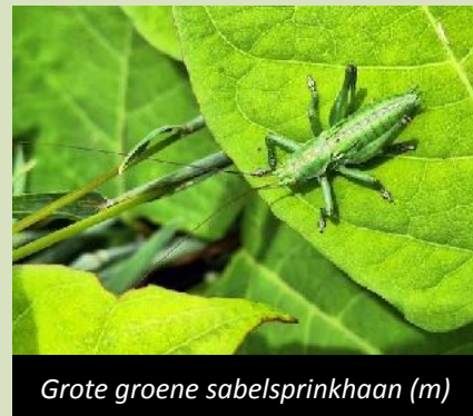
Grote groene sabelsprinkhaan (m)