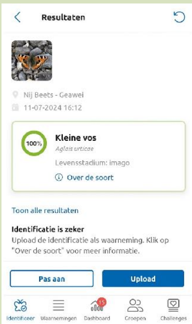
SCREENSHOT VAN DE APP. OBSIDENTIFY