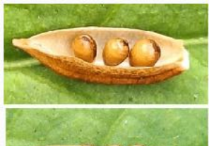
vruchtdoos Bleeksporig bosviooltje

heeft veel hazelnoten, van de lijsterbes zijn de bessen mooi oranje en bijna rijp. Vruchtdozen van bepaalde planten zijn bijzonder mooi als je ze bekijkt met een loepje of als je goed inzoomt met de telefoon camera. Gallen zijn weer aanwezig op vooral de eiken maar ook andere planten dragen mooie gallen. Langs de vijver randen zijn nog vele soorten libellen en waterjuffers te zien.