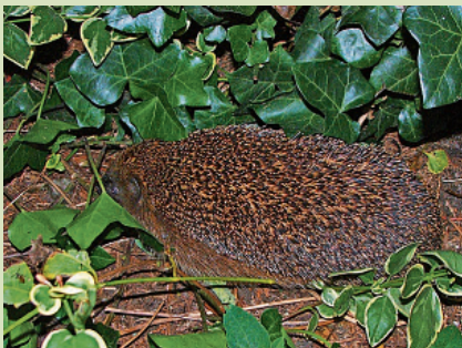
Forse egel in de tuin.

Overbuurvrouw Bep heeft een egelverblijf in de achtertuin. Daarin slaapt overdag een egel. Er heeft zich nog geen partner gemeld. Afwachten. Het egelverblijf is te bezoeken op Otto Zomerweg 65 in Holland-scheveld.