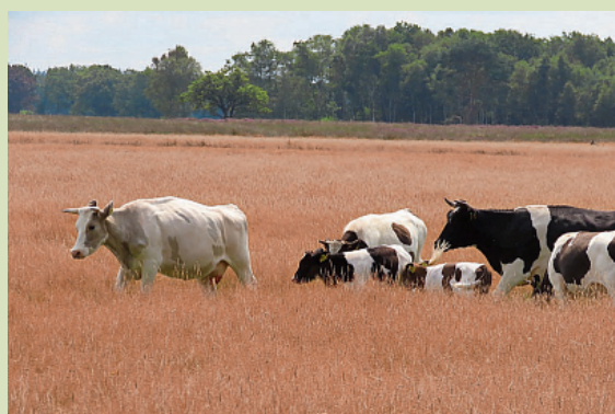
Heidekoeien in het Mantingerveld.

ke Overleggroep Heiderunderen om kennis en kunde te delen. De inbreng van de Drentse delegatie met heidekoeien is van groot belang