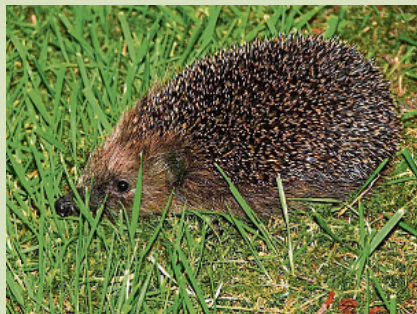
Egel op Terschelling.