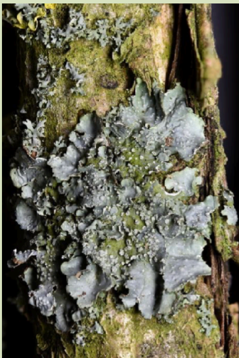
Gestippeld schildmos Punctella subrudecta