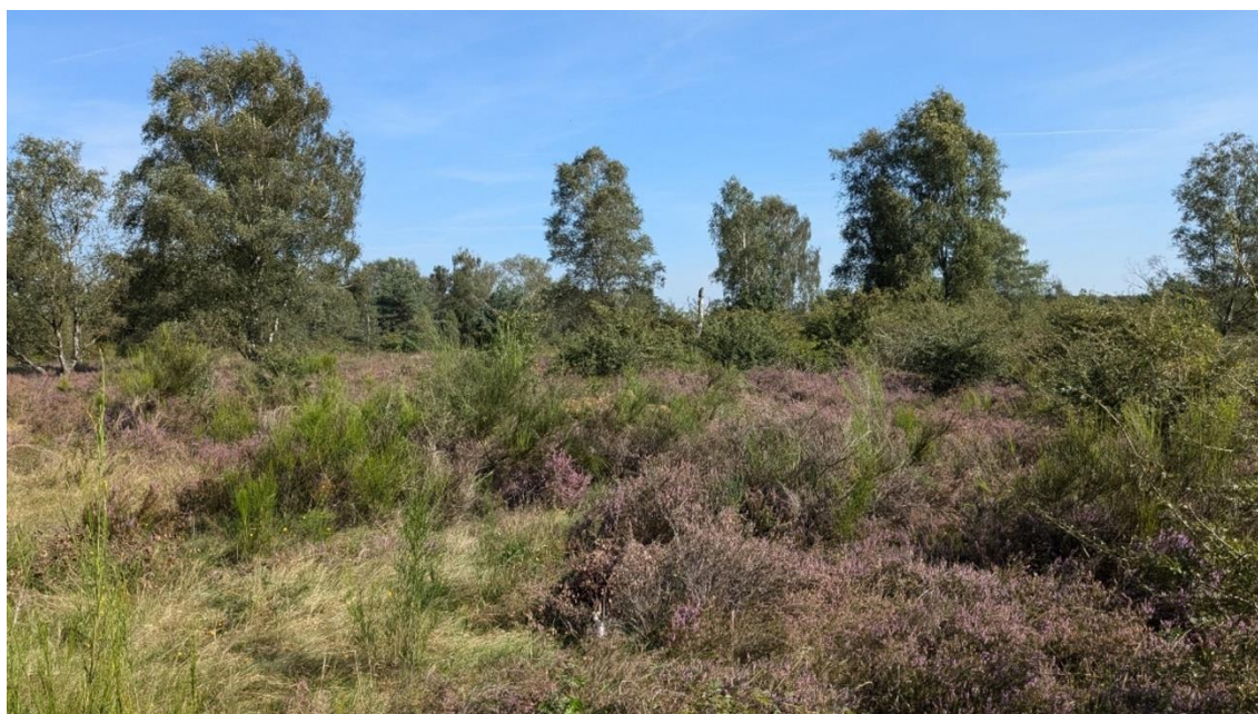
De structuurrijke heide van de Grootte Heide: perfect zadelsprinkhanenhabitat

Die gaan de negatieve effecten van stikstof tegen, waardoor de Grootte Heide in tegenstelling tot veel andere heideterreinen geschikt is voor de zadelsprinkhaan.”