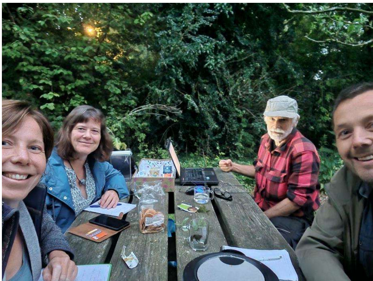
Foto: Bestuursvergadering in het kleine beestjes paradijs 29 augustus 2023