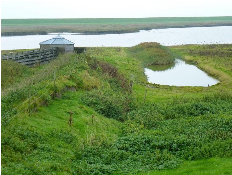
samenstelling: Sieds Rienks