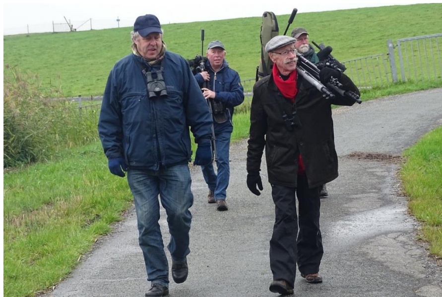
Bij de Kiekkaaste