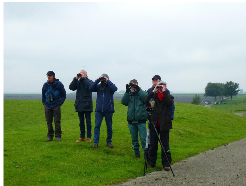
Op de dijk bij Nieuw Statenzijl – foto's Sieds en Nanny