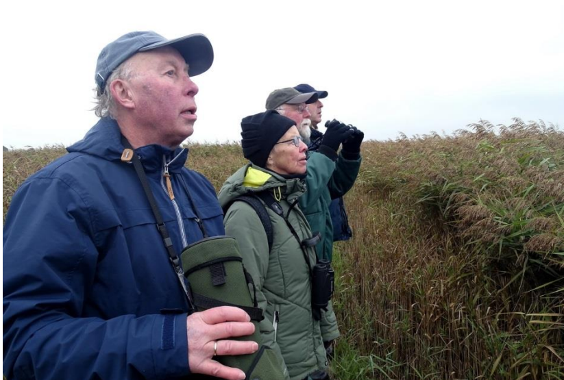
Kijken naar de Baardmannetjes – foto Sieds