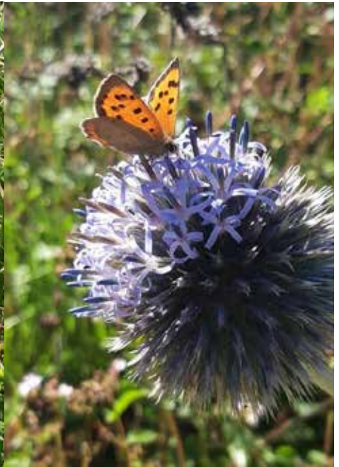
Kleine vuurvliinder op kogeldistel