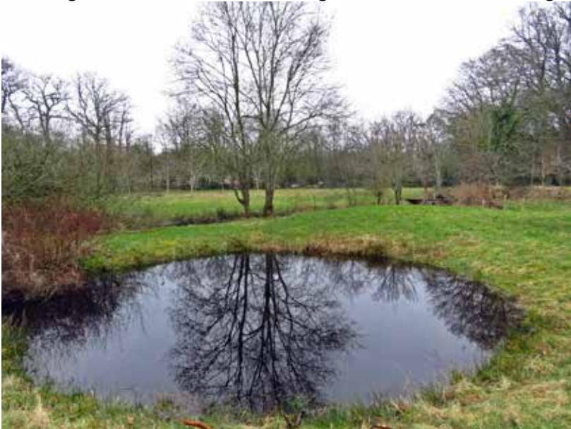
Zicht over volle poel en (achter de sloot) het graslandje met nog jonge walnootbomen.