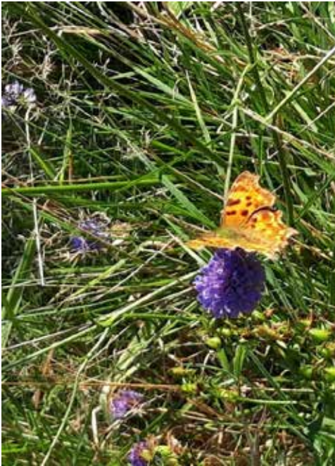
Gehakkelde aurelia op blauwe knoop

Vanaf 1 januari 2024 geldt de Omgevingswet. Dit is een nieuwe wet, die veel regelt voor de omgeving waarin u woont, werkt en leeft. De omgevingswet voegt 26 bestaande wetten samen in één nieuwe wet. De wet geldt voor alle inwoners, organisaties en bedrijven.