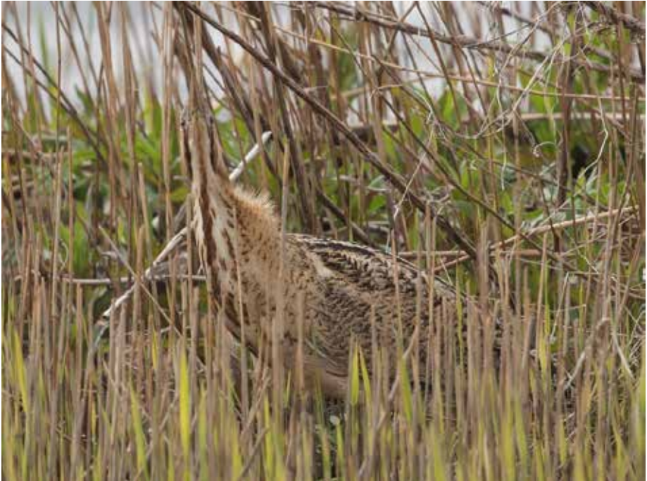
Roeddomp in paalhouding