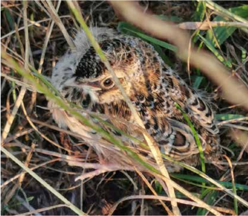
Jonge veldleuwerik op vliegveld