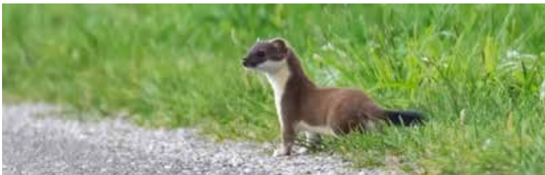
Hermelijn in de Oostpolder