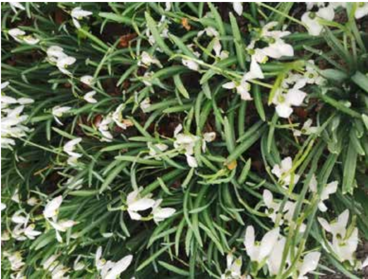
Sneeuwklokjes in de motregen 15 februari 2024