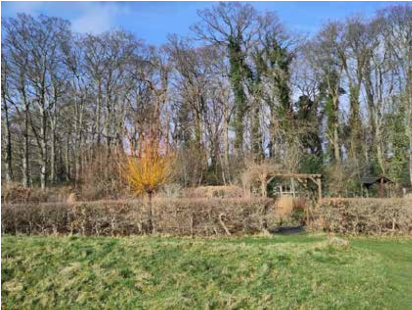
Zicht richting de cultuurtuin, achter de haag.