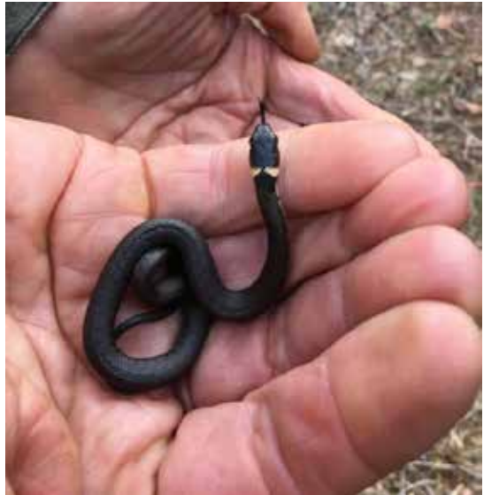
Ringslang jong

De slangen worden regelmatig gezien vanaf de rand van de dorpskom van Eelde tot aan het vliegveld. Helaas zijn er nogal wat mensen bang voor slangen, wat bij ringslangen helemaal niet nodig is. De aanwezigheid van Russische rattenslangen maakt het er niet beter op doordat die vaak groter zijn (en hun naam helpt ook al niet ...). De ringslang kwam vroeger voor in heel veel, vochtige gebieden