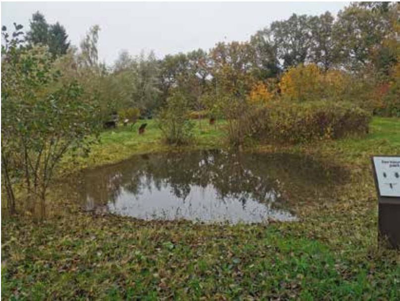
Overzicht terrein, november 2023

-In augustus is her en der oudere aanplant van struiken ontdaan van braamgroei. Ook het westpad aan de rand moest een keer vrijgesteld worden van ingroei van braam.