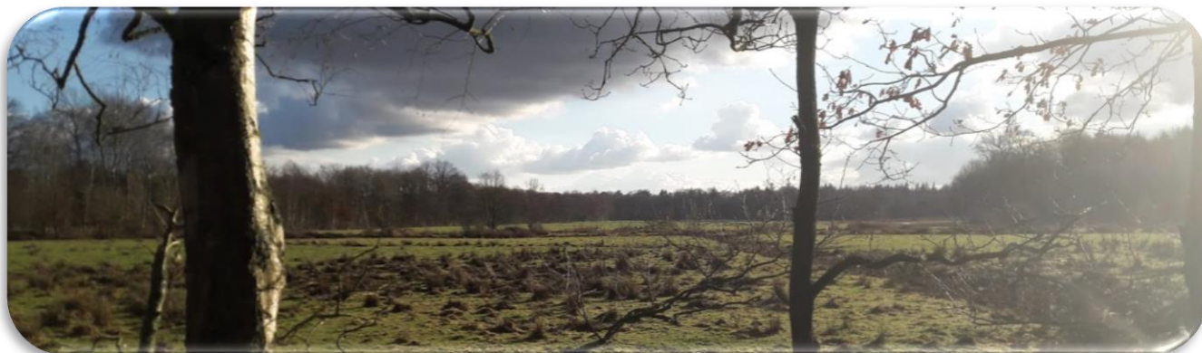
Het Nonnenland, een nat gedeelte in de boswachterij De Vuursche van Staatsbosbeheer. Aan de horizon de Embranchementweg.