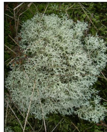
Open rendiermos.