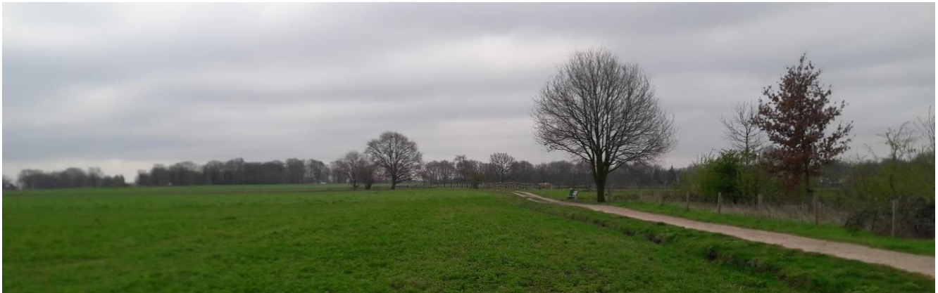
Het Enghenbergsteegje op de Eng, waar de grafheuvel het hoogste punt van het dorp Soest is.