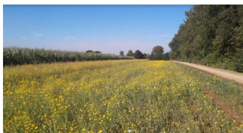
Proefveld van Pieter Kuijer langs het Chris Uijterwijkpad met o.a. gele ganzenbloem vorig jaar.