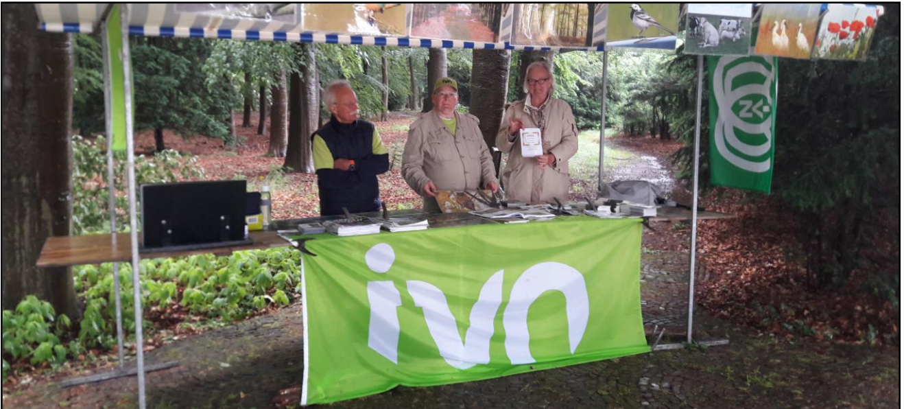
Het IVN-kraampje op de jubileumviering van Groei & Bloei afdeling Soest. Door de regen waren er zaterdag 8 juni weinig bezoekers.