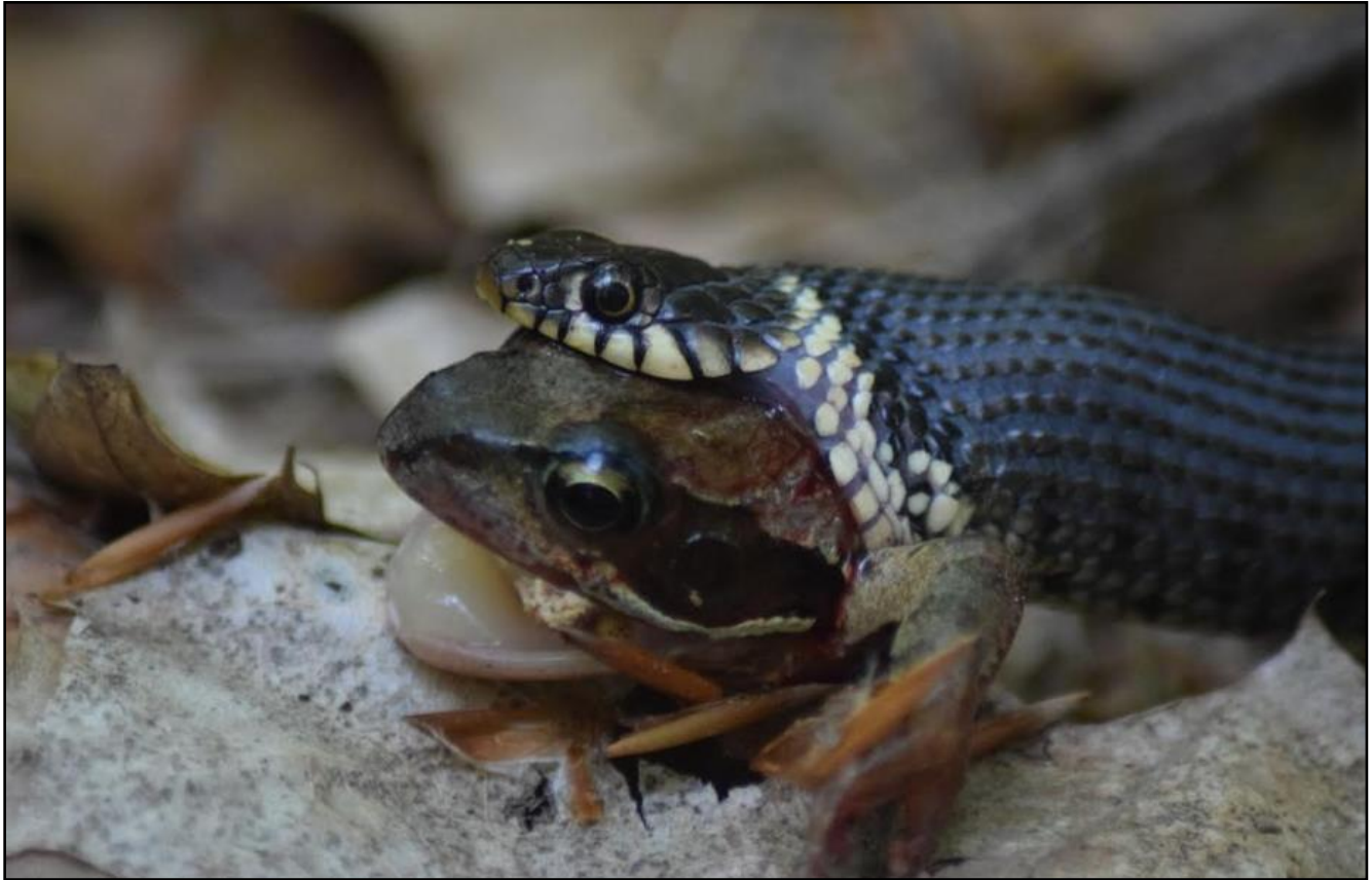
Ringslang met bruine kikker in zijn bek in Op Hees in Soest.