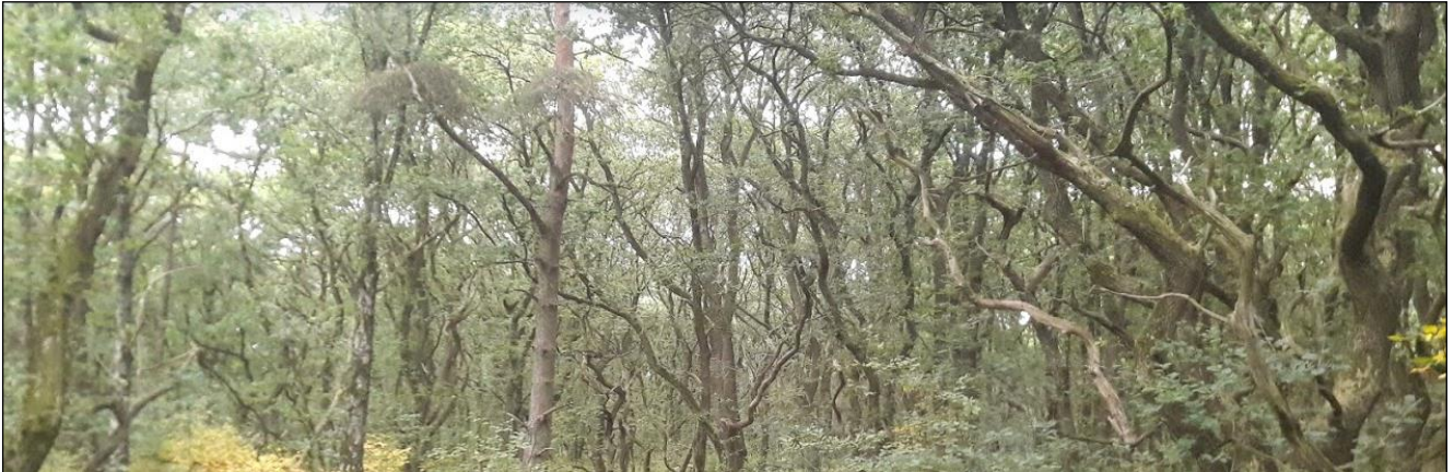
De grillige bomen van het eikenstrubbenbos op De Stompert zijn zondag 11 augustus te zien tijdens de IVN-wandeling aldaar.