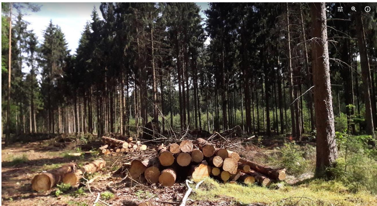
Boseigenaar a.s.r heeft veel sparren gekapt in Laag Hees, naar eigen zeggen wegens de letterzetter en de dennenscheerder, twee kevertjes die zich volvreten met het cambium van de bomen, die daardoor ten dode opgeschreven staan.