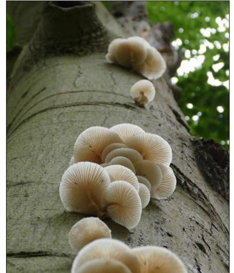
Vliegenzwammen op een heuveltje vol berken op De Stulp in Lage Vuursche. Rechts porseleinzwammen.