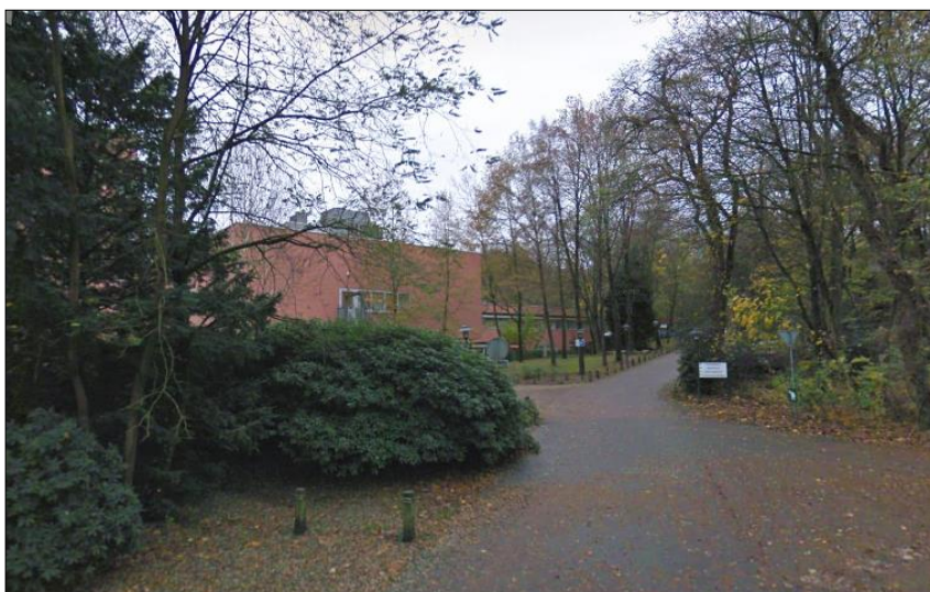
De groene hoofdstructuur van Baarn aan de Ringlaan.