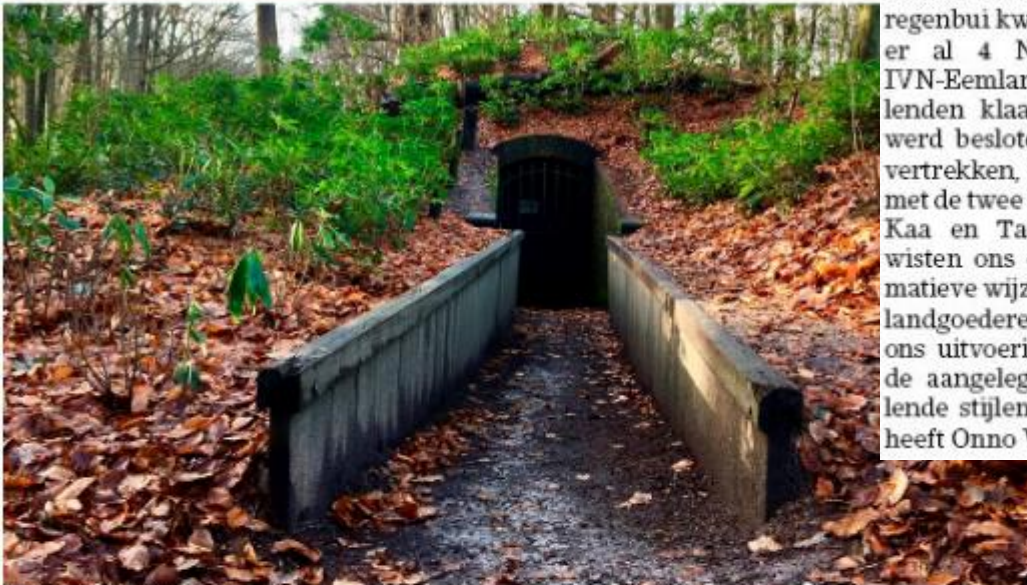
De labele, maar wel heel warm en afweersloer.