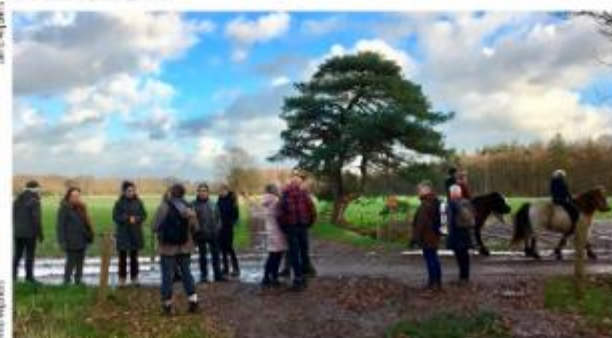
Bij het bekende Pijpde Clowet laantje.