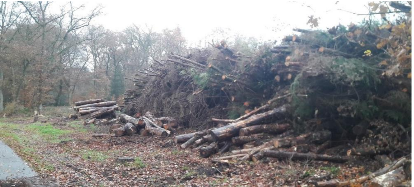
De bomenkap in het ASR-bos in Laag Hees is behoorlijk omvangrijk.