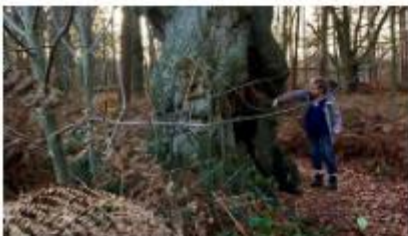
Prachtige oude boom.