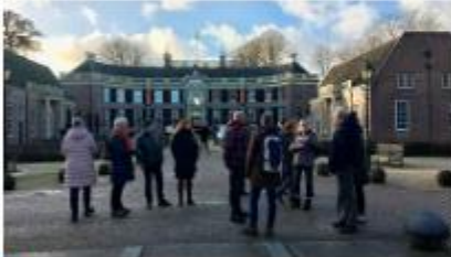
Kasteel Groeneveld, rijksmonument, nu van Staatsbosbeheer.