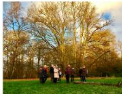
Prachtige open plek in Buitenzorg.