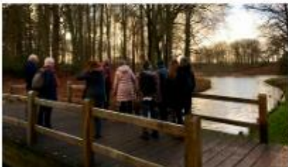
Bruggetje naar de vijvers van Groeneveld.