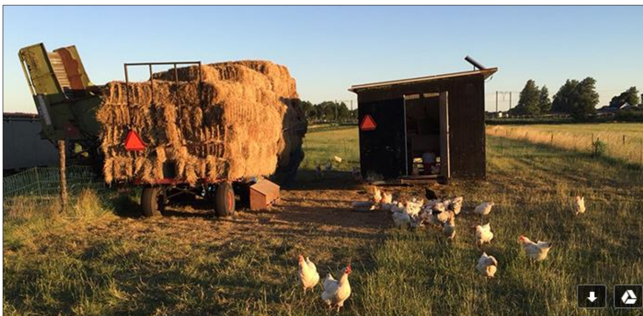
Vredelinger kippen bij boer Wytze Nauta.