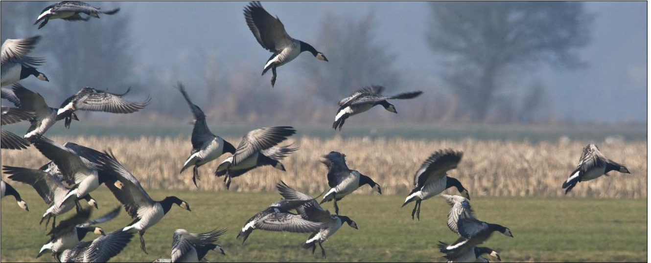
Brandganzen in de polder Arkemheen bij Nijkerk.