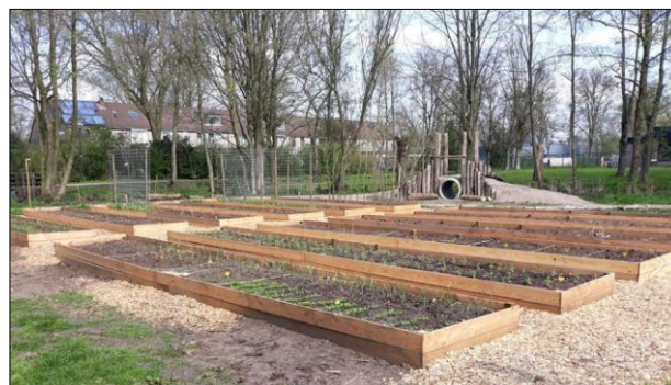
De bakken voor de moestuin in het prille beginstadium.

Kom leren enten - je krijgt je eigen appelboom mee naar huis! Neem graag eenjarige takken mee van jou lievelingsappelboom, dan kunnen we die ergens op enten!