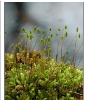
Sporen op mos.