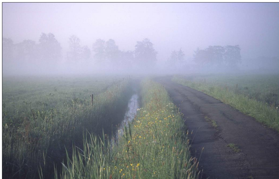
Voorbeeld van een bloemrijke berm in de Eempolder.

● De gemeente Soest heeft een Uitvoeringsprogramma vastgesteld dat behoort bij het Landschaps- en Ontwikkelings Plan (LOP) 2019-2024. Daarin staan heel wat ambities die voor het IVN hoopgevend zijn, onder andere: