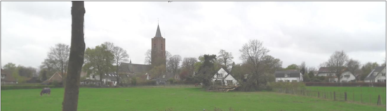
De Kerkebuurt is beschermd dorpsgezicht van Soest. Onlangs kwamen er op een IVN-wandeling door de buurt en over de Eng maar liefst 60 mensen af.