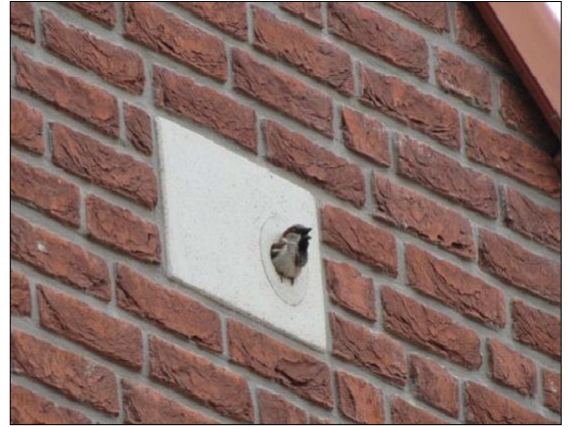
Een mooi voorbeeld van natuurinclusief bouwen: huisvesting voor de huismus.

● Het college heeft voorgesteld om dat toe te passen bij de bouwplannen Oude Tempel in Soesterberg, het Dalweggebied in Soest en de huisvesting van het serviceteam aan de Lange Brinkweg. Daar ligt een groen dak en er zijn maatregelen genomen om vogels en vleermuizen onderdak te bieden. Meer hierover staat op www.soest.nl/bewustwonen .