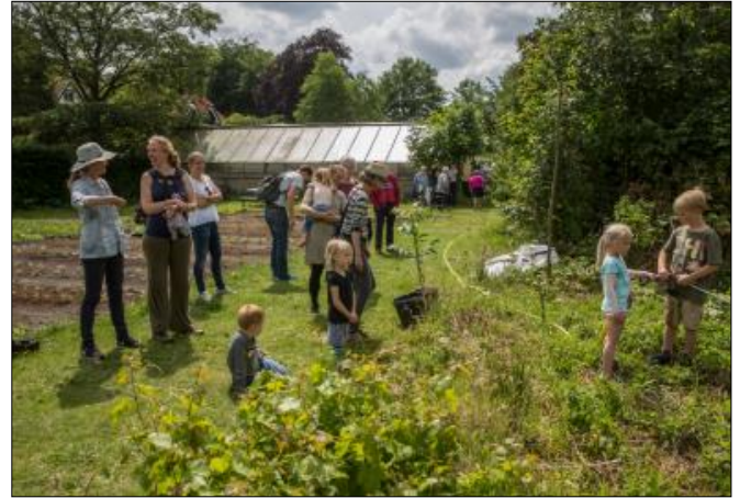
Open dag in 2019.

Deze activiteiten zijn nog steeds gratis - laat ons weten of je komt op: info@eetbaarsoest.nl !