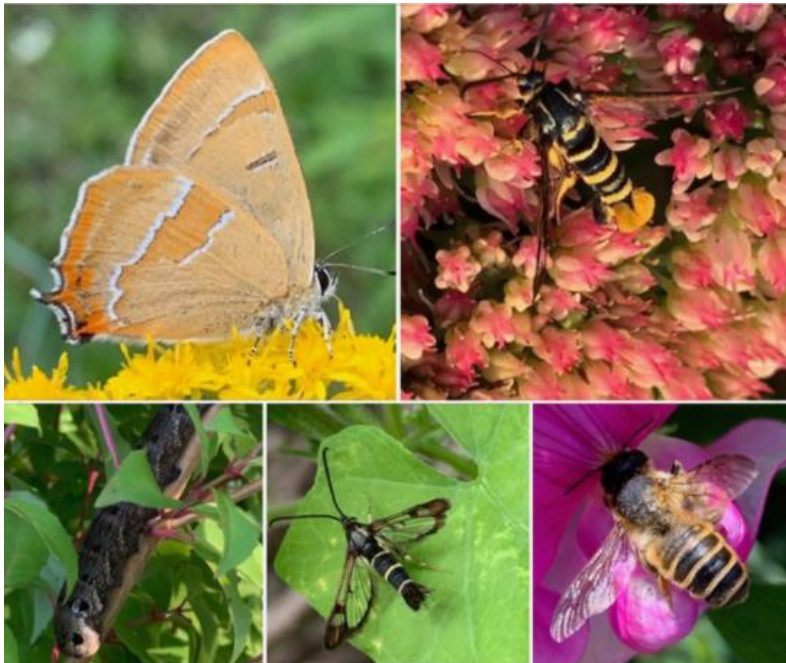
Gefotografeerd op de biologische volkstuin 't Nut.

Boven: vlnr sleedoornpage en eikenwespvlinder. Onder: vlnr groot avondroodrups, bessenglasvlinder en lathyrusbij.