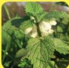
▲ Witte dovenetel