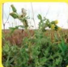
▲ Klein kruiskruid