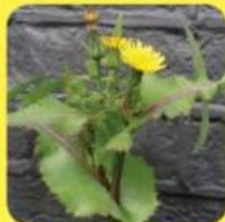
▲ Gewone melkdistel