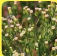
▲ Canadese fijnstraal