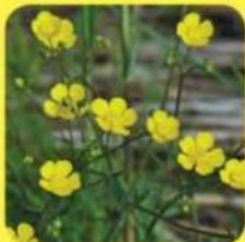
▲ Scherpe boterbloem