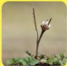
▲ Kleine veldkers