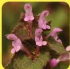
▲ Paarse dovenetel