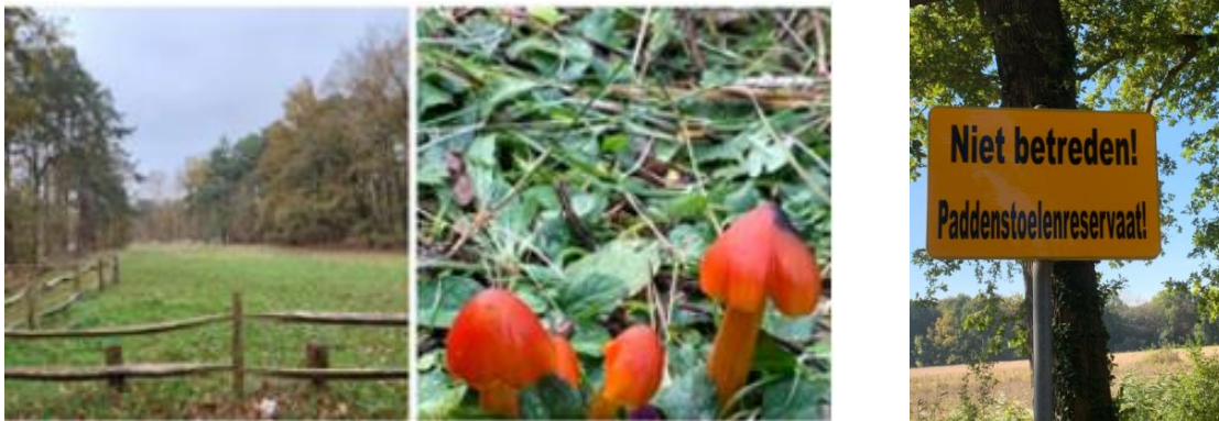
Het 'paddenstoelenreservaat' met rechts de zwartwordende wasplaat.