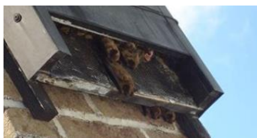
Een vleermuiskast.