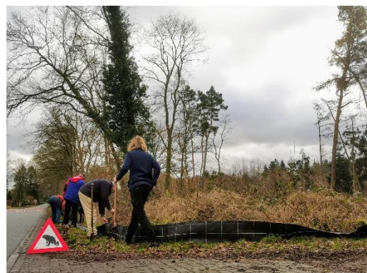
De paddenschermen houden padden tegen die onderweg zijn naar het Soesterveen. Ze vallen in emmers en worden handmatig overgezet.