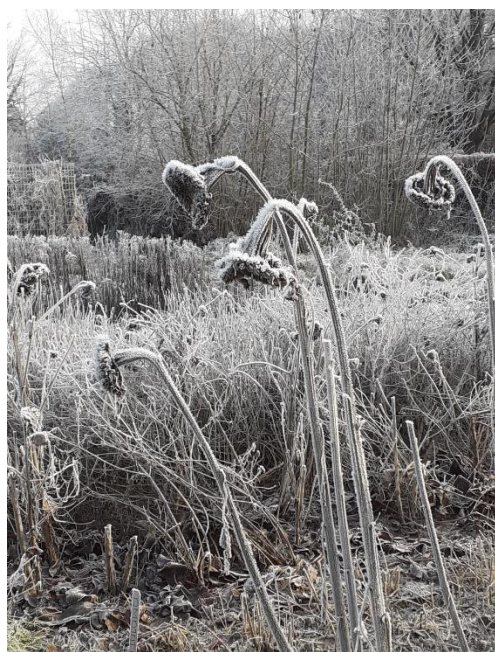
Ook in de winter hebben planten hun schoonheid.

● Dan controleren we ook of er al eierschalen zijn en weten we dus of de hoop afgelopen jaar benut is. Eventueel gevonden schalen zullen we bewaren. Ook zullen we dit voorjaar (deels inheemse) bloemplanten zetten bij het informatiebord bij de