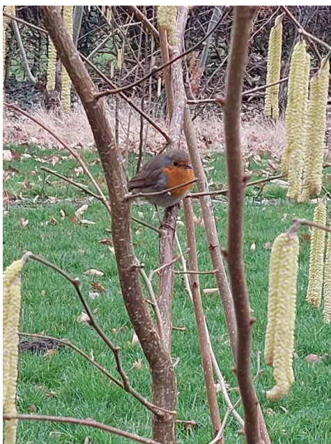
Roodborstje op de hazelaar.

● Er is veel blad geharkt en op de tuinen en onder bomen verspreid. Er zijn meer houtsnippers op paden gestort. Een teveel aan wilde bramen is verwijderd. Alle appel- en perenbomen zijn gesnoeid. Er zijn bloembollen geplant.