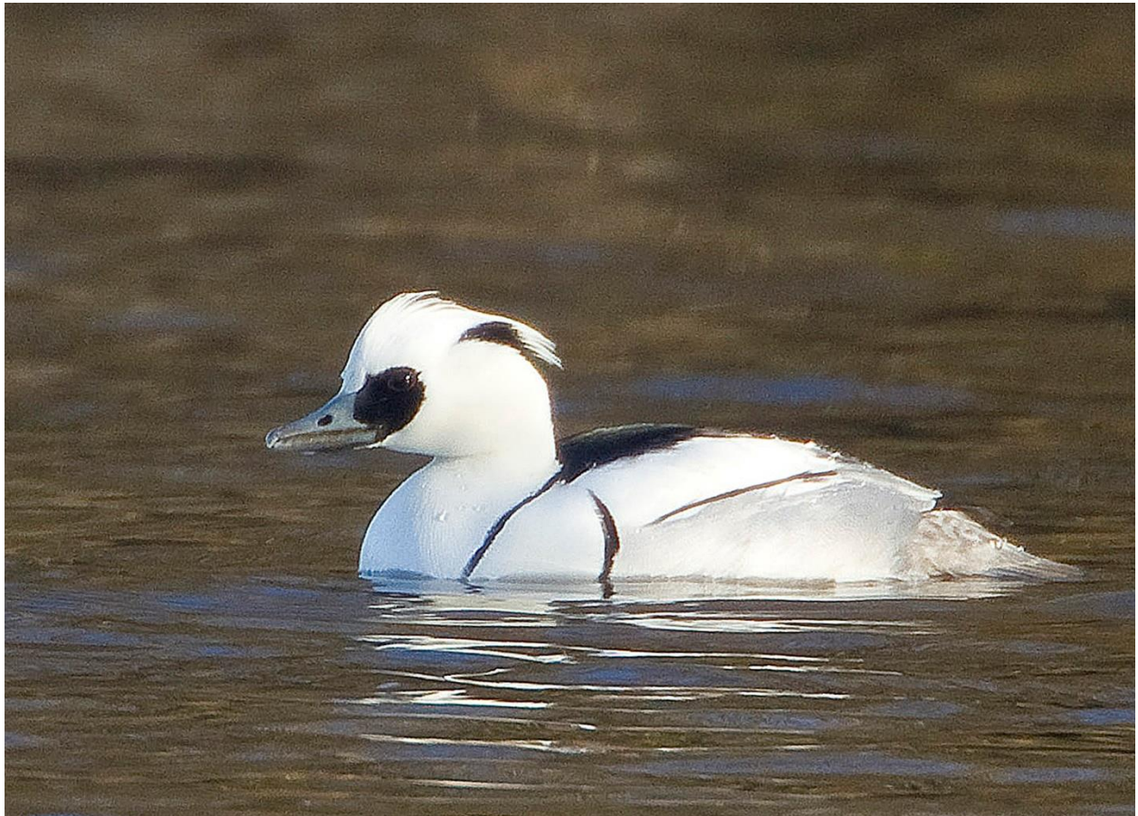
Het mannetje van het Nonnetje ( Mergellus albellus ), gefotografeerd in de Vitensplasjes bij de Westdijk in Bunschoten.