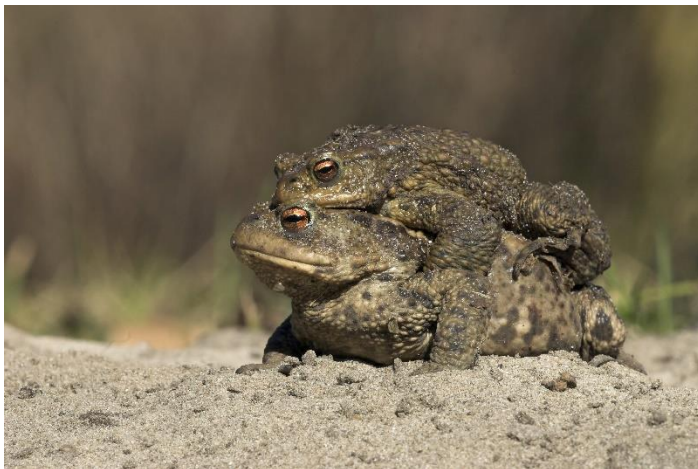
Dubbeldekker gewone pad.

● Kijk op www.ivn.nl/afdeling/eemland/padden voor actuele mededelingen. Mail naar padden@ivn-eemland.nl of neem telefonisch contact op met de coördinator Tim de Wolf (06-22083997). We houden je dan op de hoogte.