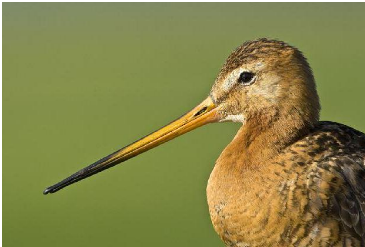
Grutto aan de Westdijk in Bunschoten.