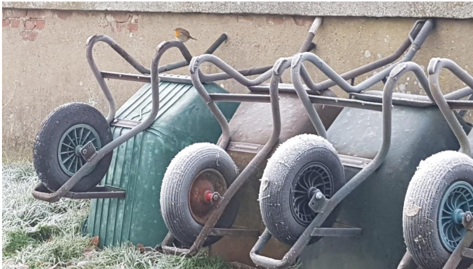
Het werk wacht.

● Bij het Paleis hebben we een voorstel ingediend voor 14 of 15 open dagen in 2022, van april t/m oktober. Dit komt straks op de website. Ieder is uiteraard van harte welkom om met ons mee te genieten.