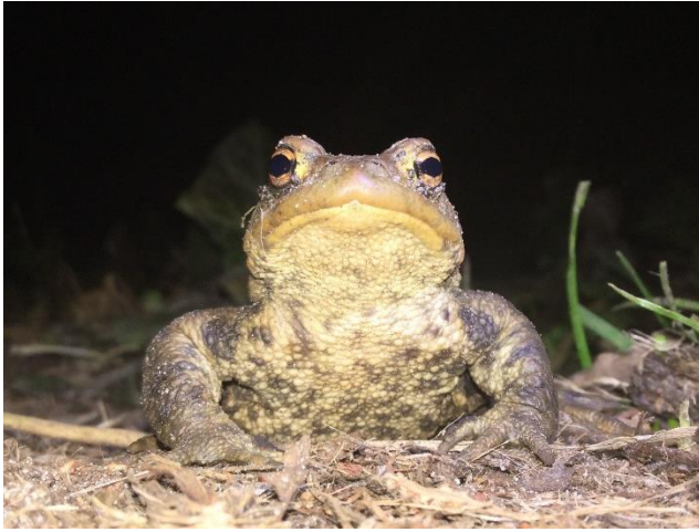
Frontaal aanzicht pad.