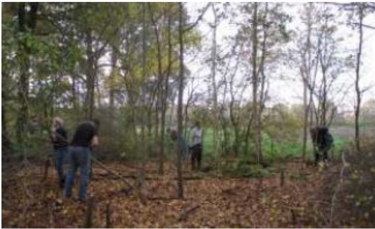
Natuurwerkdag 2015 op Eykenstein.

de Kozakkenput kwam weer aan de beurt. De ambitie van de natuurwerkgroep groeide in loop van de tijd. Om korstmossen nog meer kansen te geven, werden de eerste plannen gemaakt voor een korstmosherstelplan.