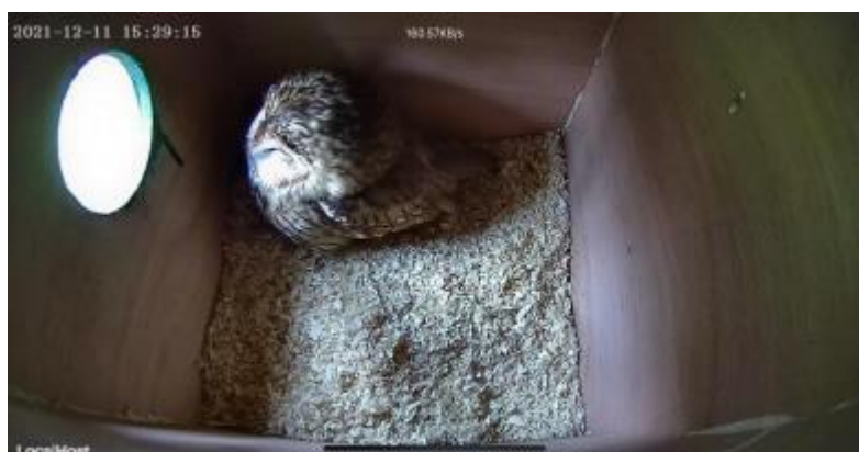
Bosuil inspecteert de nieuwe woning.

● Najaar. Doordat we in 2020 zo weinig hebben kunnen doen, kwam er in 2021 veel werk op ons af. Er moesten nieuwe kasten gemaakt worden, als renovatie en als uitbreiding op nieuwe adressen. Met hulp van het IVN konden materialen gekocht worden. En natuurlijk een volledige schoonmaakronde. Met dank aan al onze vrijwilligers is de klus geklaard. Als primeur werd een bosuilenkast gemaakt met camera faciliteiten, waar nu prachtige beelden van ontvangen. Mooi staaltje samenwerking tussen de kasteigenaar en onze werkgroep.