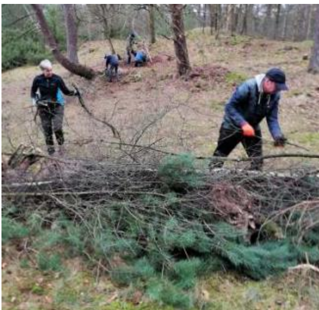
Aan het werk in februari 2020.