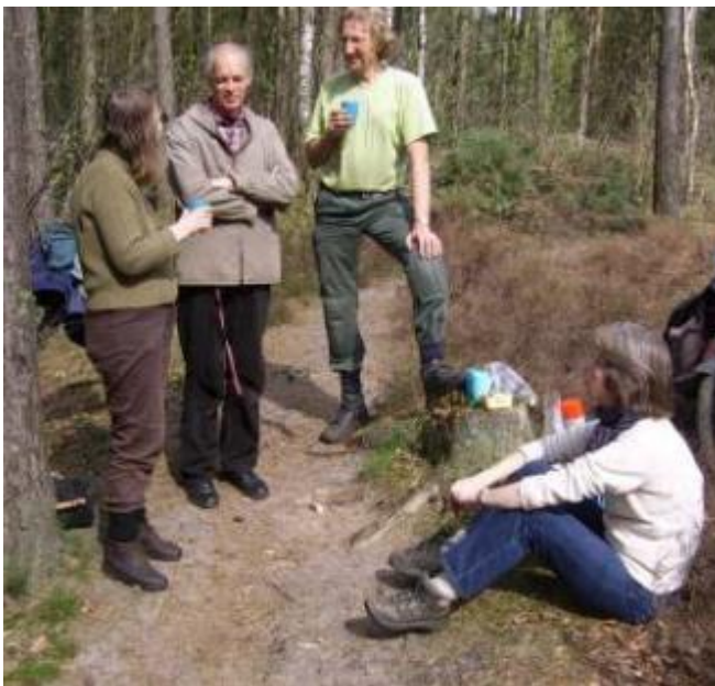
De pioniers in 2012.

● De natuurwerkgroep van het IVN en de KNNV bestaat tien jaar. De werkgroep is in principe elke vrijdagmiddag actief in een natuurlocatie van 13.30 uur tot 16.30 uur. Er wordt afwisselend gewerkt in de omgeving van Den Dolder/Soest (Hees en De Zoom) en Zeist (Kozakkenput). Gereedschap om mee te werken kan zelf worden meegenomen, maar is ook beschikbaar. Mee doen mag altijd, dat kan eenmalig of vaker zijn, iedereen is welkom. De locatie kan nog wel eens wisselen, daarom graag opgeven bij Simone Laanbroek, 06-57075182 of natuurwerkgroep@ziggo.nl .