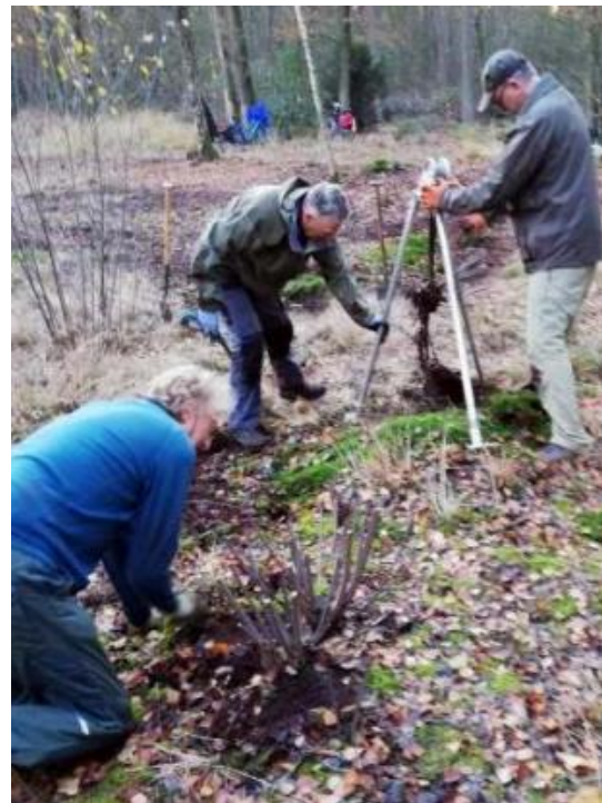
Ridderoordse Bos 2019.

● Het plan is om een nieuw heideveldje te ontdoen van opslag. Verder willen we de heideveldjes in Hees, De Zoom, het Ridderoordse Bos en de Oude Tol weer na lopen. De gemeente is van plan rondom de jeneverbessen een aantal bomen te kappen, zodat ze nog meer licht krijgen. De natuurwerkgroep kan daarna dan de jonge opslag er omheen verwijderen. Ook het veld van het korstmos herstelplan kan worden gecontroleerd. De Amerikaanse vogelkersen in de Kozakkenput zijn nog niet allemaal uitgeput, na het broedseizoen gaan we daarmee verder. Als nieuw project wordt geprobeerd een poel te realiseren in Hees vlakbij de Wieksloterweg. In die tien jaar is er heel veel werk verzet. Ongetwijfeld weten de groepsleden dan wel de beheerders ook voor de komende jaren klussen te verzinnen.