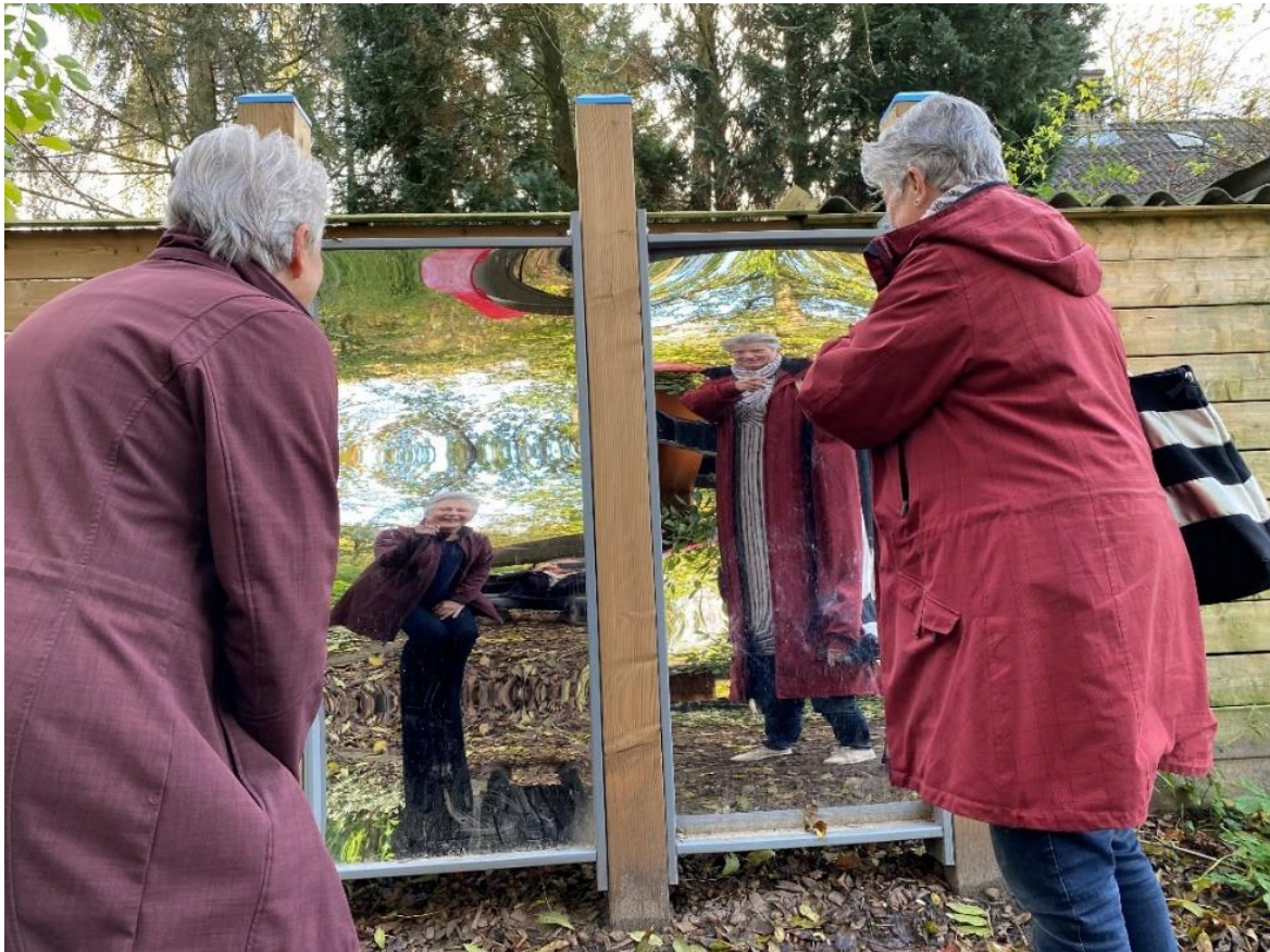
Gevoel voor humor is een van de functievereisten van de scholenwerkgroepcoördinator.