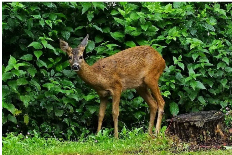
Ook reeën worden gesignaleerd in het Oude Tempelbos.

● Het Tempelbos in Soesterberg is ook ecologisch van grote waarde, stelt de PvdD. Elf beschermde diersoorten zijn in elk geval al waargenomen. Er zijn meerdere dassenburchten aanwezig, verder is het bos de thuishaven van een buizerd, boommarters, hazelwormen en vleermuissoorten, waaronder de rosse vleermuis en zeldzame vlinders. In een grote biodiversiteitscrisis is bomenkap een slecht idee.