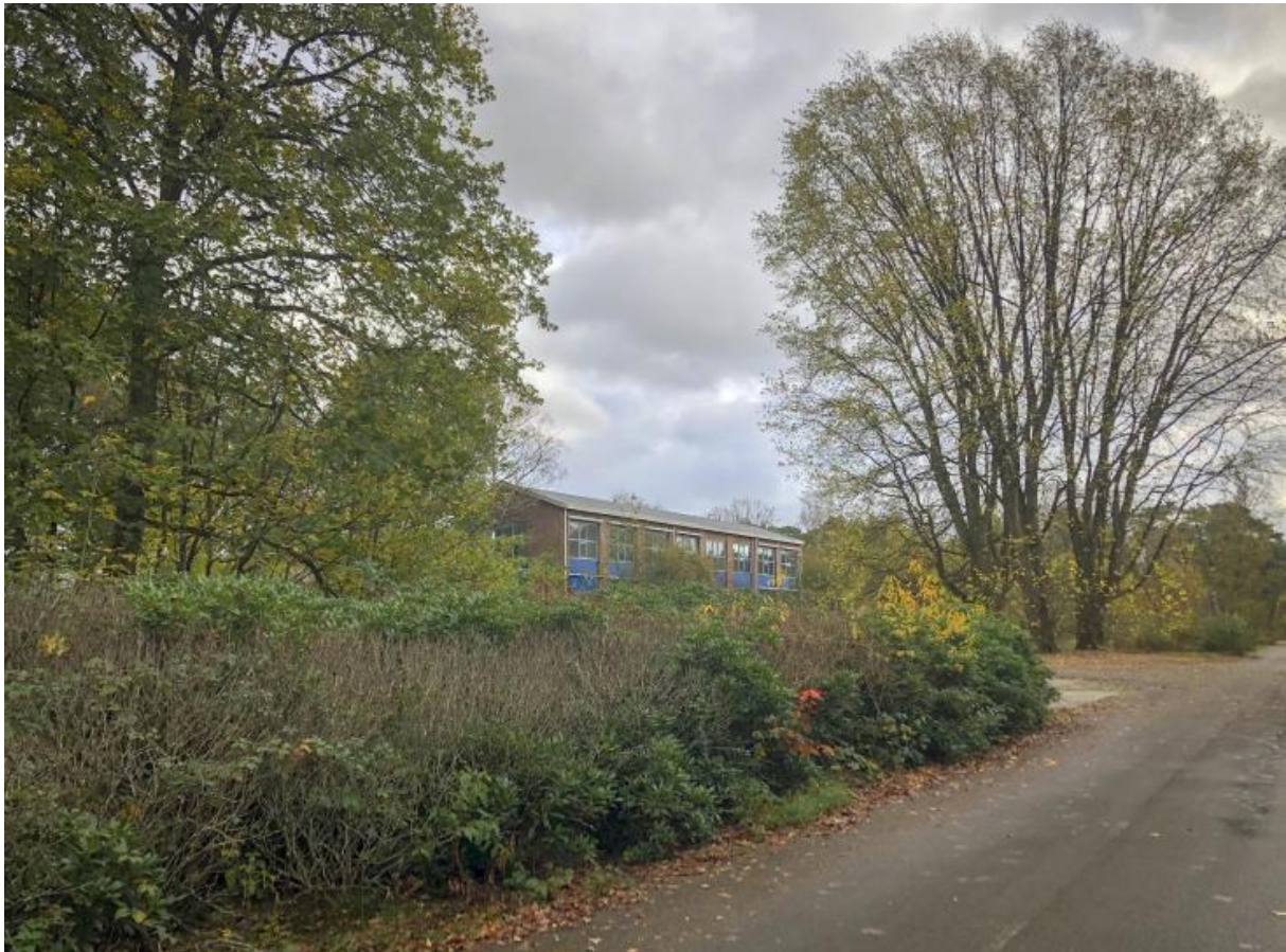
Het kantoor van het voormalige Militaire Luchtvaart Museum Soesterberg staat op Kamp van Zeist.

● Het voormalige militaire terrein Kamp van Zeist aan de rand van Soesterberg wordt deels ingericht als natuurgebied. Voordat de provincie Utrecht hiermee start, onderzoekt ze eerst uitgebreid of het terrein en de gebouwen geen verontreinigende stoffen bevatten. Ook laat ze onderzoek doen naar de aanwezige planten en dieren. Daarna worden bijna alle militaire gebouwen gesloopt en wordt de verharding verwijderd. In 2030 moet het natuurgebied klaar zijn. De provincie Utrecht is sinds 1 november 2022 officieel grondeigenaar van Kamp van Zeist.