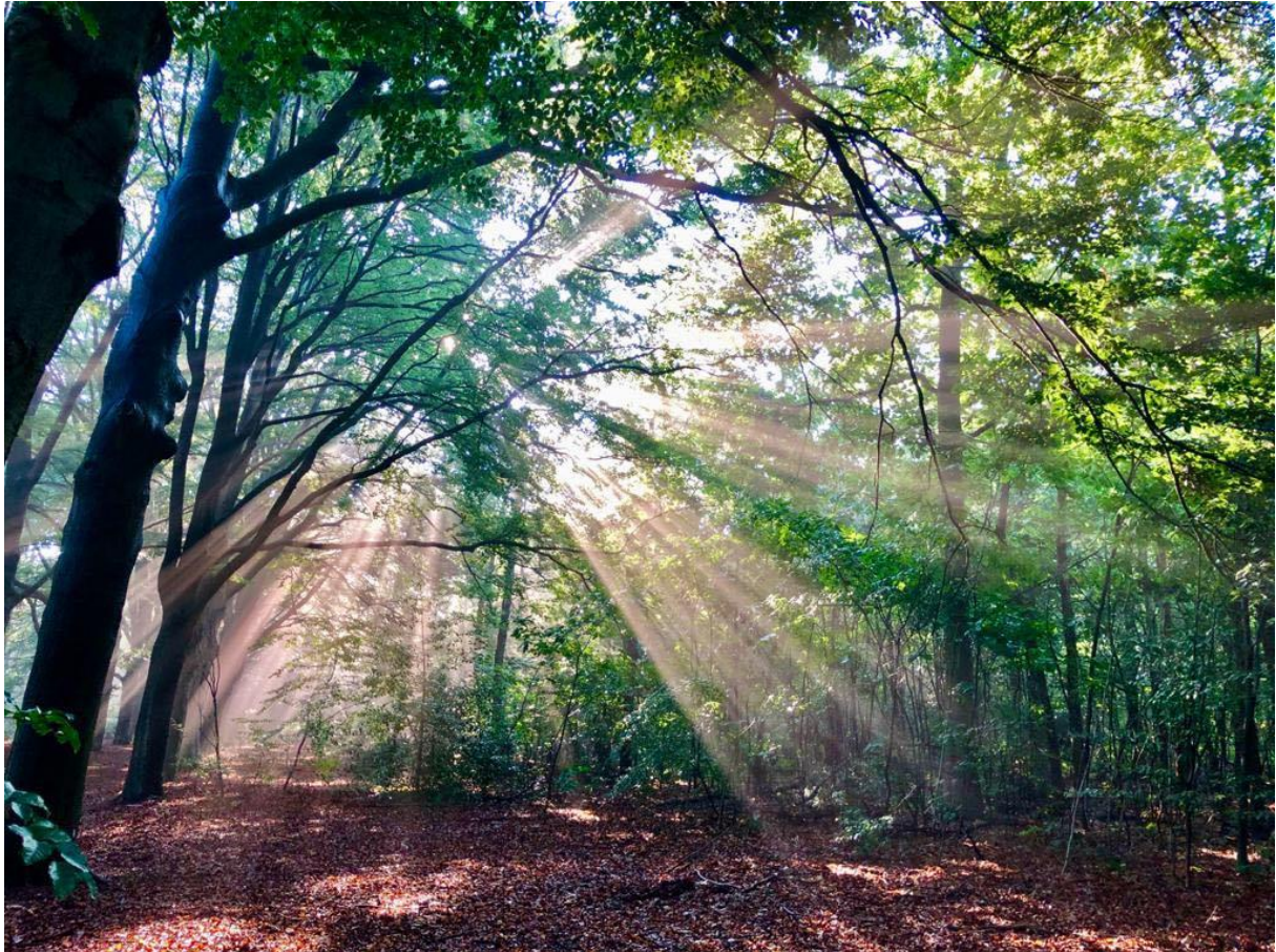
Zonlicht speelt door de bomen in het bos van Landgoed Oude Tempel.

● Om het bos van Landgoed Oude Tempel in Soesterberg tegen dreigende woningbouw te beschermen, houdt de werkgroep Soest van de Partij voor de Dieren zaterdag 3 december een speciale dag. Op bomen worden zogeheten treetags aangebracht. Dat zijn duurzaam geproduceerde boomposters waarop het belang van een boom voor mens en maatschappij is aangegeven.