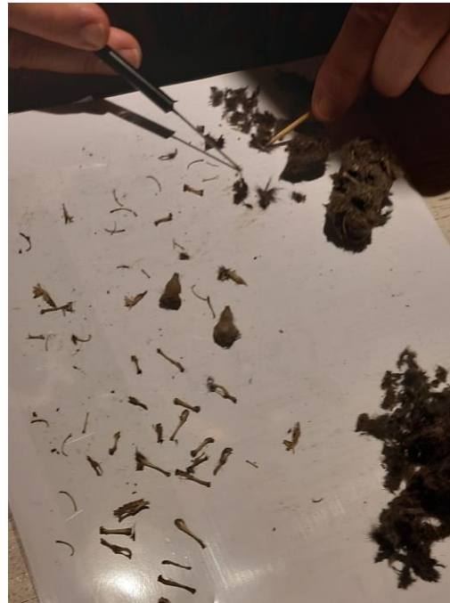
Ongelooflijk wat er allemaal in een braakbal te vinden is!