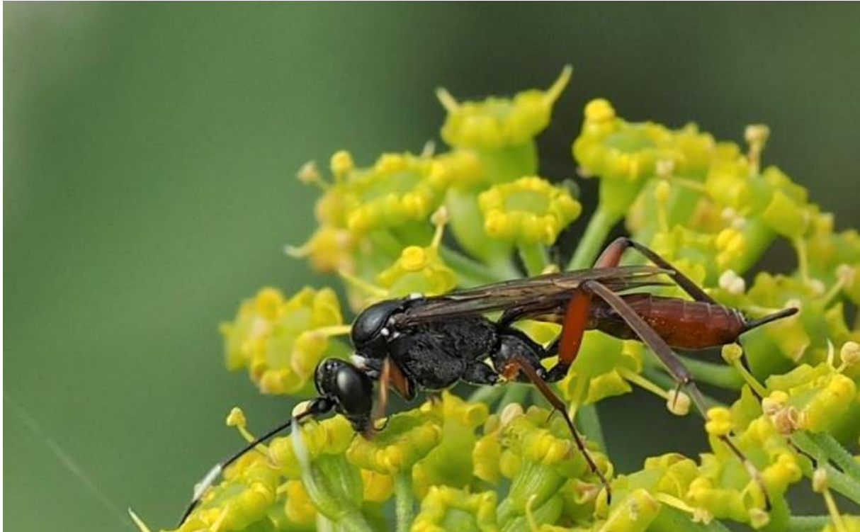
Hoplismenus (spec.), een sluipwesp.

● Dick Belgers van de Wageningen Universiteit hield op 23 maart de leden die aanwezig waren tijdens de Algemene Ledenvergadering aan zich gekluisterd door een boeiende lezing over insecten met prachtige beelden. Hieronder een paar brokjes informatie. Wie meer wil weten kan op research.wur.nl/en/publications of bij Eis Kenniscentrum Insecten verder speuren.