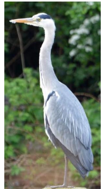
Blauwe reiger.