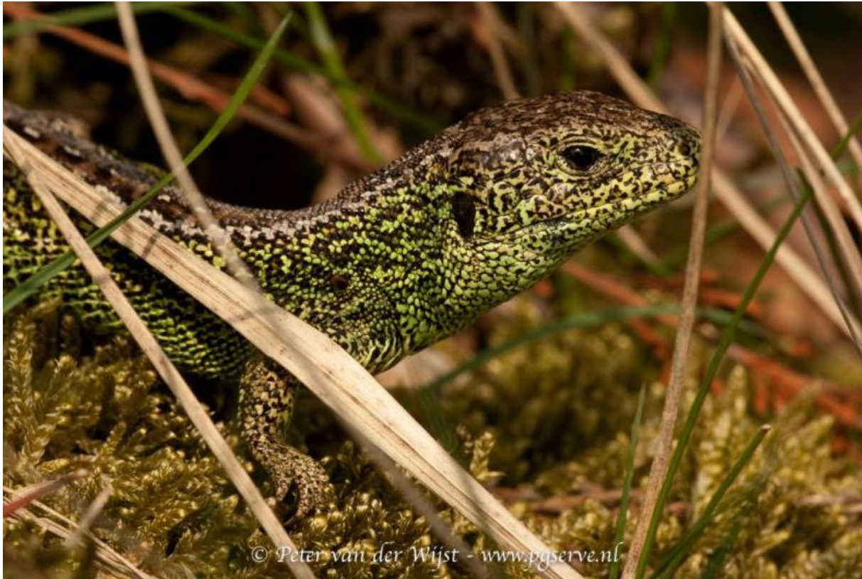
Zandhagedis (Lacerta agilis), wordt ook wel duinhagedis genoemd.

Utrecht Particulier Grondbezit (UPG), de Unie van Bosgroepen, Natuurcollectief Utrecht, RUD Utrecht en Provincie Utrecht onderdeel van het USN. De gemeenten Baarn , Rhenen en Soest zijn inmiddels ook aangesloten. In het USN zijn afspraken gemaakt om handhavers en toezichthouders beter te laten samenwerken in Utrechtse natuurgebieden.