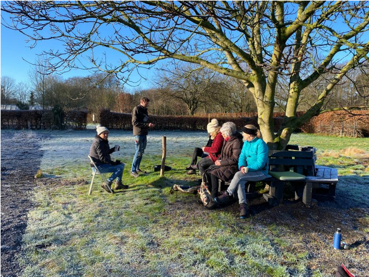
Rond de walnoot is een boombank geplaatst.