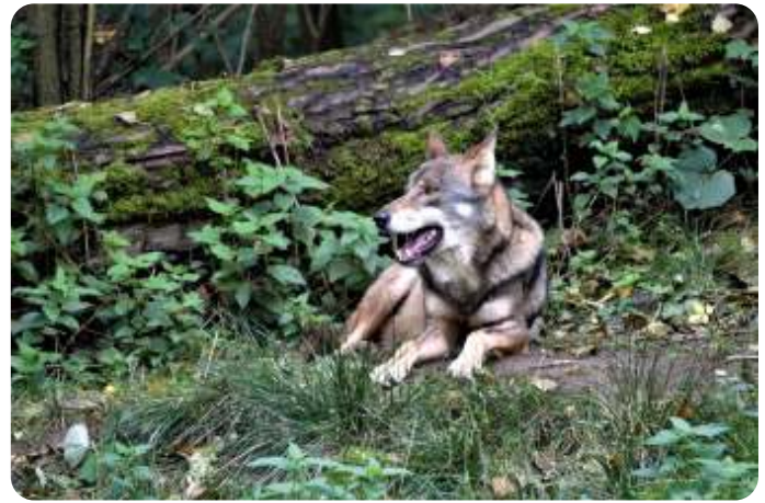
Wolvin met een gebit als een flinke herdershond

komen bij ons bij vleermuizen voor en het is de verwekker van hondsdolheid (rabiës). Louis Pasteur (1822 – 1895) ontdekte en ontwikkelde een effectief vaccin tegen hondsdolheid.