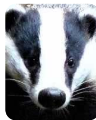
De locatie van de donkere ogen is met een zwarte achtergrond lastig goed in beeld te brengen.

knorren. In de winter is de kans een das te spotten minimaal. De das houdt weliswaar geen winterslaap, maar wel een winterrust. En de nachten zijn dan lang en vaak donker.