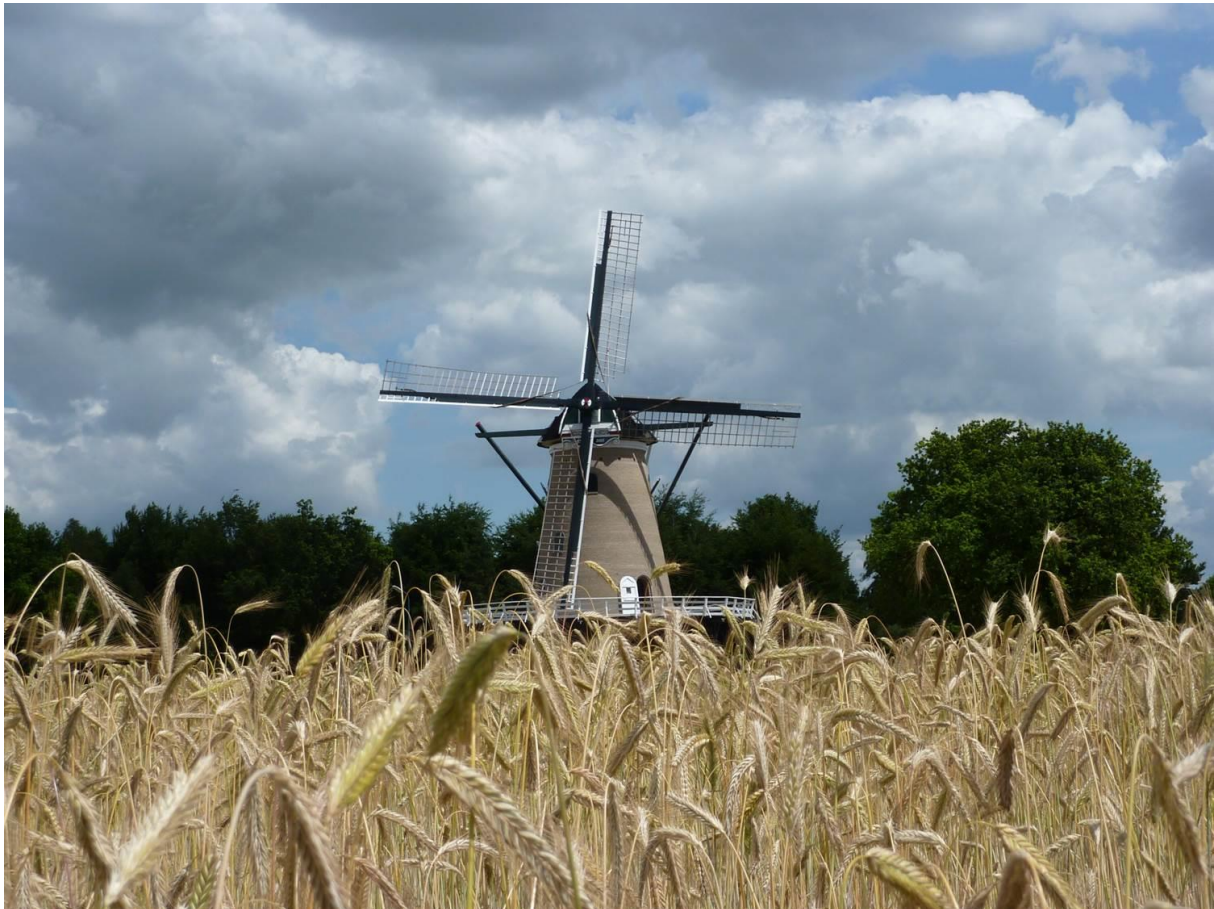
Molen De Windhond (2008) op de Soester Eng, met rogge op de voorgrond.