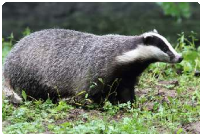
Volwassen das bij morgenlicht. Nu kan men goed het kleurenpatroon met een grijs lichaam en zwart-witte kop waarnemen. De kleine ogen, die donker van kleur zijn, bevinden zich in het laterale kopzwart. Dergelijke dieren kunnen, afhankelijk van de wind, soms tamelijk dichtbij komen, omdat ze een slecht zichtvermogen hebben.

Het beste kan men 's zomers op pad gaan, dan zijn de nachten kort en rond 21.00 uur begint een dassenmaag te