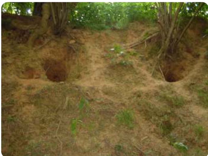
Twee holen in het talud van een holle weg in Zuid-Limburg. Waarschijnlijk gaat het hier om twee uitgangen van een grote burcht die door dassen is uitgegraven.

Als je een terrein verdenkt van bewoning door dassen, dan kun je zoeken naar graafgaatjes waarin fecaliën gedeponeerd zijn. Dassen maken veel kleine “wroet-plekken” als ze op zoek zijn naar wormen. Dassen zijn tevens hygiënische dieren die buiten de burcht latrines aanleggen. Ze plaatsen fecaliën in de gaten in de omgeving van een bewoonde burcht.