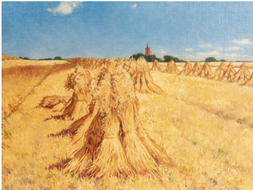
De Eng in Soest met roggeschoven, gezien richting de Oude Kerk, op een schilderij van de Soester kunstenaar J.H. Isings.

(aanmelding niet nodig, honden niet toegestaan)