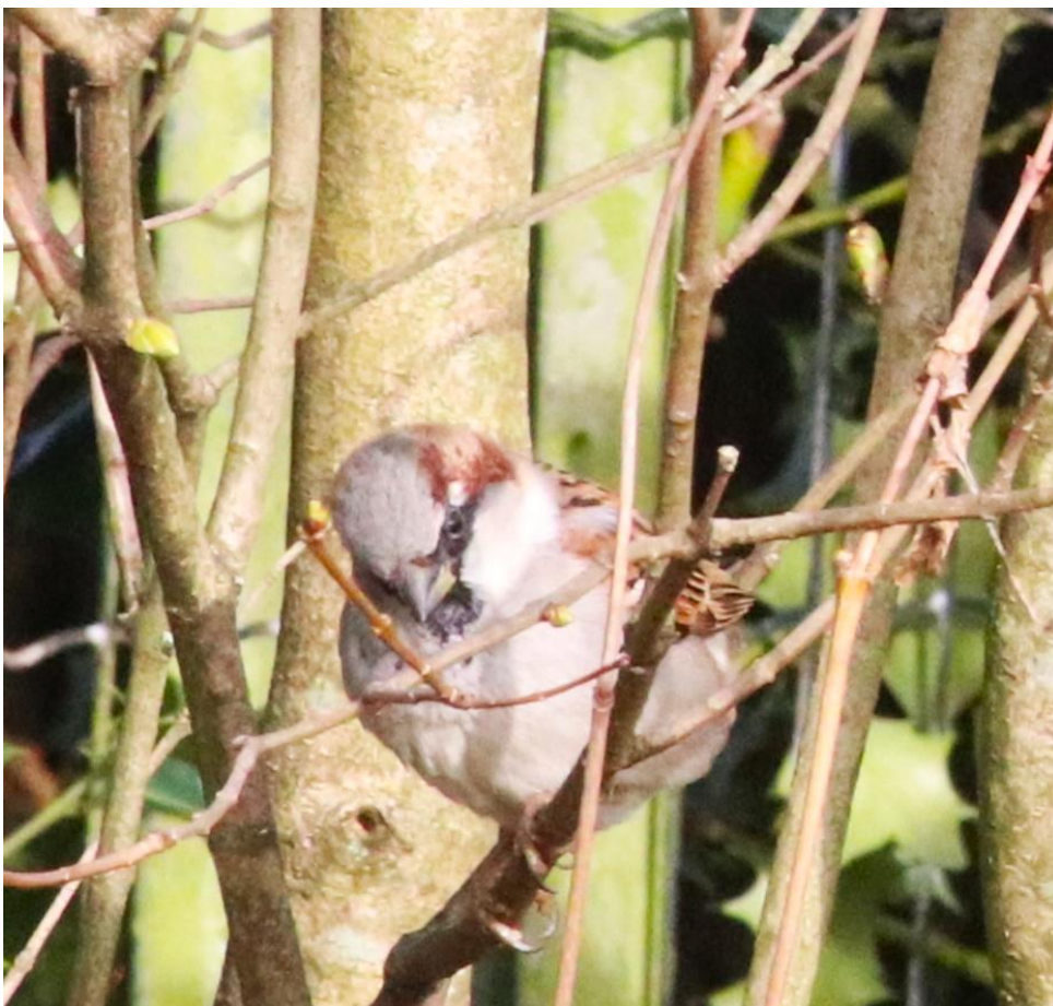
Mannetje huismus in Soest.