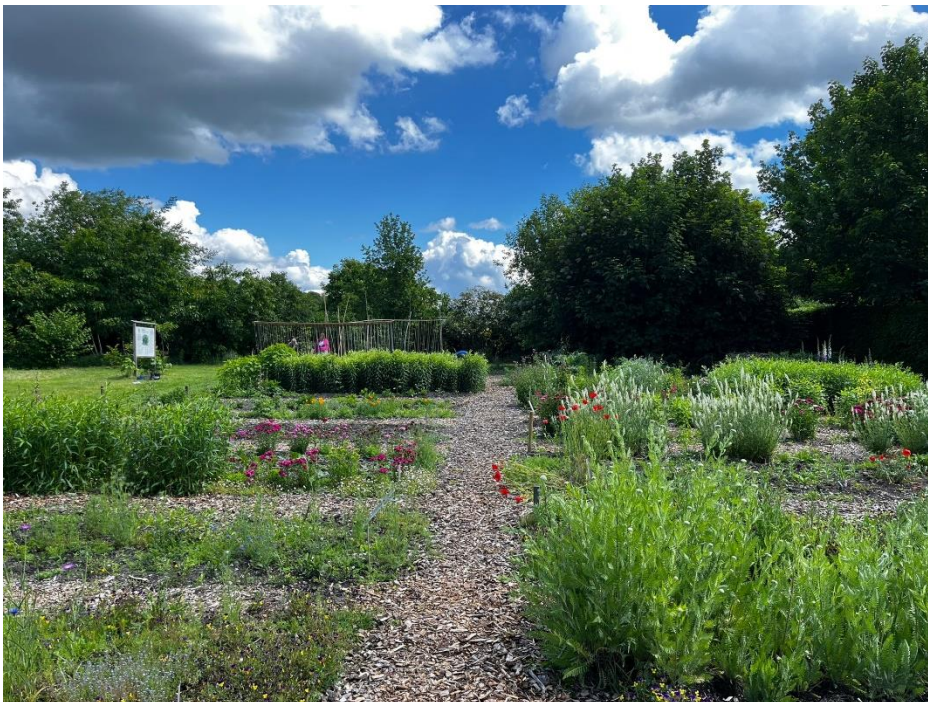
Beeld van de bloementuin in de Kwekerij. Ernaast wordt een terrein ingericht als natuurcompensatie.

Compensatie vindt plaats op de Kwekerij/Boomgaard door weiland om te zetten in natuur. Maar dat ligt niet in het Nationaal Natuur Netwerk (NNN) betogen tegenstanders. Ook geen argument, vindt de RvS, want het grenst er wél aan.