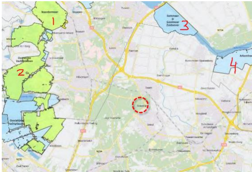
De vier Natura 2000-gebieden rond Paleis Soestdijk (midden in rode cirkel): 1. Naardermeer. 2. Oostelijke Vechtplassen. 3. Eemmeer en Gooimeer Zuidoever. 4. Polder Arkemheen bij Nijkerk.