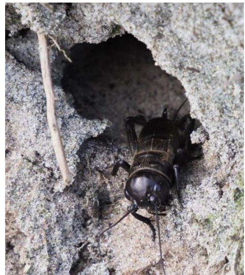
Veldkrekel op De Stulp.