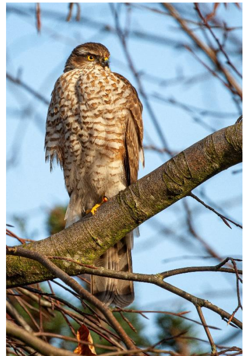
Geen sperwers gevonden.

● Hieronder het overzicht, waarop duidelijk te zien is hoe verschillend de resultaten zijn in de verschillende jaren.