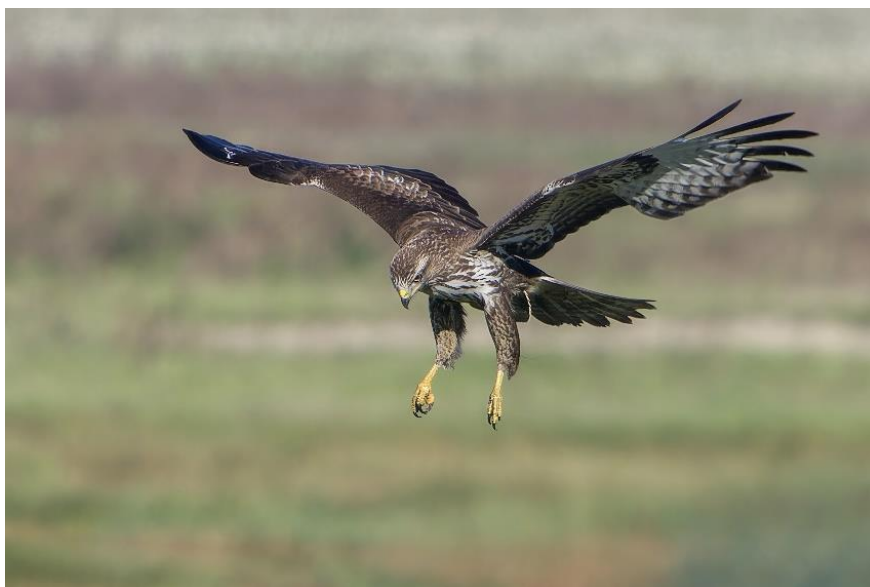
Jagende buizerd.

Lees hier het jaarverslag van de Natuur en Milieu Federatie Utrecht.