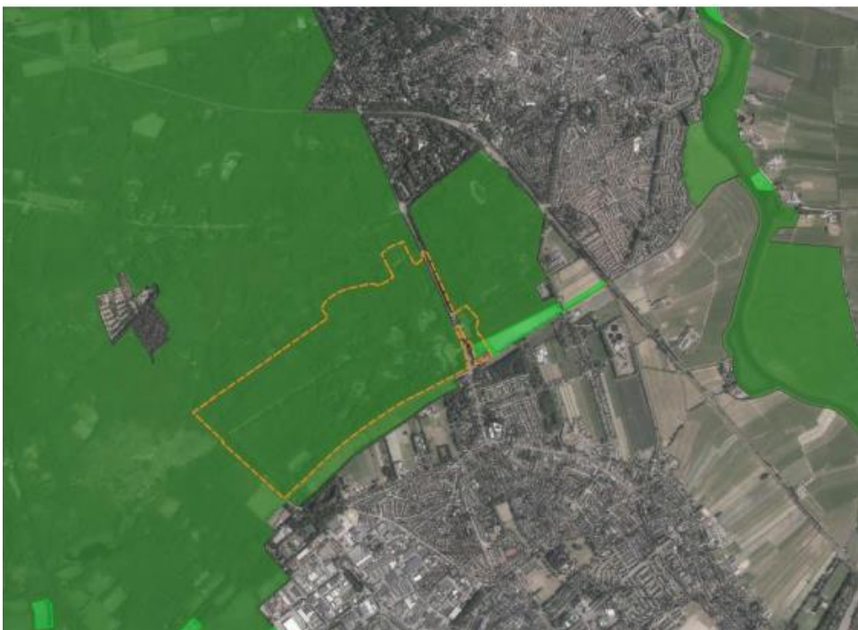
Ligging van het plangebied (binnen de gele stippellijn) in het donkergroene Nationaal Natuur Netwerk. De lichtgroene strookjes vallen binnen de provinciale Groene Contour.

● Omdat het IVN in de voorbereiding van het plan nauw betrokken is geweest bij de totstandkoming van het bestemmingsplan, is het interessant te weten waarom de Raad van State desondanks de bezwaren gehonoreerd heeft. Waarin zit nu het pijnpunt voor de deskundige juristen in Den Haag? Niet omdat ze allemaal groene vingers hebben of mee willen waaien met de huidige 'groene wind': nee, de Raad van State slaat de gemeenteraad van Baarn om de oren met het bestaand overheidsbeleid: het plan is juist onvoldoende, gezien het beleid dat in dit land, in deze provincie en in deze gemeente is opgezet om de natuur te beschermen. Ook is het een en ander 'onzorgvuldig' voorbereid.