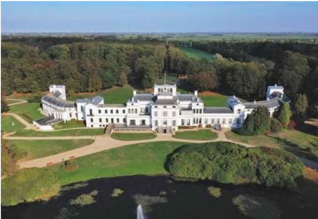
Paleis Soestdijk.