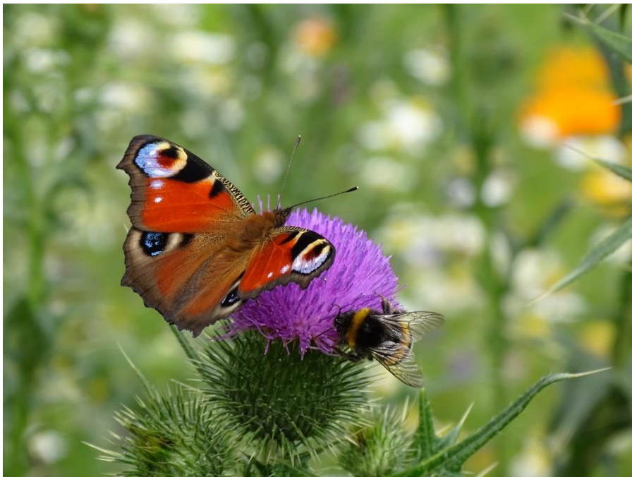
Dagpauwoog in de Kwekerij/Boomgaard