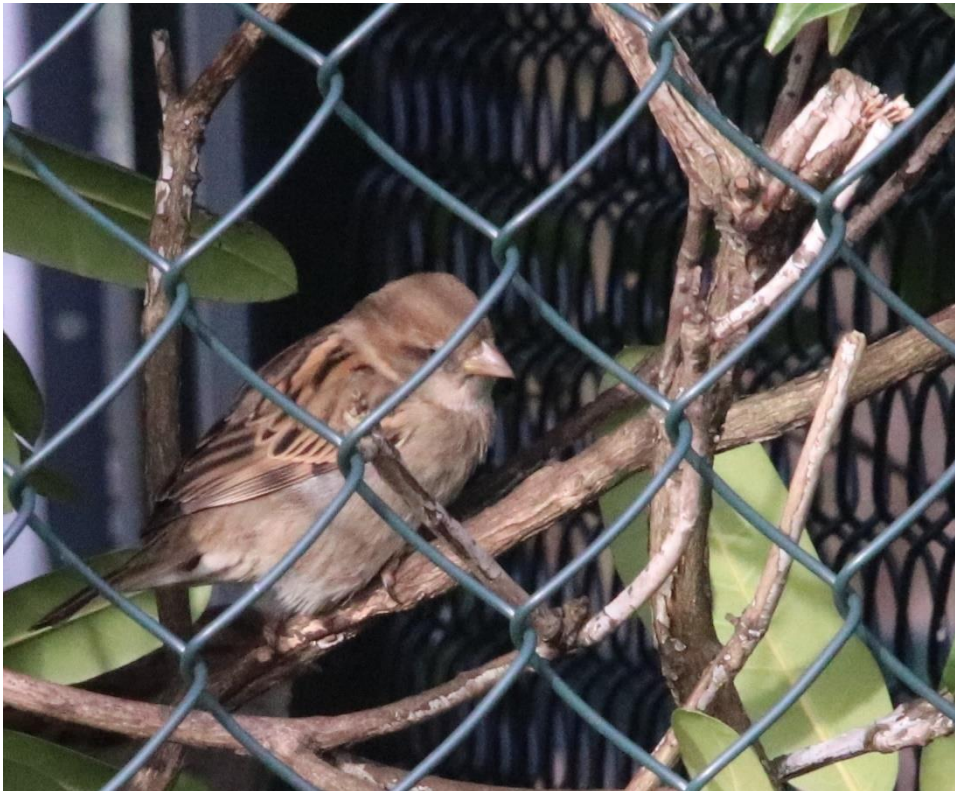
Vrouwje huismus, gefotografeerd aan de Kolonieweg in Soest.

● 2024 wordt het Jaar van de Huismus. Sovon (wetenschappelijk onderzoeksinstituut) en Vogelbescherming kiezen elk jaar een vogelsoort uit die wel wat extra aandacht kan gebruiken. De huismus is één van de bekendste en meest talrijke vogels van ons land. Omdat ze altijd met z'n allen zijn, lijkt het alsof er veel huismussen zijn. Toch zijn hun aantallen sinds de jaren zeventig gehalveerd.