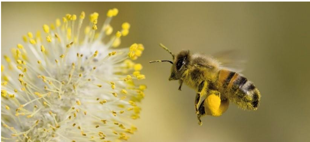
De werkster van een honingbij verzamelt het stuifmeel in twee korfjes aan haar achterpoten. Door dit stuifmeel met een beetje nectar te mengen, blijft het stuifmeel als een klein klontje in het korfje zitten. In de bijenkast wordt het door een andere werkster van haar afgenomen en in een raat gestopt.