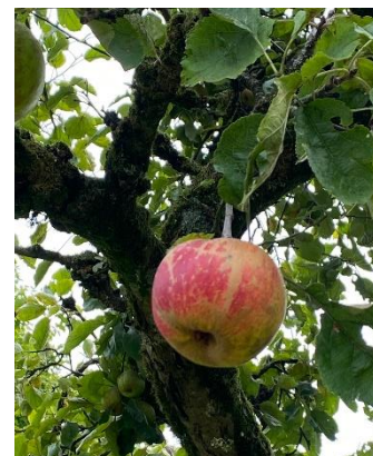
In de boomgaard.

● Let wel: de uitspraak van de Raad van State is maar liefst 100 A4'tjes groot. Daarom bespreek ik ook NIET welke vele argumenten in verband met de natuur worden afgewezen. Zo vindt de Raad van State het argument van Behoud het Borrebos en Behoud de Eemvallei, dat het plan in strijd is met de