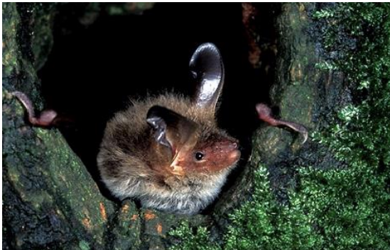
Franjestaart, een van de iconen van Paleis Soestdijk.