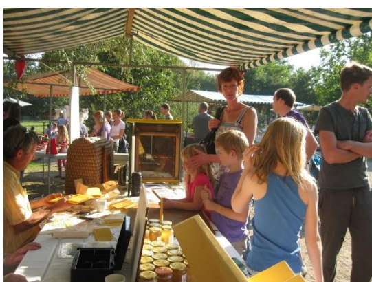
Op de Oude Ambachtenmarkt in Soest op Hemelvaartsdag wordt veel honing direct van de imker verkocht.

● Wat is sjoemelhoning? Dat is honing waar bestanddelen (meer dan 100 in honing!) zijn onttrokken óf toegevoegd om een goedkoper product te krijgen. Dat gebeurt op drie manieren. 1. Nog niet in de raat gerijpte honing wordt meteen al gebruikt en gedroogd (er zit dan nog te veel water in, normaal droogt dat in de raten) en aangelengd met goedkopere siropen met fructose. 2. Met absorptie- en filtratiemethoden worden stoffen eruit gehaald waardoor de honing niet gauw meer gaat kristalliseren of waardoor de afkomst van de honing niet meer bekend is en de kleur wordt dan ook aangepast (veel consumenten willen een lichtere kleur). 3. Bijen goedkope suiker geven en die opgeslagen suiker vervolgens oogsten , waardoor er geen stuifmeel en allerlei andere belangrijke stoffen (in zuivere honing zitten meer dan 100 stoffen!) in gevonden zijn. Het eindproduct is geen honing te noemen.