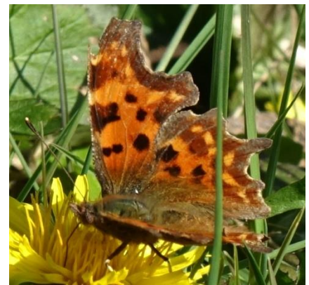
Gehakkelde aurelia zuigt nectar uit een Paardenbloem

Het is ook leuk en spannend om vast te leggen welke soorten je hebt waargenomen. Dat kun je doen door ze in te voeren op de landelijke website Waarneming.nl. Het invoeren van de soort, de plek, de tijd en dergelijke gaat eenvoudig. Wanneer je een foto hebt kunnen maken en die upload in Waarneming.nl, dan geeft de website de naam. Soms "weet" de website het ook niet en doet dan enkele voorstellen. Je kunt dan zelf puzzelen om, met behulp van zoekkaarten of boeken, de juiste naam te vinden. Ook kun je een bericht krijgen van een "validator", iemand die jouw waarneming goedkeurt of je op de juiste weg helpt.