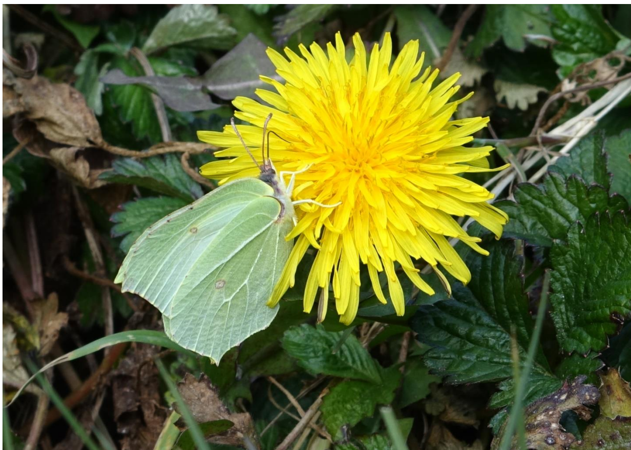
Citroenvlinder (vrouwetje) foeragerend op Paardenbloem

Dit is een ad hoc Nieuwsbericht, en verschijnt nu naast Natuurrijk. We verne- men graag jullie reactie. Dat kan naar het volgende E-mail adres: blauweflits@ivn-wo.nl