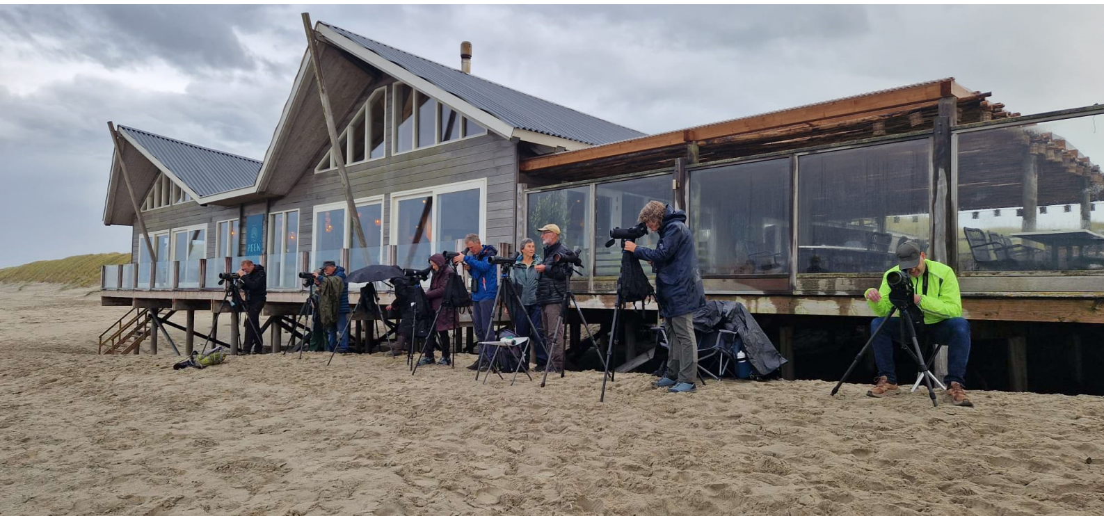
Zeevogels kijken bij Paal 15