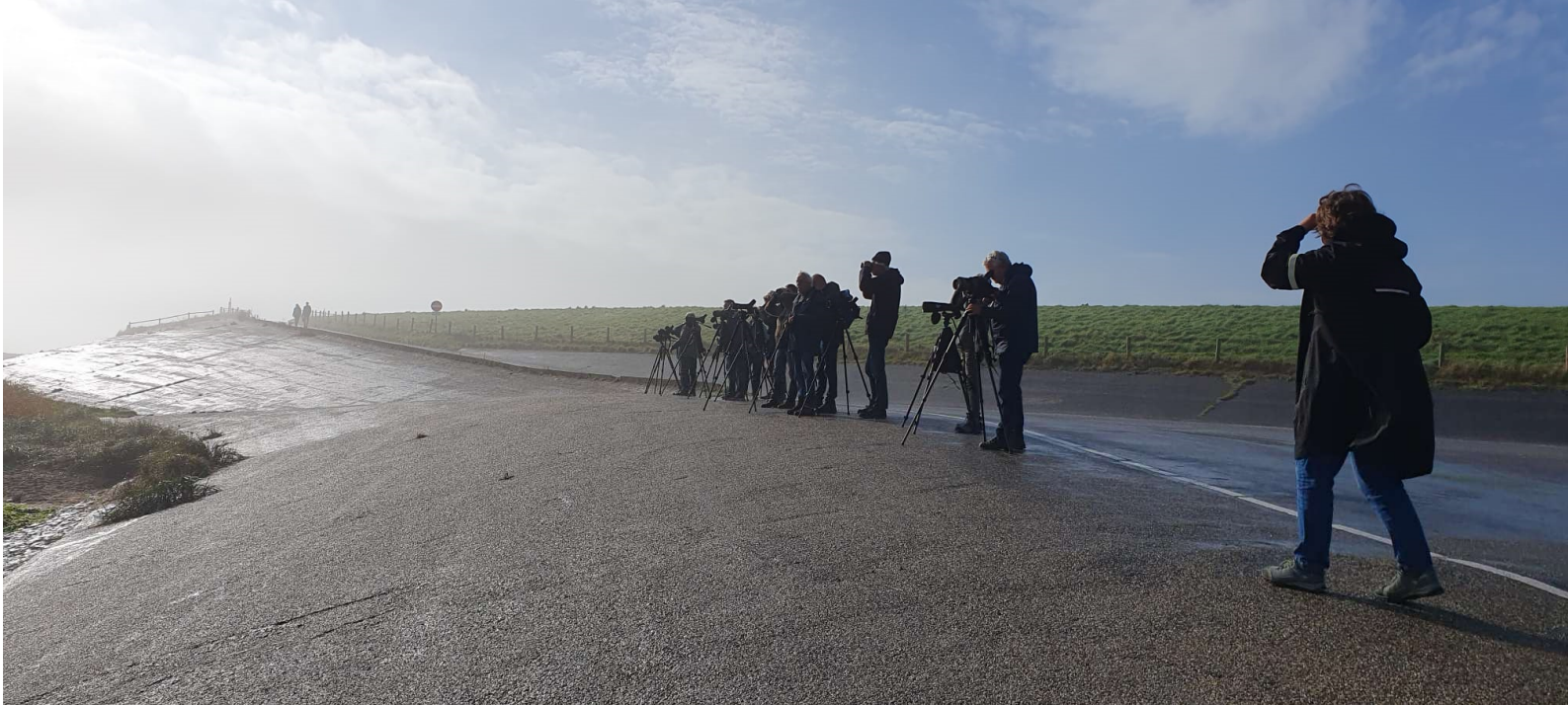
Bij de Volharding