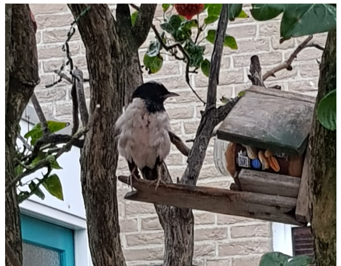
Roze spreeuw in Den Burg, foto: Jacqueline Walstra >>