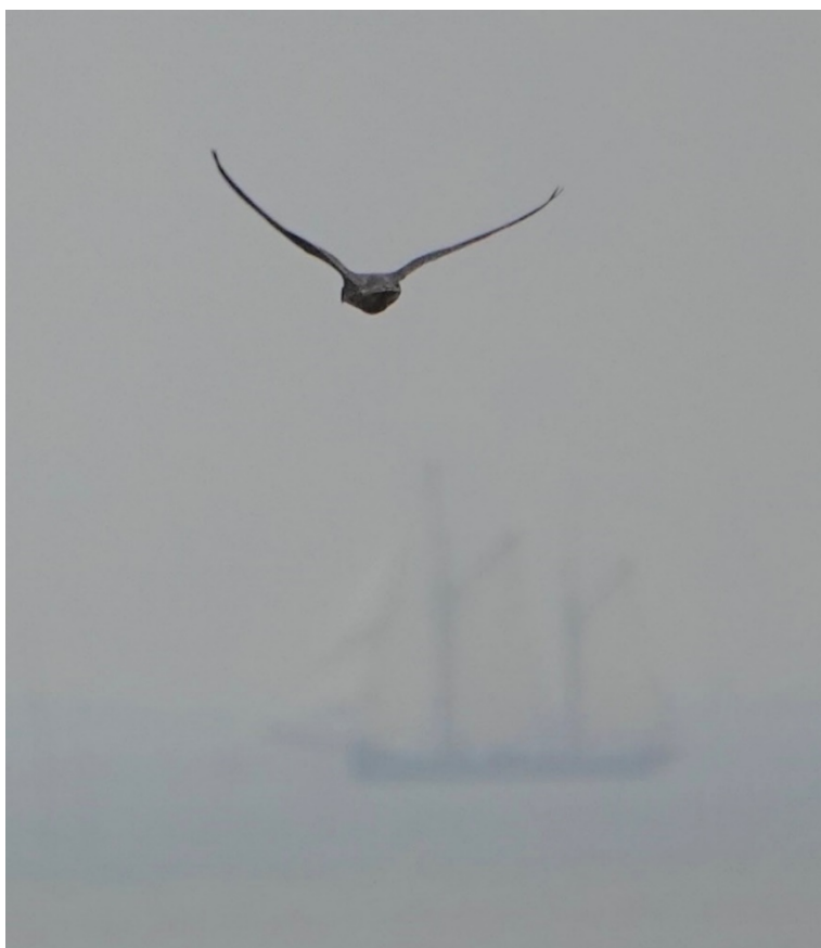
Wegvliegende slechtvalk boven mistig wad