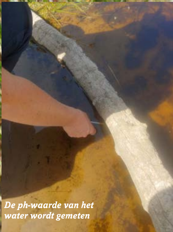
De ph-waarde van het water wordt gemeten