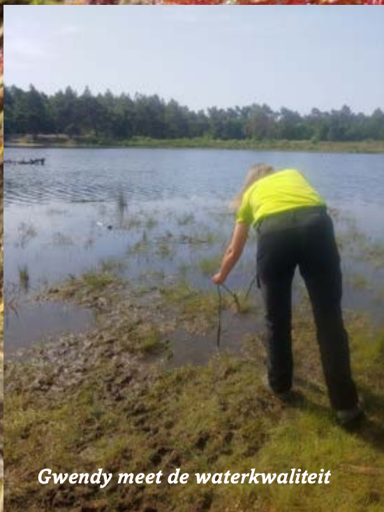
Gwendy meet de waterkwaliteit