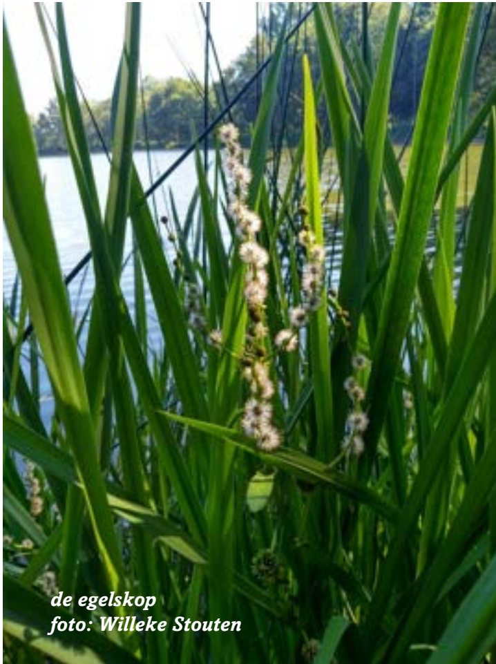
de egelskop