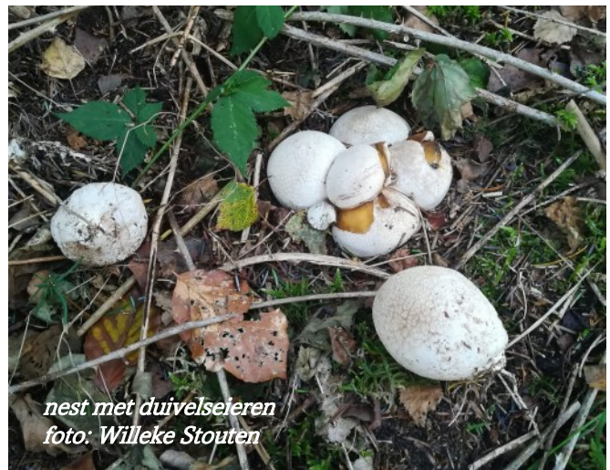
nest met duivelseieren