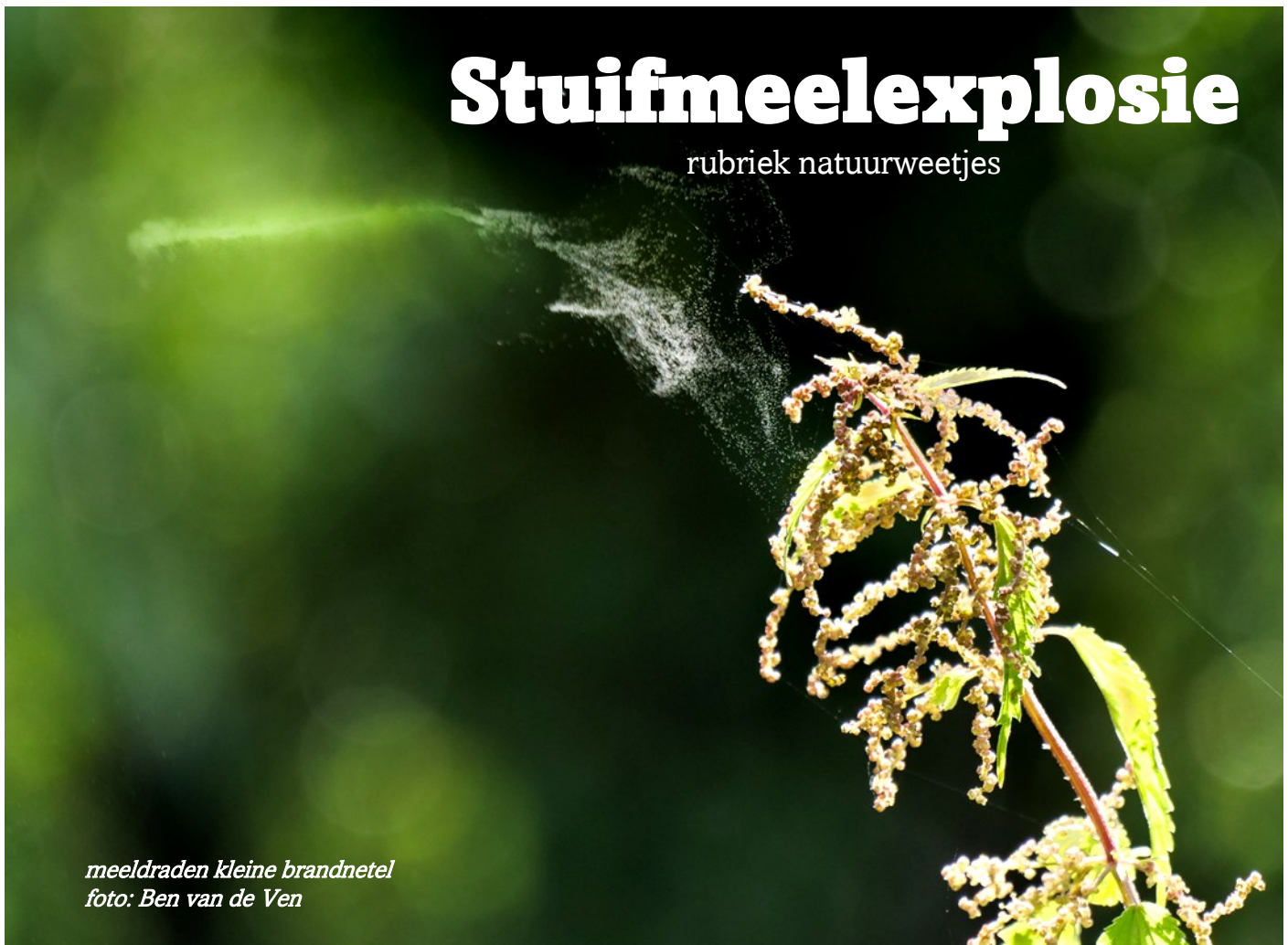
meeldraden kleine brandnetel

De grote brandnetel is tweehuizig, planten met afzonderlijke meeldraadbloemen en planten met stamperbloemen. De kleine brandnetel is echter éénuhuizig.