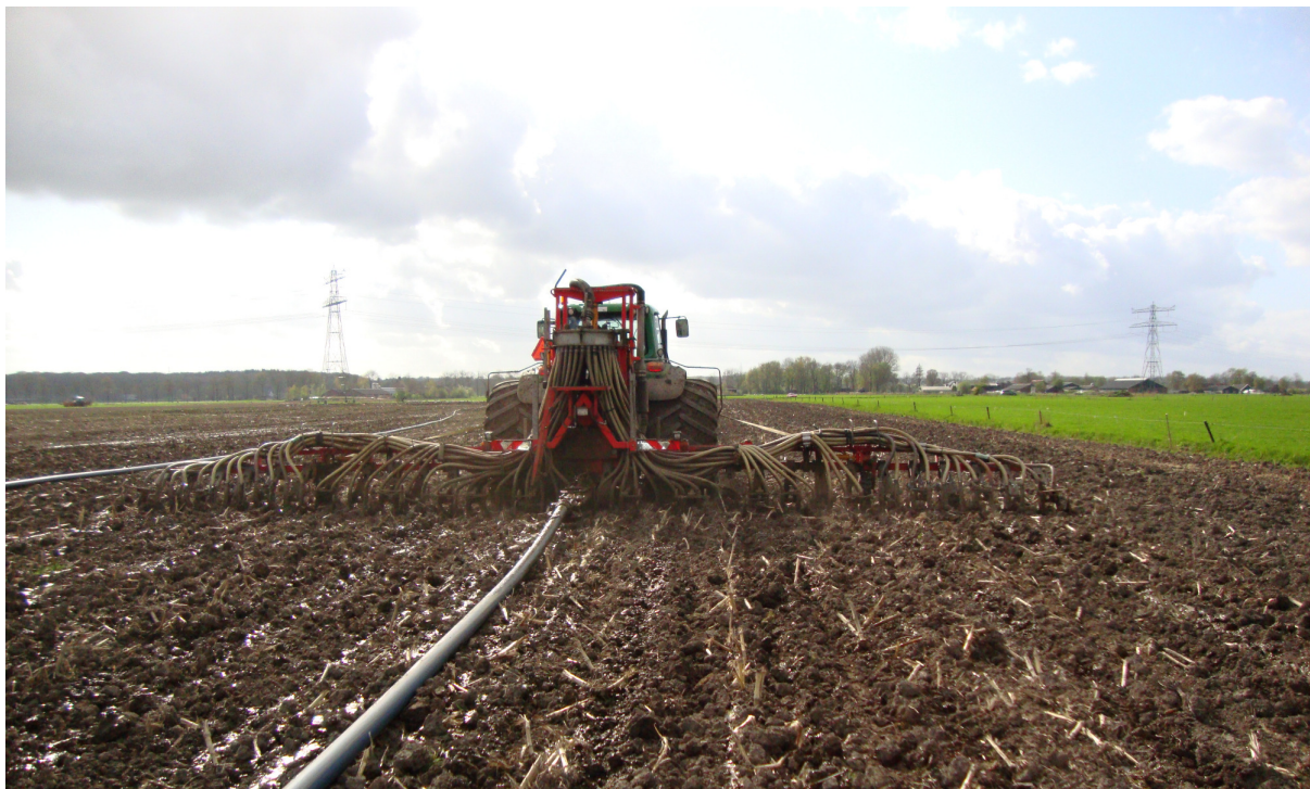
Met inzet van vrijwilligers, boer en loonbedrijf is bescherming van Kievitsnesten tijdens landwerkzaamheden mogelijk

Het doel van onze groep is om in samenwerking met de boeren, de loonbedrijven en de vrijwilligers nesten van weidevogels te beschermen. Veelal heeft de boer geen tijd of onvoldoende kennis om de nesten op te sporen. De vrijwilligers bieden de helpende hand door de nesten te markeren met bamboestokken waardoor de boer weet waar de eieren liggen en hij de nesten kan sparen tijdens de werkzaamheden op het land.