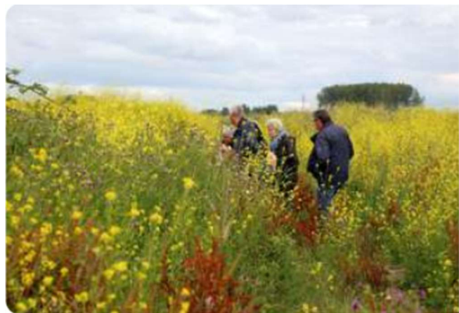
Uiterwaarden Blauwe Kamer / Plantenwerkgroep

De functie van coördinator van de werkgroep is vacant.