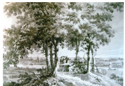
Collectie C.P. v. Eeghen, 1789

verschillen van meer dan 30 m en een afdaling door een voormalig smeltwaterdal.