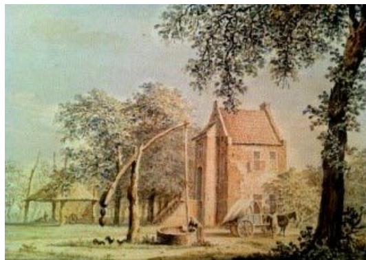
Het voormalige kasteel Prattenburg

Aan de rechterkant van het pad zie je een monument ter nagedachtenis van verzetsstrijders uit de oorlog.