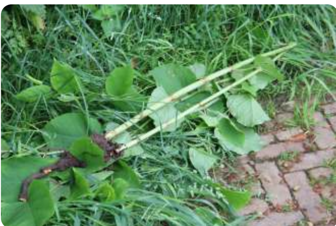
Japanse duizendknoop - ontdekt en verwijderd door één van de gidsen

https://www.wur.nl/nl/onderzoek-resultaten/themas/biodiversiteit/wageningen-biodiversity-challenge.htm