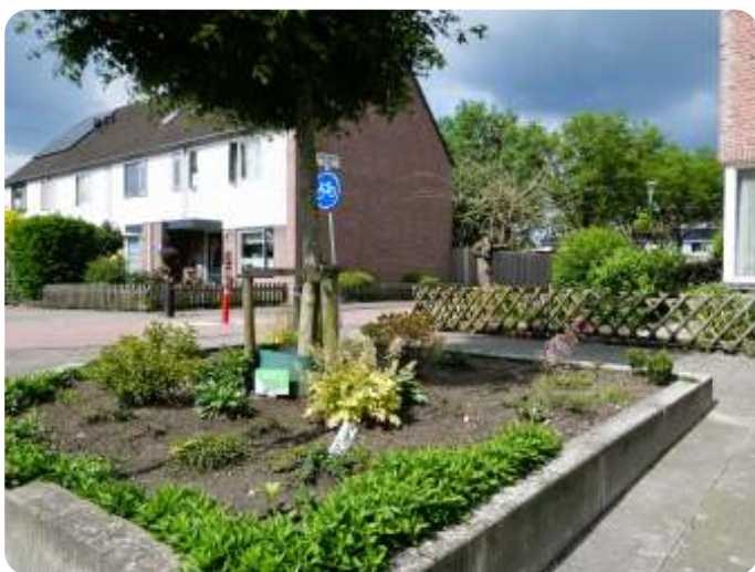
Boomspiegelperkje in Veenendaal-West

Het ene na het andere appartement wordt de grond uitgestampt en er blijft zo erg weinig over voor maar ook een snippertje groen. Maar we hebben het stadsstrand dan toch, zou je zeggen. Ja, dat klopt helemaal, maar was dat niet een idee van een inwoner van Veenendaal? Inderdaad, als het aan de gemeente had gelegen (en de projectontwikkelaars) was dat ook gewoon volgebouwd. Daar heeft de gemeente dus wel wat duiten voor over gehad, dat dan wel. Maar wat mij opvalt is dat er dus wel eerst een burger een initiatief moet nemen (en veel moed en doorzettingsvermogen) om een beetje groen voor elkaar te krijgen in ons verstedelijkt dorp. En daarom wil ik een oproep doen aan alle IVN'ers in Veenendaal en Rhenen (en omgeving): ga zelf aan de slag met het maken van meer groen in je eigen straat!