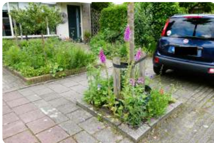
Boomspiegel - standaardformaat

Wat zou je dan bijvoorbeeld kunnen doen? In de gemeente Rhenen heeft het IVN op 24 mei al een geveltuindag georganiseerd. Kijk, dat is uiteraard een schitterende mogelijkheid om je buurt te vergroenen. Maar ook de gemeente Veenendaal biedt je de mogelijkheid om alleen of met wat buurtgenoten een stukje groen zelf in beheer te nemen. In je eentje zou je bijvoorbeeld een boomspiegel kunnen opfleuren met wat inheemse plantjes. Of samen met de burens een eentonig plantsoen aanpakken, waar vaak één soort struik in staat, en daar diverse planten inzetten die meer te bieden hebben voor insecten. Op de website van de gemeente Veenendaal kan je hierover meer informatie vinden. Je moet namelijk wel eerst je wijkmanager op de hoogte brengen. Samen met deze ambtenaar maak je dan een plan. Er komt dan ook in je nieuwe stukje natuur een bordje te staan dat dit stukje groen wordt beheerd door buurtbewoners.