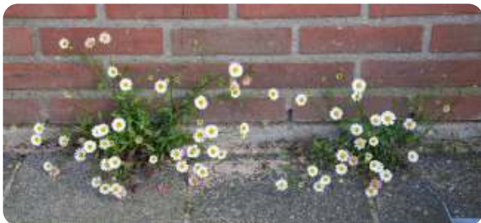
Muurfijnstraal - gevel Groenhofgebouw