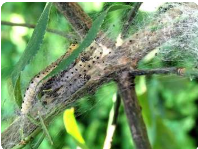
Spinsel van Kardinaalsmutsstippelmot

Uit de eitjes van de kardinaalsmutsstippelmot ( Yponomeuta cagnagella ) komen eerst kleine rupsen die in de topbladeren van de plant mineren waardoor deze verwelken. Als de rupsen groter worden proberen zij de hele plant met hun spinsel in te pakken, waarna de struik er enigszins uitziet als een nieuw kunstwerk van Christo. Binnen dit spinsel zitten zij vrij veilig voor predatoren en kunnen rustig de struik kaal eten. In mei en juni is de verpopping. Na tien tot twintig dagen komt daaruit een mot. Na afloop van dit hele proces in juni ziet de struik eruit als een universiteitsgebouw na een vreedzaam studentenprotest.