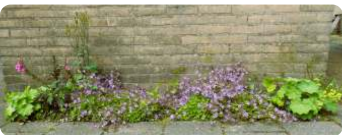
Geveltuintje - tussen stoep en carport