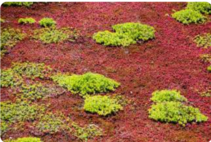
Sedumdak op appartementengebouw in hartje Rotterdam

Voor publiek is 1 juli 2023 vrijgemaakt met een infomarkt, lezingen, korte documentaires en een keur aan excursies op het campusterrein.