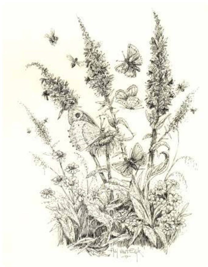
Kattenstaarten met vlinders