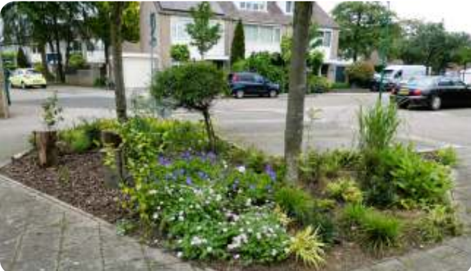
Boomspiegelperkje in Veenendaal-Dragonder