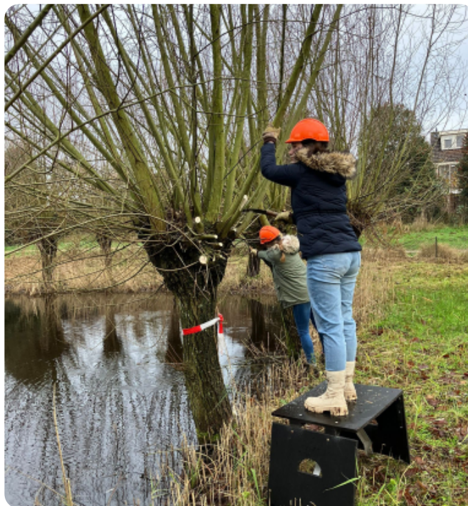
De Zwammen aan het werk bij Diddersgoed

Wat zoal nog meer te zien was zijn de grutto, buizerd, reiger, ooievaar, slobbeend, bergeend, gewone eend, meerkoet, waterhoen, nijlgans, zwaan en tureluur. Aan het einde van de excursie gingen de mensen uit Rhenen naar Rhenen en de mensen uit Veenendaal naar Veenendaal. De mensen uit Rhenen (waar ik bij was) werden onderaan de Grebbeberg getrakteerd op de zang van de nachtegaal. Zo, die was luid en duidelijk te horen.