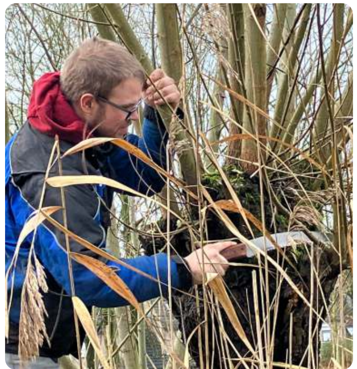
Wilgen knotten bij Diddersgoed