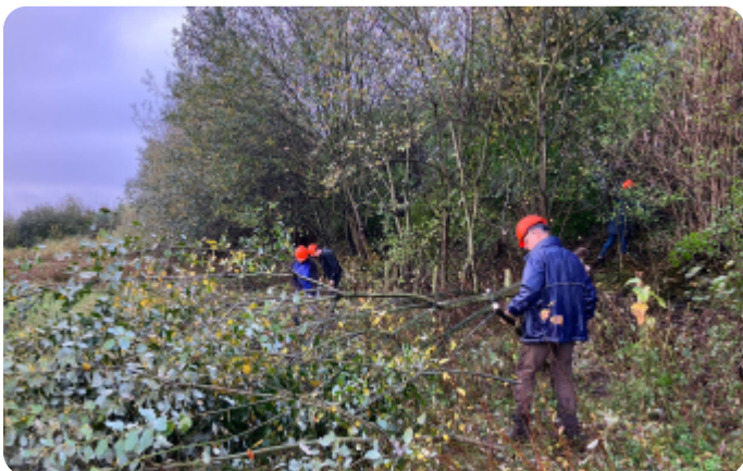
Werkzaamheden bij De Klomp

biedt aan dieren. In maart hebben we een oude houtwal onderhouden in Veenendaal. Het was aan de Zandheuvelweg naast de Scouting. We hebben Amerikaanse vogelkers weggezaagd en andere boompjes, waardoor de overige planten meer ruimte kregen om uit te groeien. De houtwal bestaat onder andere uit grote eiken en als ondergroei hulst. We hebben de eigenaar daar ook geholpen met snoeihout opruimen.