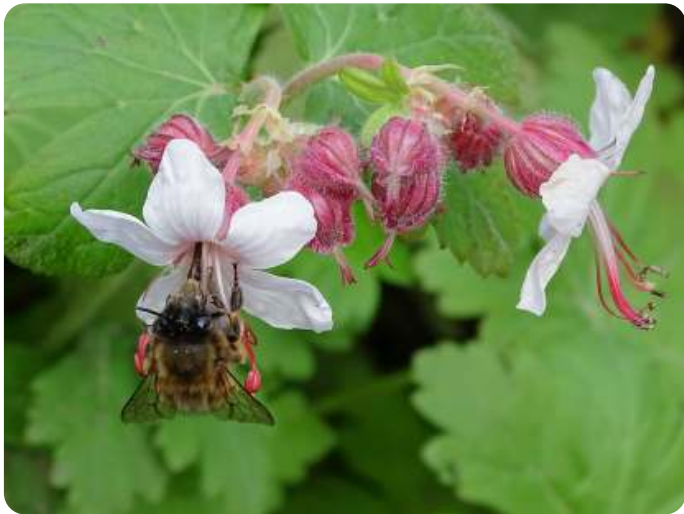
Sachembij op Rotsooievaarsbek