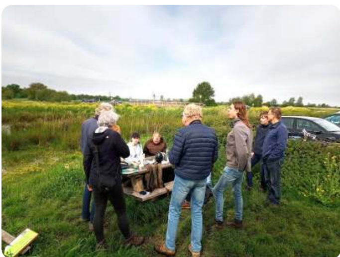
Pauze tijdens vogelexcursie Binnenveld

In mei was de afsluiting van het seizoen. Met een grote groep (niet alleen jongeren) zijn we onder begeleiding van twee leden van de Weidevogelbescherming het Binnenveld