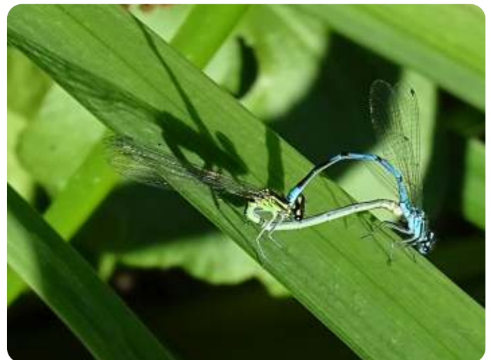
Azuurwaterjufferpaartje in tandem

De sachembij heeft iets weg van een vliegend beertje door zijn sterke beharing. Op zijn tweede paar poten heeft hij zelfs kwastjes zitten. Hij lijkt daardoor, vindt men, op een sachem, dat is de naam voor een indiaans opperhoofd, die ter onderstreping van zijn dapperheid de staarten van door hem gevangen wolven aan zijn benen bond.