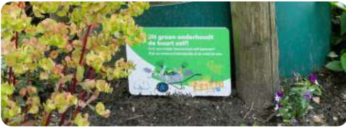
Dit groen onderhoudt de buurt zelf!