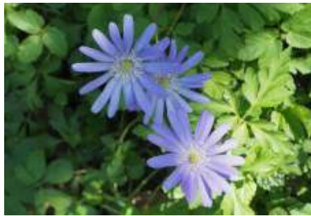
Lente komt.

Op paasmaandag 1 april organiseren we weer de Stinsenplantendag in Thijsses Hof. Vanaf 11:00 uur mag je meelopen met een excursie en genieten van de kleurrijke pracht van de voorjaarsbloeiers. Voor kinderen zijn speurtochten uitgezet maar zij kunnen ook hun eigen bolletjes planten en inpakken om mee naar huis te nemen. Onze meesterverteller Piet Paree is er ook weer met zijn boeiende verhalen voor groot en klein. Binnen zijn er presentaties en een tentoonstelling over stinse-wetenswaardigheden. Thijsses Hof verkoopt planten en boeken en kwekerij Haarlems Klokkenpel staat er alweer voor de derde keer met hun bolgewas. IVN Zuid-Kennemerland en Thijsses Hof heten u van harte welkom. Koffie en thee staan voor u klaar.