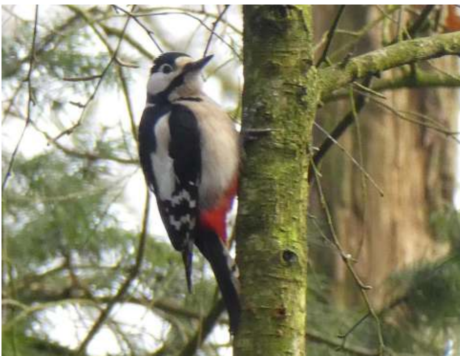
Op zoek naar lekkers.

Auteur Cisca Klarenberg