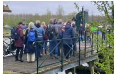
Deelnemers Munitiebos.

Inmiddels is het alweer de 5e keer dat de Kennemer Vogeldag plaatsvindt. Een lustrium! Rondom en in het Fort Benoorden Spaarndam is er van alles te beleven voor alle leeftijden, bijvoorbeeld: waarom worden vogels geringd en hoe doen ze dat eigenlijk? Hoe herken je vogels als de kluut en de grutto en waarom roepen ze hun eigen naam? Welk verhaal vertelt een braakbal?