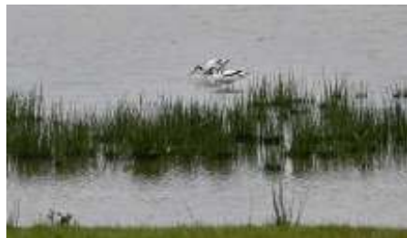
Sierlijke vogels.