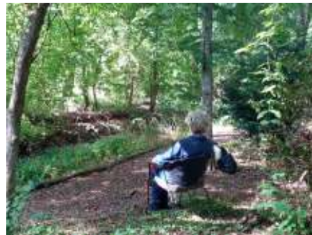
Ontspannen in de natuur.