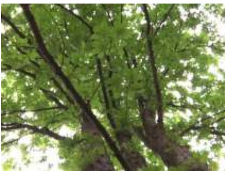
Rustgevend groen.