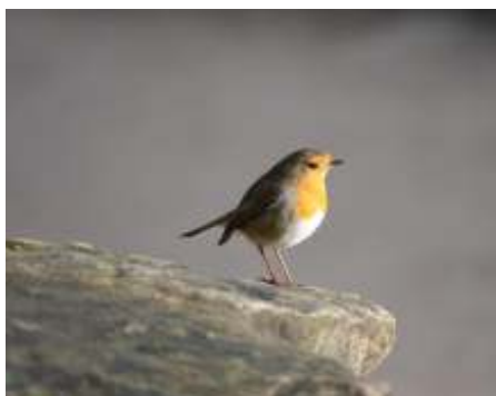
Makkelijk te herkennen.

Wat ook helpt is het zelf bedenken van ezelsbruggetjes om bepaalde vogel-