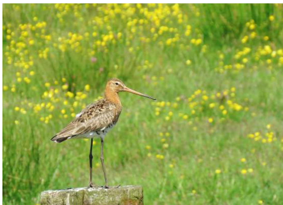
Nagenoeg verdwenen weidevogel.

zang te onthouden. Zo lijkt de zang van een koolmees op een fietspomp, zingt de tjiftjaf zijn eigen naam en lijkt het geluid van de heggenmus op een piepende snijboonmolen. Niet zo zeer het leren, maar vooral het genieten staat voorop bij de cursus. Het geeft een geluksgevoel als je een vogel aan zijn zang herkent, vertelt Johan.