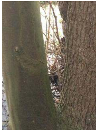
Verschillend in schors.