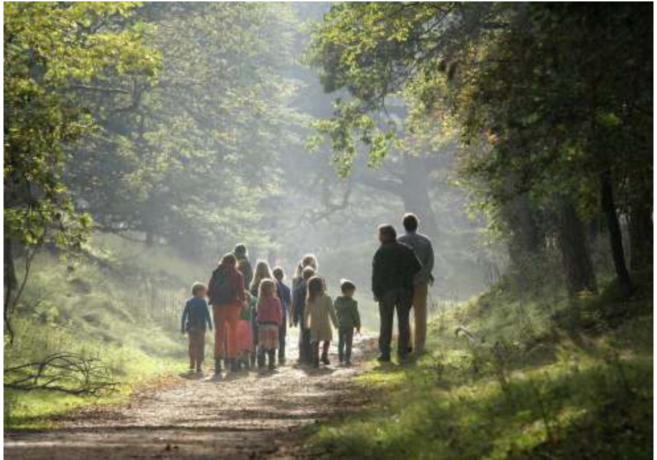
Struinen door de natuur.

Later vang ik een kleine pad in het potje, hij is zo leuk dat ik hem wel mee naar huis wil nemen. Het padje moeten we laten waar hij gevonden is, bij zijn vriendjes. Opeens staan we oog in oog met een damhert. Hij is donkerbruin en heeft een groot gewei en rent weg het duin in.