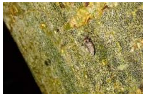
Moeilijk te vinden vrouwtje.

Met tientallen tegelijk zitten de eenzame mannetjes op de stammen. De vleugels van anderhalve centimeter vallen op in het lamplicht. Vrouwtjes zijn er veel minder en zijn moeilijk te vinden. Ze hebben geen vleugels, alleen minieme stompjes. De kleine wintervlinder verpopt in de grond. De vrouwtjes kruipen uit de pop langs boomstammen omhoog en hopen door een mannetje te worden opgemerkt. Na de paring gaan de vrouwtjes op weg naar de twijgen hoog in de kroon om eitjes af te zetten. In het voorjaar als de knoppen uitlopen, kunnen de jonge rupsjes dan direct aan hun maaltijd beginnen. De kleine wintervlinder eet niet maar heeft genoeg aan de reserves die in het rupsenstadium zijn aangemaakt. Een bijzonder diertje, waarneembaar in de donkere maanden met een zaklampje.