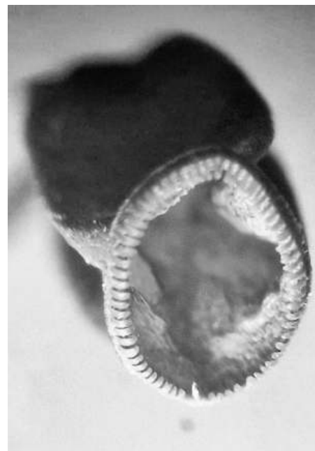
Close-up fraai haarmos.

Auteur en fotograaf Marja van der Heiden