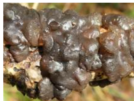
Zwarte trilzwam Koningshof.