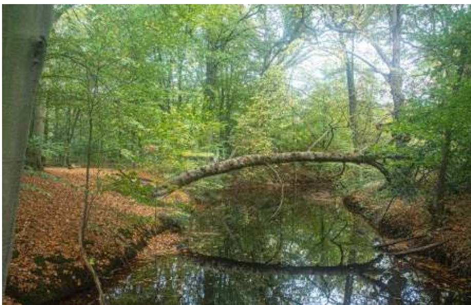
Ontspannen in het bos.

In Japan is Shinrin Yoku een populaire therapie tegen stress, futloosheid en andere kwalen. Er wordt daar ook veel onderzoek gedaan naar de effecten van de natuur op de gezondheid. Daaruit blijkt dat de natuur helpt verwonderen en ontspannen, maar ook dat zij onze fysieke, mentale en emotionele welzijn vergroot. Je versterkt met een bosbad je immuunsysteem.