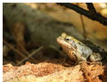
Bruine kikker Koningshof.