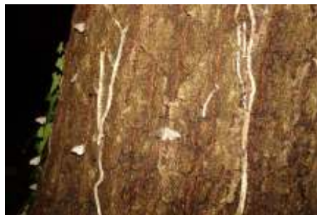
Mannetjes wachten op vrouwtjes.