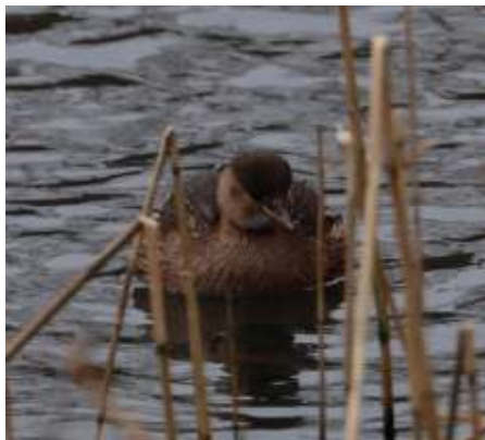
Kleinste van de futen.