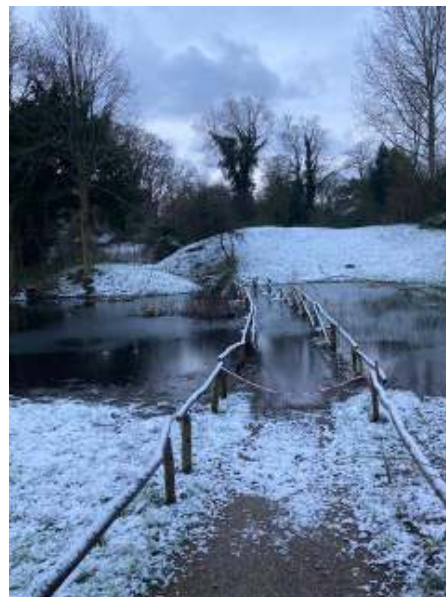
Winters Thijssen's Hof.

In 1960 wordt het Instituut voor Natuureducatie opgericht, dat is voortgekomen uit de Bond tegen Verontreiniging van natuur en stad (1939). Deze bond wilde door de inzet van nachtwakers ongewenst gedrag van bezoekers in de natuur corrigeren.