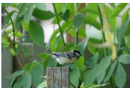
Kenmerkend riedeltje.