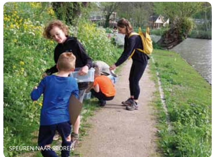
SPEUREN NAAR SPOREN