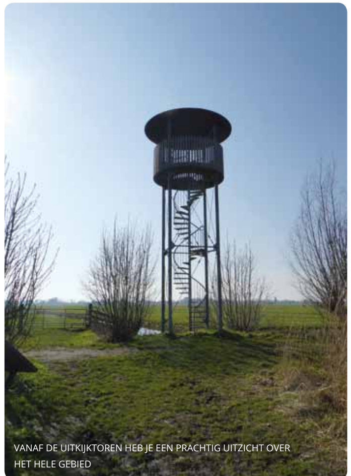
VANAF DE UITKIJKTOREN HEB JE EEN PRACHTIG UITZICHT OVER HET HELE GEBIED