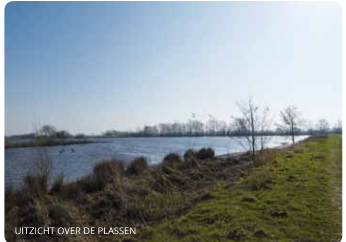
UITZICHT OVER DE Plassen

De route begint bij Blokland en is ruim 6 km. lang. Doen dus! Trek je schoenen aan en ga aan de wandel! Wij, van het IVN Natuur App team, wensen jullie veel wandelplezier.