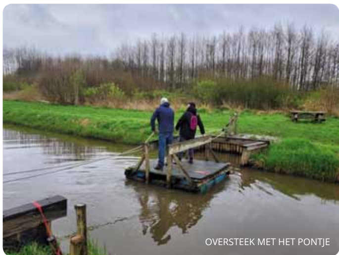
OVERSTEEK MET HET PONTJE

We lopen eerst een rondje door het bos van Nieuw Wulven; hier en daar nogal modderig. Sommigen nemen een pontje, maar je kunt er ook omheen lopen.