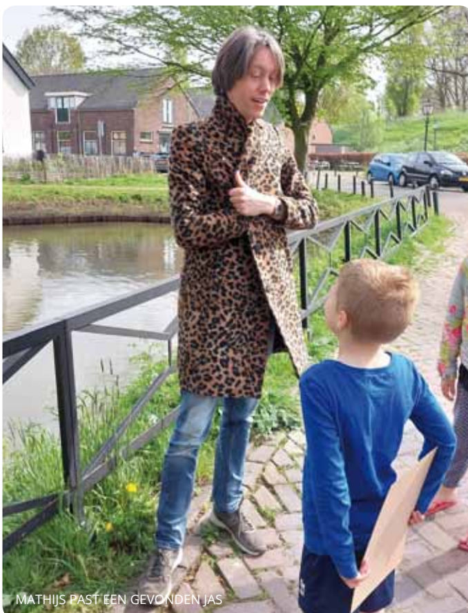
MATHIJS PAST EEN GEVONDEN JAS

Op een lijstje konden ze aantekenen wat ze allemaal gevonden hadden. En dat was heel wat: poep van vogels, hond en wormen, diverse veren, slakkenlijm, spinnenwebben, gaatjes in wilgenhout en in bladeren. De mooie vondsten werden in bakjes verzameld.