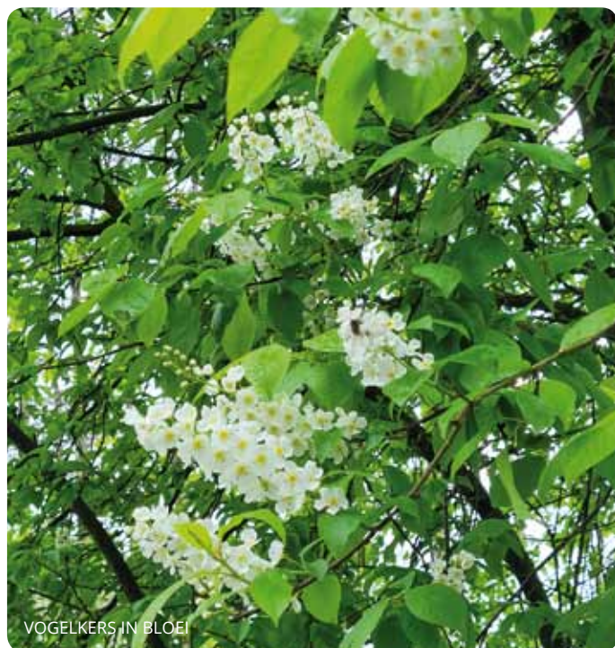
VOGELKERS IN BLOEI

We zien veel bloeiende planten en horen voortdurend zingende vogels om ons heen. Bij het geluid van zanglijsters, tjiptjaf en de zwartkop, zien we fluitekruid, witte dovenetel, nog wat speenkruid en vogelkers in bloei.