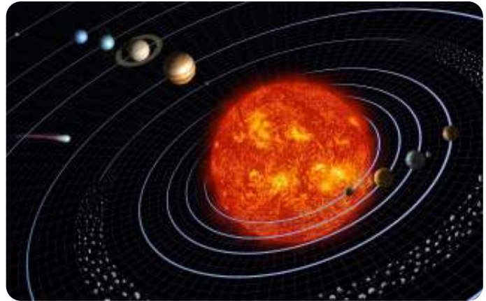
Onze ster (zon) en planeten