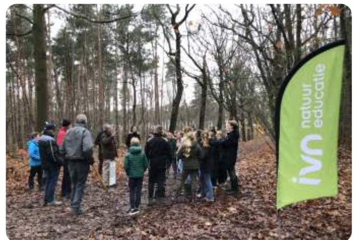
Jack van Nunen vertelt over de waarde van bomen

Met een tevreden gevoel keerden de kinderen terug naar school, in de hoop om in de toekomst terug te komen en te zien hoe 'hun bos' tot bloei is gekomen.