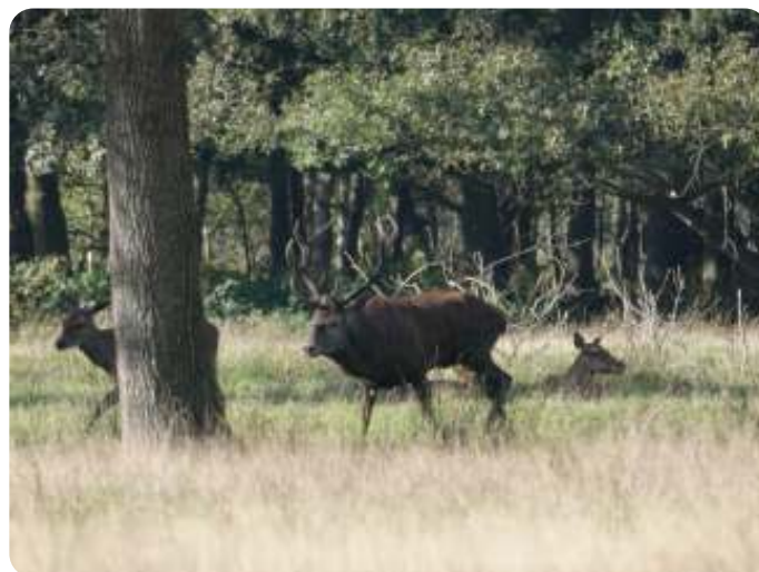
Edelherten in de Mortelen

In conclusie toont het werk van George Monbiot en de praktische uitvoering door ARK aan dat 'verwildering' niet alleen een filosofie is, maar een bewezen benadering voor het herstellen van ecosystemen en het creëren van een veerkrachtige relatie tussen mens en natuur. Het is een dans met de natuur, waarbij de mens niet de regisseur is, maar slechts een medespeler in dit prachtige ecosysteem.