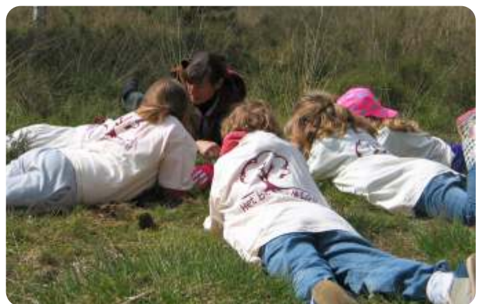
Het Bewaarde Land. Kinderen met Wachter op de grond.