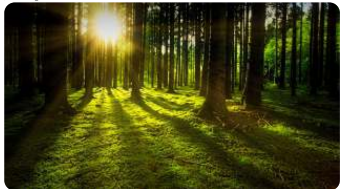
Onze ster (de zon), bron van leven