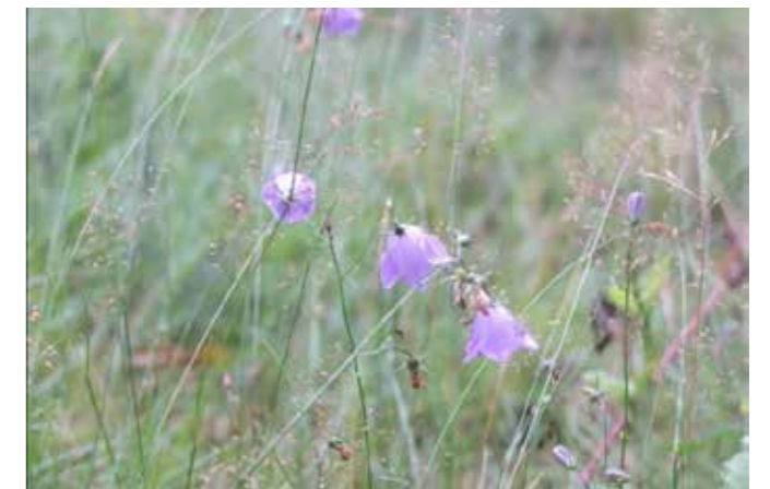
Bochtige smele en grasklokje

Wanneer de bodem op den duur enigszins is verrijkt, zien we meer grassen en grasachtige planten, zoals fijn schapengras, zandzegge en gewone veldbies. Kenmerkend is het grasklokje, met daarbij soorten als kleine tijm, gewoon biggenkruid en geel walstro. Voor de floristen onder ons: duizendblad, muizenoor, smalle weegbree, schapenzuring en struikheide geven aan dat de successie verder gaat.