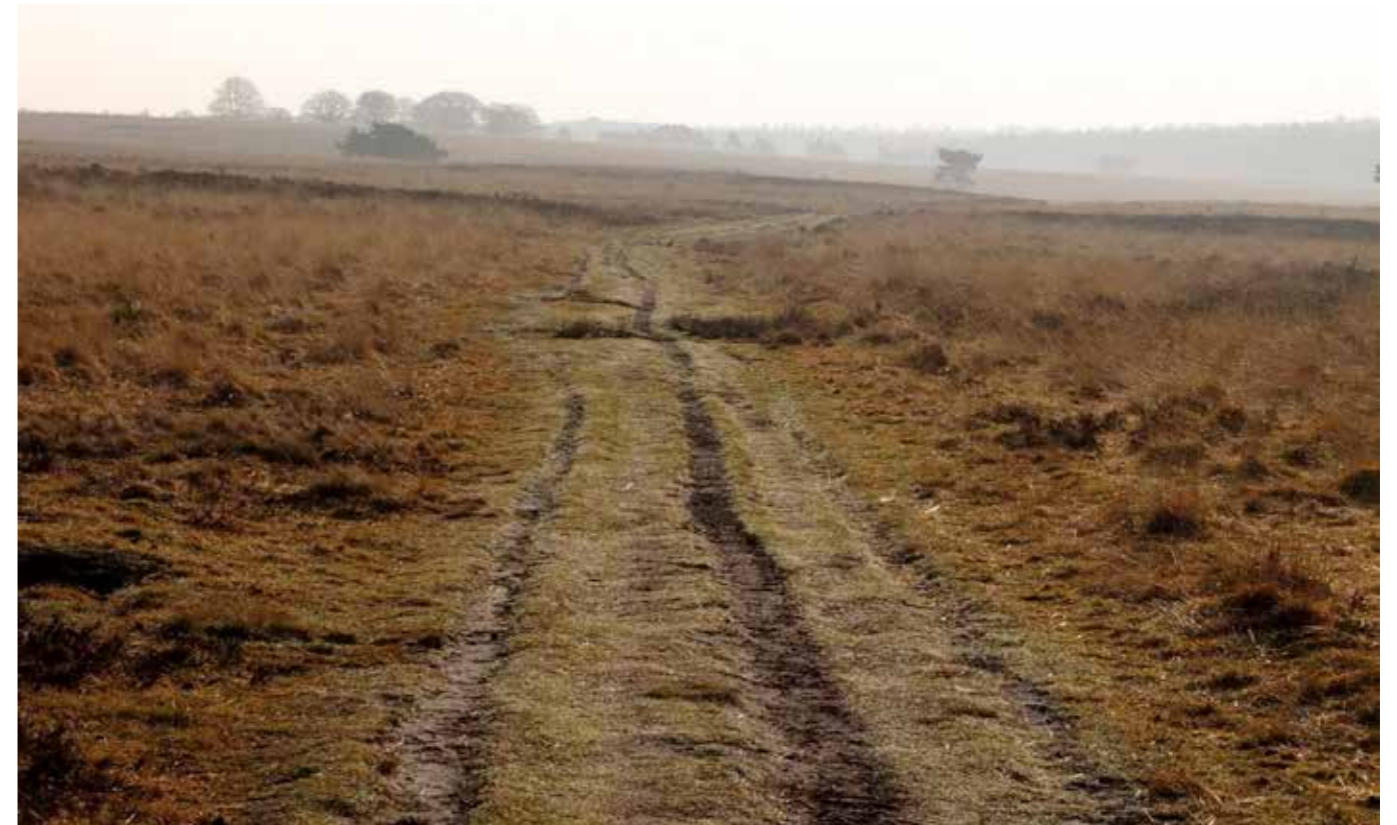
Rozendaalse Veld, het einde van de wereld

Het Rozendaalse Veld is de laatste jaren in het nieuws omdat de Provincie het gebied buiten wegen en paden wil afsluiten en honden uitsluitend aangelijnd nog wil toelaten. Dit leidde tot protesten van mensen uit de omgeving die menen dat hen zo "hun heide" wordt ontnomen. Het gebruik van de grote stille heide door voorstanders van vrije uitloop en hun geliefde viervoeters leidt echter onverwijld tot het einde van dit kwetsbare gebied, dat zal verworden tot iets wat nog het meest weg heeft van een tankbaan. Dat kan een keuze zijn, maar deze dient dan wel bewust gemaakt te worden. Ter illustratie raden we aan om het Rozendaalse Veld nabij de parkeerplaats eens uit de lucht, via Google Earth, te vergelijken met de Zilvense Heide, nabij Terlet.