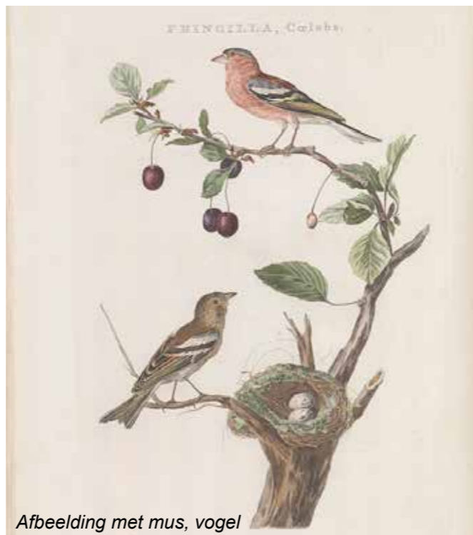
Afbeelding met mus, vogel

Over de vink wordt verteld dat hij vroeger blind werd gemaakt omdat hij dan 'mooier zou zingen'. De winterkoning met zijn tien gram gewicht kan in de winter wel met 60 soortgenoten bij elkaar zitten om warm te blijven. Dan is de klok aan de muur van de Klapproos onverbiddeijk: de boeiende en leerzame lezing eindigt met de uitnodiging voor de veldexcursie.