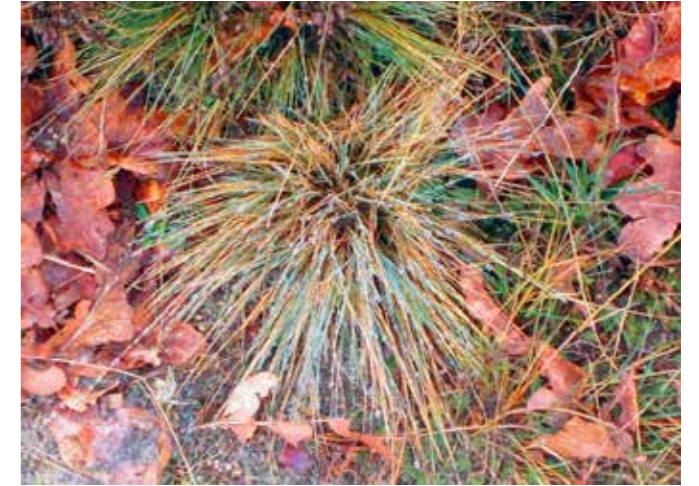
Buntgras tussen eikenblad en sterretjesmos

de meest voorkomende plantengemeenschap op zandverstuivingen. Het is een typische pioniersgemeenschap van dit open droge gebied. We vinden er veel blad- en korstmossen, aangevuld met eenjarige als heidespurrie en buntgras.