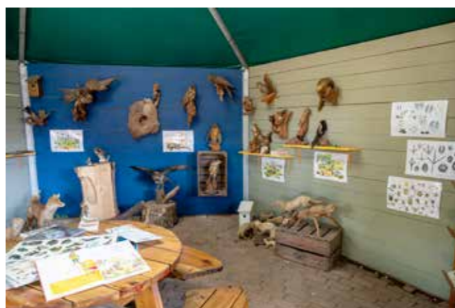
Natuurhut, wandeling badhuis en sprengen

achtergronden over de dieren. Verder zijn bij de dieren opdrachten gemaakt voor kinderen vanaf 8 jaar en vanaf 12 jaar. Ook is de collectie uitgebreid met kleine insectenpotjes