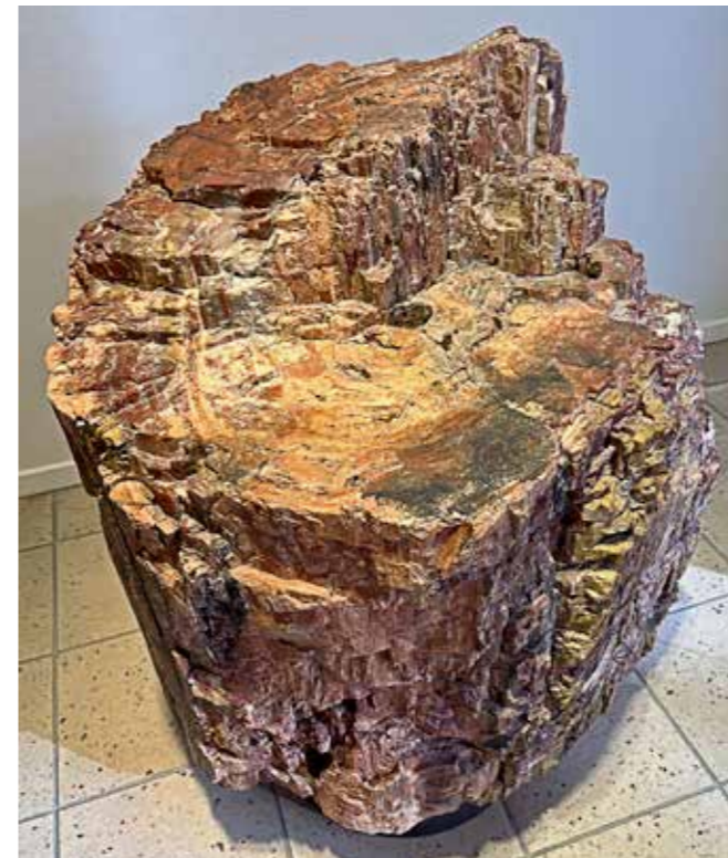
Versteend hout (opgesteld in Antoni van Leeuwenhoek Ziekenhuis, A'msterdam

Soms valt er onverwacht iets nieuws te ontdekken. Laatst kwam ik een interessant verhaal tegen over versteend hout. Een bijzonder fenomeen, net als zoveel verschijnselen in de natuur. Hout dat onder speciale omstandigheden in steen, ofwel mineralen kan veranderen: daar had ik geen weet van. Bij de informatie stond een tastbaar, versteend deel van een boomstam met allerlei kleuren.