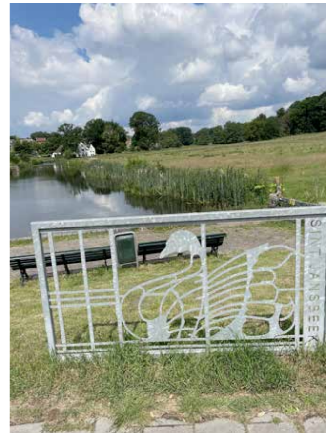
Weide Sonsbeek, Sint Jansbeek