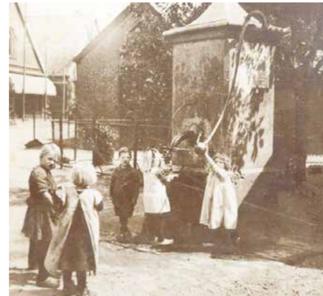
Pomp op kruising Groenestraat-Veerweg

Ook de eerste levensbehoefte van schoon drink- of badwater was geen vanzelfsprekendheid. Rheden, Velp, Ellecom, Dieren en Spankeren lagen niet voor niets aan de IJssel. Deze rivier was niet alleen belangrijk voor het transport van mensen en goederen, maar voorzorg eeuwenlang mens en dier van redelijk zuiver drinkwater. Toen er nog geen waterleidingsysteem was dat het drinkwater tot in huis bracht, moest men het doen met een regenwaterput op het erf of zwengelpomp in de keuken. Het dorp Rheden had bijvoorbeeld twee openbare waterpompen, één bij de dorpskerk - die nog steeds aanwezig is - en één op de hoek Groenestraat-Veerweg.