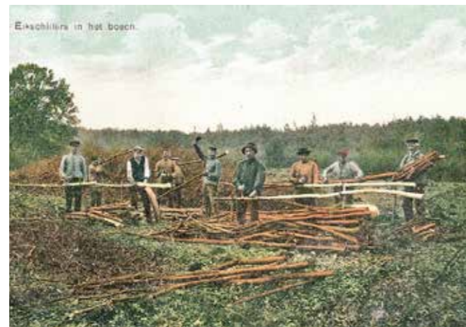
Eekschillers in het bosch bij De Steeg ca. 1905

Bij overlevering is het bekend dat een boer uit de Groenestraat in Rheden met een kruiwagen naar de Onzalige Bossen reed om daar enige oude eikenstompen te halen. Hij moest die eerst zelf uitgraven, een paar stuks op de kruiwagen laden en er mee terug naar Rheden rijden, om ze thuis tot brandhout te verwerken. Volgens zijn zeggen moest hij daar dan ook nog 25 cent per stomp voor betalen. Tijdens zijn tocht naar huis kwam hij langs een groep eekschillers die in een hakhoutbos jonge eiken aan het omzagen waren, de bast eraf klopten om er later in een runmolen looizuur van te kunnen maken. Dit zogenaamde talhout werd in vaste maten kort gezaagd en gebundeld voor de verkoop aan huishoudens of aan de bakkers die grote hoeveelheden nodig hadden om hun ovens te kunnen stoken.