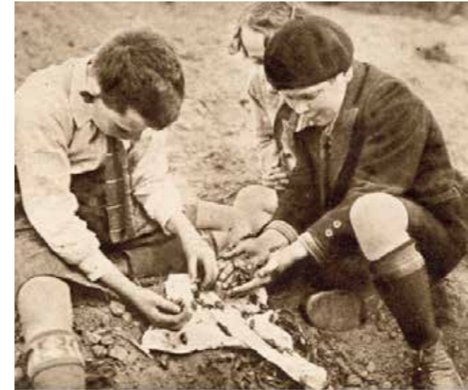
Vangen en verdrinken van meikevers 1926

schade te bestrijden. De jeugd werd bijvoorbeeld ingezet om zoveel mogelijk meikevers te vangen, die dan in een jute zak gedaan werden om te verdrinken in een sloot, zodat ze opgevoerd konden worden aan de varkens als welkome bron van eiwitten.