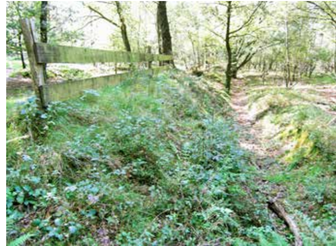
Wildwal met greppel en hek haaks op Snippendaalseweg 2004

ontstane dijk werden palen ingegraven en betimmerd met planken. Zo ontstond er een hoogteverschil dat door het wild niet gepasseerd kon worden. In de markenovereenkomsten werd meestal streng geregeld hoe en door wie deze wildkeringen onderhouden moesten worden.