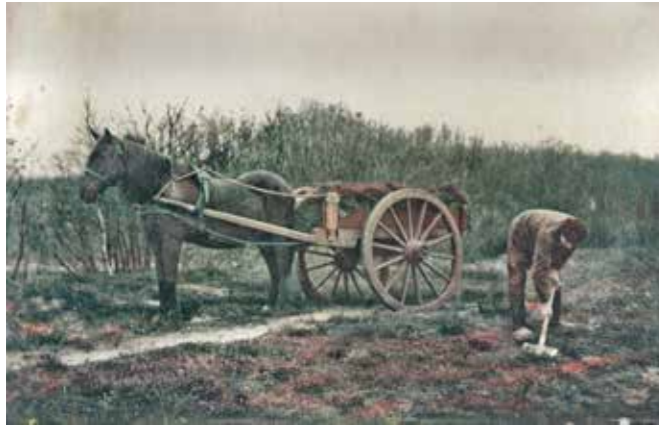
Plaggen steken op de heide ca. 1910

Zelfs op de beste lössgrond van de Zuid-Veluwe had je bemesting nodig. De geplagde zoden van de heide werden uitgespreid op de vloer van de potstal. Deze met poep en urine van de schapen verzadigde mest werd voor het groeiseizoen op de akker gebracht. Het grootste deel van de boerenarbeid moest dan ook benut worden voor het plaggen op de hei, het naar huis brengen van het plagmateriaal, het uitstrooien in de potstal, en uiteindelijk het brengen naar het bouwland en het onderwerken van de mest.