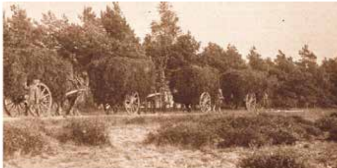
Karren met hei op de Zijpenberg in 1927

Meestal werden de schapen of geiten opgehaald door de gemeenschappelijke herder die met een grote kudde dieren de hei opging en ze 's avonds weer thuisbracht. De heide werd te intensief gebruikt. Van de oudere heidestruiken werden heidebezems gemaakt of dakdek materiaal. De jonge hei werd gemaaid voor veevoer. Zwaardere heidestruiken werden gemaaid en afgevoerd als strooisel in de potstal.