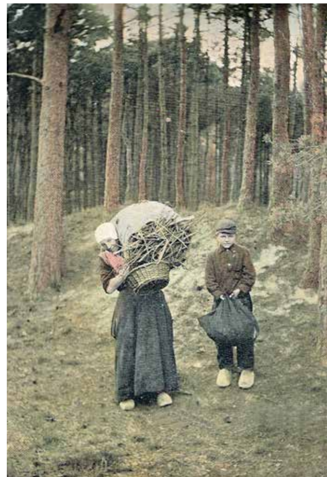
Kleine sprokkelaars op de Veluwe ca. 1910

De gewoonste zaak van de wereld - even hout halen om te koken en de kachel aan te houden. Het klinkt zo eenvoudig, maar dat was het vroeger echt niet. De kinderen moesten vanuit het dorp lopen naar het bos op Heuven, het dichtste bij het dorp Rheden, of naar Beekhuizen of naar Rhederoord. In vele gevallen had men toestemming nodig van de terreineigenaren. Het bos was geen vrij gebied