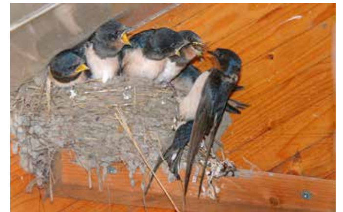
Boerenzwaluwen op het nest

Voor ons als jongens was het elk jaar opnieuw spannend wanneer er voor het eerst weer een