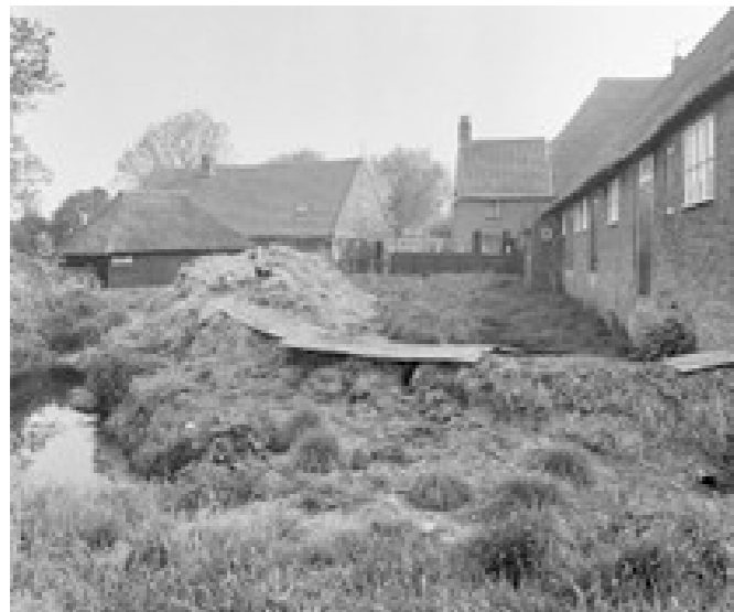
Mestvaalt bij de stal

Er zijn gelukkig toch nog kansen. Vertaald naar deze tijd: we willen graag wonen in huizen die niet tochten, met tuintjes die geen onderhoud vergen en waar het nooit donker wordt, want o, er mocht eens een inbreker ... Maar wat, als we vleermuizen en gierzwaluwen liefhebben in onze buurt? Zolang ze er zijn, is alles goed. Wat zijn hun kansen als je je tuin verhardt en verlicht in de nacht, wanneer de spouwmuren zijn geïsoleerd, de kieren verholpen en lapmiddelen als nestkast en broedsteen zijn aangebracht? Kunnen de vleermuizen en gierzwaluwen daar ook mee leven?