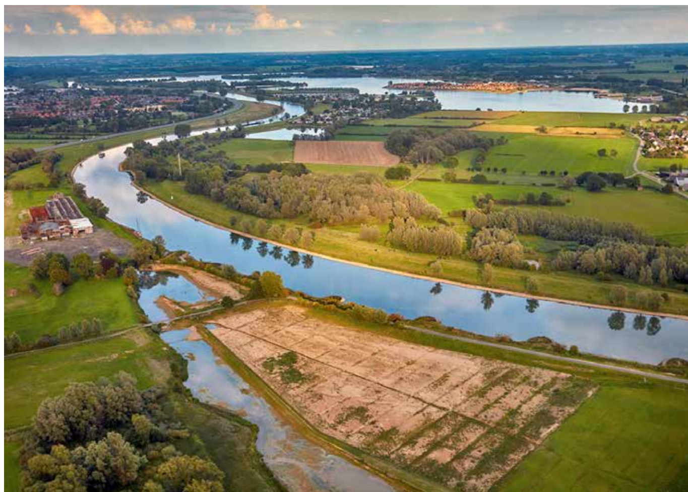
IJssel met zicht op Rhederlaag