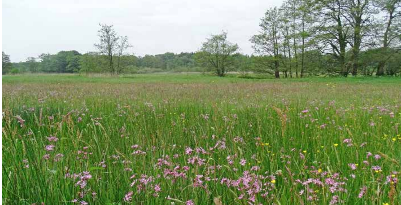
Hazematen met volop echte koekoeksbloem

Stel je voor, je stapt in een brede rivier en langzaam zwem je naar het midden. Totdat je opeens bemerkt dat de oever niet meer zichtbaar is. Hoe snel stroomt het water nu? En hoe weet je dat?