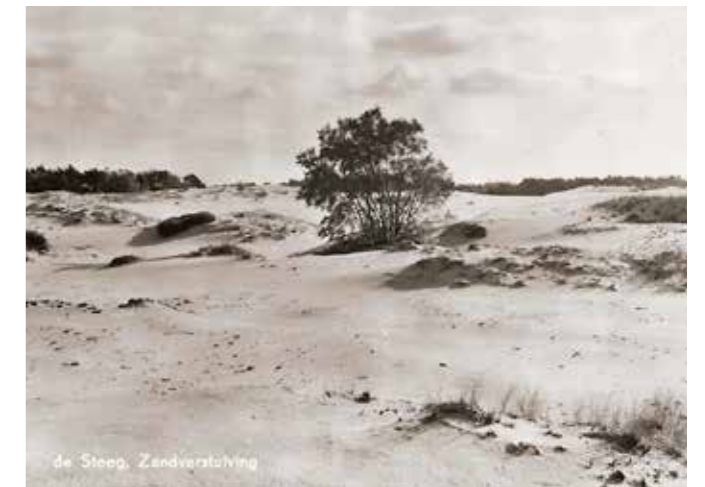
Zandverstuiving bij De Steeg in 1953

Na het verwoestende tijdperk, waarbij de mens het grootste deel van de natuurlijke bronnen opgebruikt had, werden marken en maalschappen opgericht die vaak strenge 'wetten' en regels opstelden om verdere achteruitgang van bos en hei tegen te gaan. Het bos was in onze streken nagenoeg verdwenen, behalve op die plaatsen waar kasteel en park in stand gehouden werden.