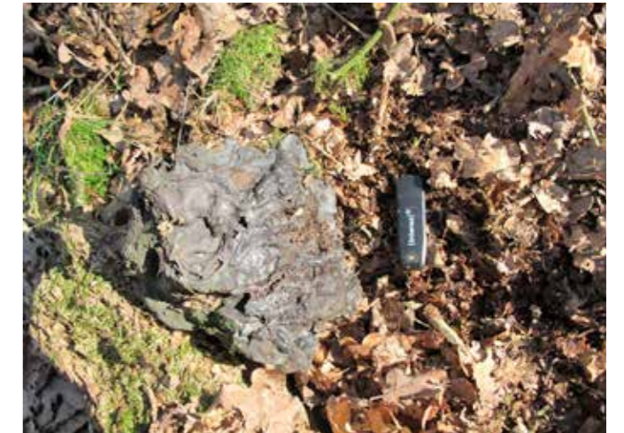
IJzerslakken in de ijzerbaan

maar ook in de Achterhoek op diverse plaatsen gedolven. Men had het houtskool nodig om in de primitieve veldovens voldoende hitte te bereiken om deze klapperstenen te versmelten tot vloeibaar ijzer. Overal in ons gebied komen we toponiemen tegen die nog verwijzen naar deze oude ijzercultuur, zoals de IJzerbaan, de IJzerkuil. Ook kan je op deze plaatsen nog de ijzerslakken terugvinden die achtergelaten zijn na het smeltproces.