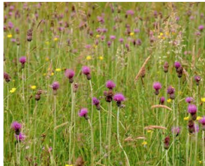
Spaanse ruiter in nat schraal hooiland