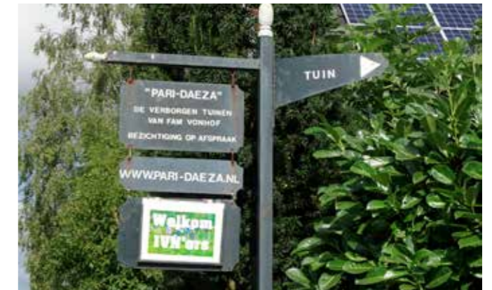
Hartelijke ontvangst bij de tuinexcursie in 2022