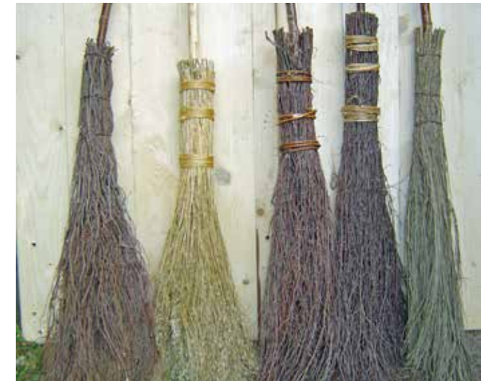
Verschillende soorten bezems

We praten tegenwoordig vaak over voedselbos, maar de natuurlijke omgeving is altijd een bron geweest waaruit je naar hartenlust kon oogsten. Bosbessen en in mindere mate vossenbessen werden massaal gezocht. Op de Velwezooom kwamen in de beste tijd van het jaar hele families uit Groesbeek bosbessen verzamelen. De bessen werden ook met duizenden kilo's aangeboden op streekmarkten en bij hotels en restaurants. De firma's Jansen uit Groesbeek en Van den Brink uit Eerbeek kwamen daarna in het winterseizoen jonge berken snijden voor het maken van berkenbezems. Grote steden als Amsterdam en Rotterdam hebben tot in deze eeuw nog gebruik gemaakt van deze, volgens de straatvegers beste bezems ooit.