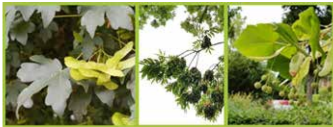
Esdoorn, es en linde krijgen elk jaar veel vleugeltjes.