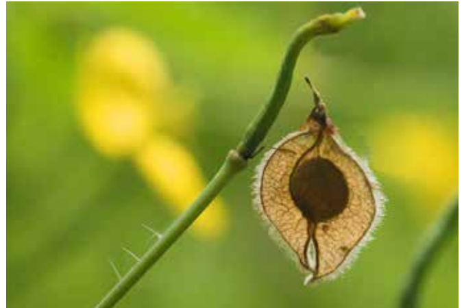
Het gevleugelde zaad van de iep, net een eitje.

Al wandelend zie ik overal om me heen bomen, vol met vruchten. Althans, dat is wat ik denk dat ik zie. Want wanneer is er sprake van vruchten en wanneer van zaden?