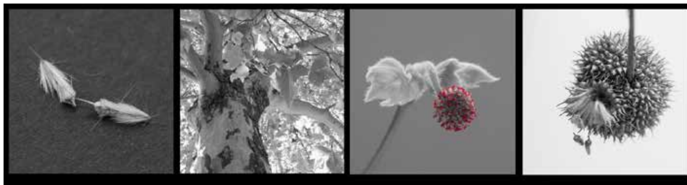
De zaadjes van de plataan, die vanuit de prachtige rode bloeiwijze ontstaan.

Dit geldt ook voor de zaadjes van de esdoorn, iep, es en linde. Deze laatste versieren al weken lang de stoepen in onze buurt. Dan is er nog de plataan met de vruchtbolletjes, net kleine bitterballen, waarvan de vele kleine zaadjes vederlicht zijn en dus ook prima door de wind meegenomen kunnen worden.