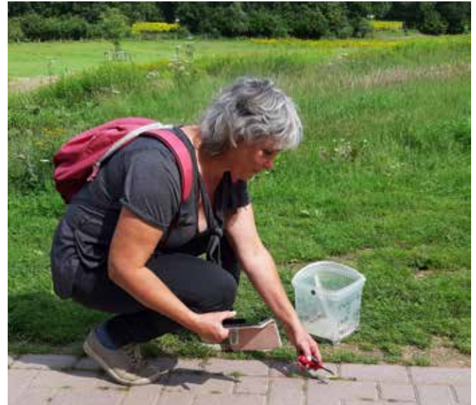
Rapen 'buiten de poort' op de Heuven

we het nog niet eens gehad over het gevaar van een natuurbrand, als gevolg van een achteloos weggegooide peuk.