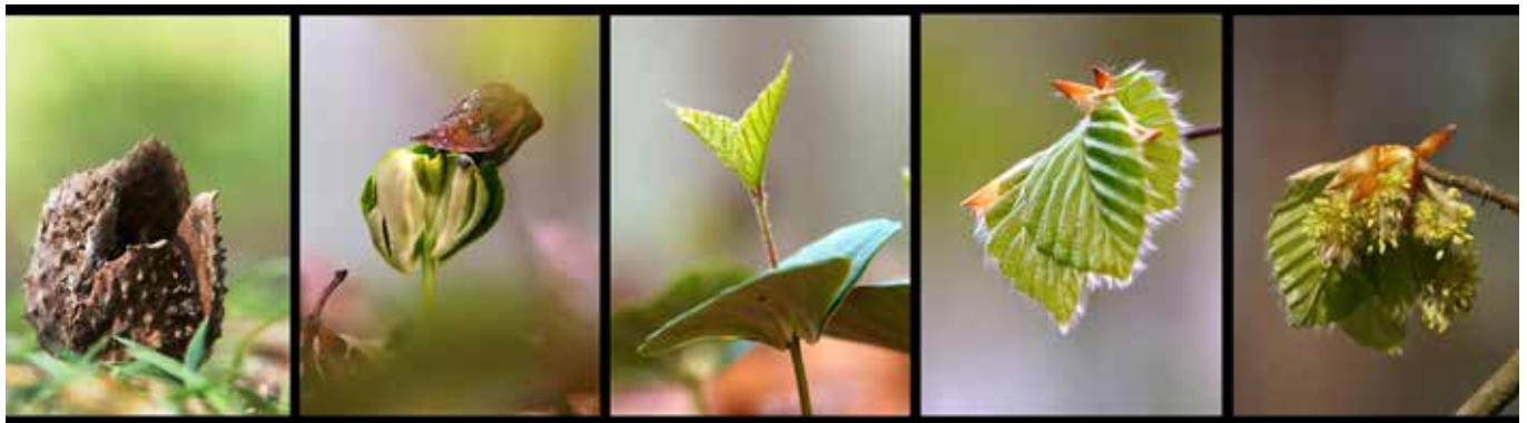
Het lege napje van het beukenootje (fluweelzacht van binnen), het zaadje laat met het 'hoedje' nog net de beschermende laag zien, de kiembladeren, en tenslotte de bladeren en de bloemen.

De vrucht is ook zo'n beschermende laag. Het is het deel van de bloem dat rondom het zaad (de zaadjes) komt en dat dient als een soort vervoermiddel, om zo het vele zaad ver van de moederplant de beste kans te geven om zich te ontwikkelen. Want de plant wil zich voortplanten, voortbestaan. Daarvoor moet een enkel zaadje in 'goede aarde vallen' en tussen alle concurrentie tot bloei komen.