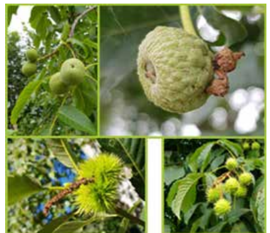
Gladde walnoot, eikel nog verborgen in het napje, de tamme- en de paardenkastanje.

Oké, ik kijk dus naar de vrucht. Daarbij zie ik veel diversiteit. Eerder dit jaar was de straat wit van de pluizige zaden van de populier. Nu zie ik vlezige vruchten, zoals appel, kers of bes. Droge, harde vruchten die openspringen, zoals de peul van de Robinea, de paardenkastanje. Maar ook de droge, harde vruchten die niet openspringen, zoals eikel, hazelnoot, en de gevleugelde noten van es, iep en esdoorn. De walnotenboom heeft gladde vruchten, de kastanje stekelige vruchten. Kortom, er valt genoeg te beleven. Al die verschillen hebben uiteraard een functie. Ze helpen op hun eigen wijze bij de verspreiding van het zaad.